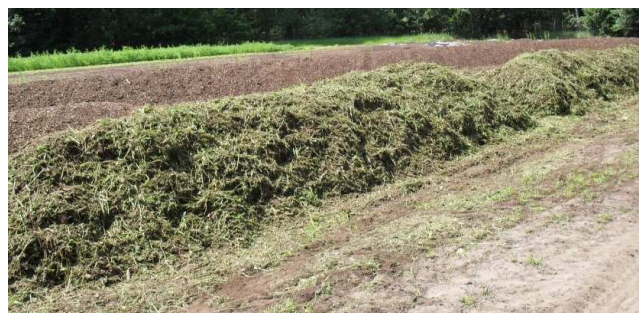
Rys. 4. Pryzmy po wymieszaniu Fig. 4. Experimental prisms after mixing

W okresie kompostowania mierzono temperaturę w pryzmach, której zmiany przedstawiono na rys. 5. Pobrano również próbki kompostów do analiz w następujących dniach kompostowania: 0, 5, 9, 21, 43, 72 i 293, oznaczając: