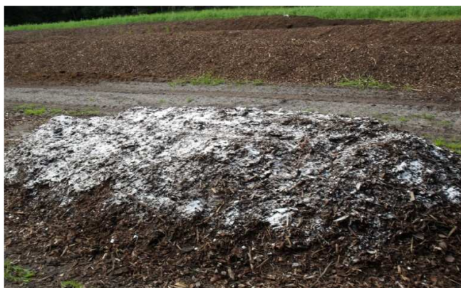
Rys. 2. Pryzma z mocznikiem Fig. 2. Pile with urea