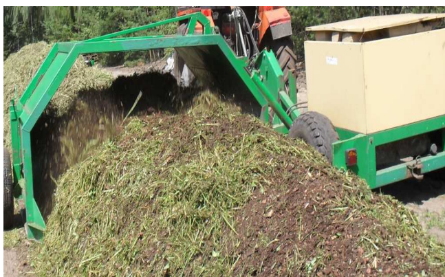
Rys. 3. Aerator podczas mieszania pryzmy Fig. 3. Aerator for mixing piles