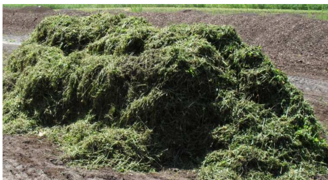
Rys. 1. Pryzma z korą i masą roślinną przed wymieszaniem Fig. 1. Experimental prism with bark and plant mixture prior to mixing

Pryzmy usypano z 4 m 3 kory sosnowej każda (rys. 1), do których dodano 0,3 kg P 2 O 5 (0,13 kg P) w formie superfosfatu pojedynczego (20% P 2 O 5 ) oraz 0,1 kg K 2 O (0,083 kg K) w formie soli potasowej 60% na metr sześcienny kory. Do pryzmy B zgodnie ze schematem dodano mocznik w ilości 1,0 kg N·m -3 kory. Z kolei do pryzm C i D dodano świeżą masę roślinną w ilości 2 Mg·pryzma -1 , a do pryzmy D wprowadzono jeszcze efektywne mikroorganizmy w ilości 3 dm 3 ·m -3 kory. Całość wymieszano dwukrotnie aeratorem ciągnikowym (rys. 2, 3). Masa roślinna to mieszanka seradeli ( Ornithopus perpusillus L.), gryki ( Fagopyrum esculentum ), peluszki ( Pisum sativum L. ssp. arvense (L.) i wyki ( Vicia sativa L.), uprawiana w warunkach polowych i zebrana 6 lipca przed kwitnieniem roślin.