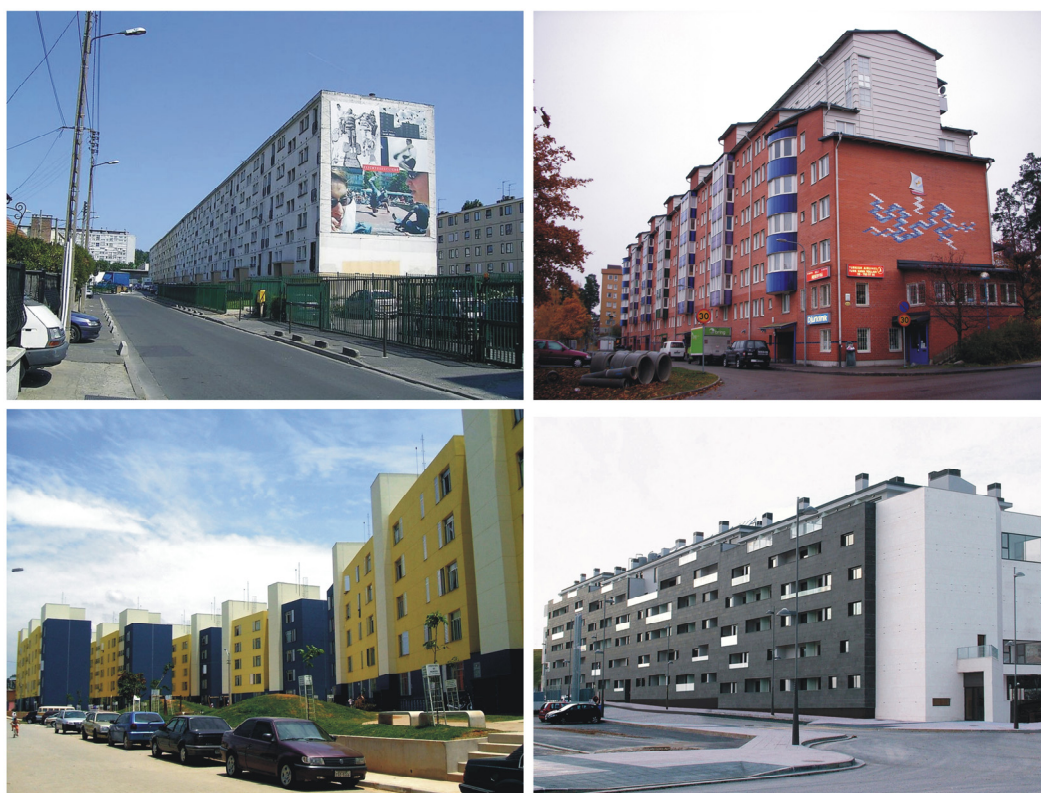
Ryc. 4. Mieszkalnictwo socjalne w Europie. Clichy-sous-Bois pod Paryżem – u góry po lewej. Rinkeby w Sztokholmie – u góry po prawej. Bazylea (Szwajcaria) – u dołu po lewej. El Astillero w Kantabrii (północna Hiszpania) – u dołu po prawej.

W większości państw europejskich obowiązek zapewnienia mieszkań socjalnych spoczął na gminie. Oprócz tego obciążały ją również inne ważne i kosztochłonne zadania – zapewnienie czystości i porządku, funkcjonowania infrastruktury drogowej i technicznej oraz szkolnictwa. W Polsce po upadku komunizmu w ramach reformy samorządu terytorialnego do gmin stopniowo zaczęto przekazywać uprawnienia władz wyższych szczebli. W ten sposób zwiększyły się prerogatywy podstawowej jednostki samorządu terytorialnego, ale w przytłaczającej większości wypadków przyczyniły się również do jej permanentnej niewydolności funkcjonalnej.