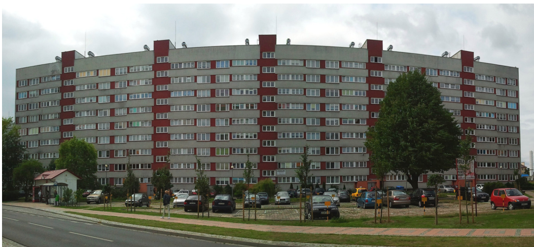
Ryc. 2. Budynek prefabrykowany 1-LG-600 w Świnoujściu, tak zwany Leningrad (2012). Fig. 2. 1-LG-600 prefabricated building in Swinoujście, so-called „Leningrad” (2012).