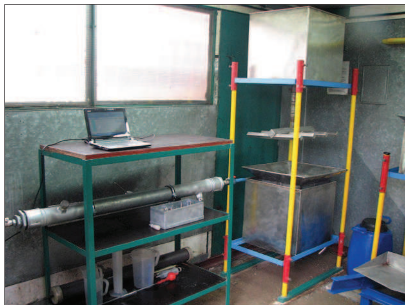
Fot. 4. Stanowiska badawcze(po lewej stronie): do monitorowania mikrośrodowiska w instalacjach wodociągowych (PE). Wynalazek opublikowany w: Biuletynie Urzędu Patentowego z dnia 10.09.2012 r., nr 19(1010)/2012