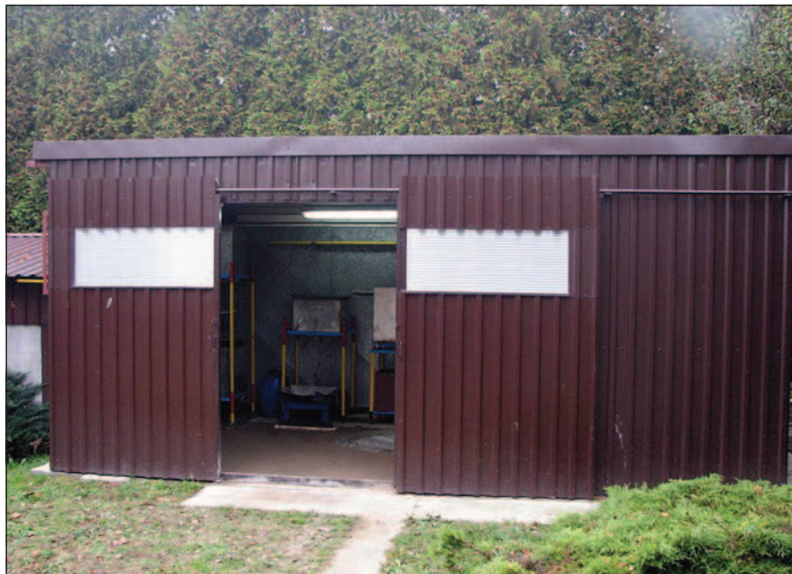
Fot. 2. Laboratorium inżynierii wodnej i glebowo-gruntowej. Instytut Badawczo-Rozwojowy Inżynierii Łądowej i Wodnej EUROEXBUD w Kaliszu, fot. Z. Staszewski, 2012r.