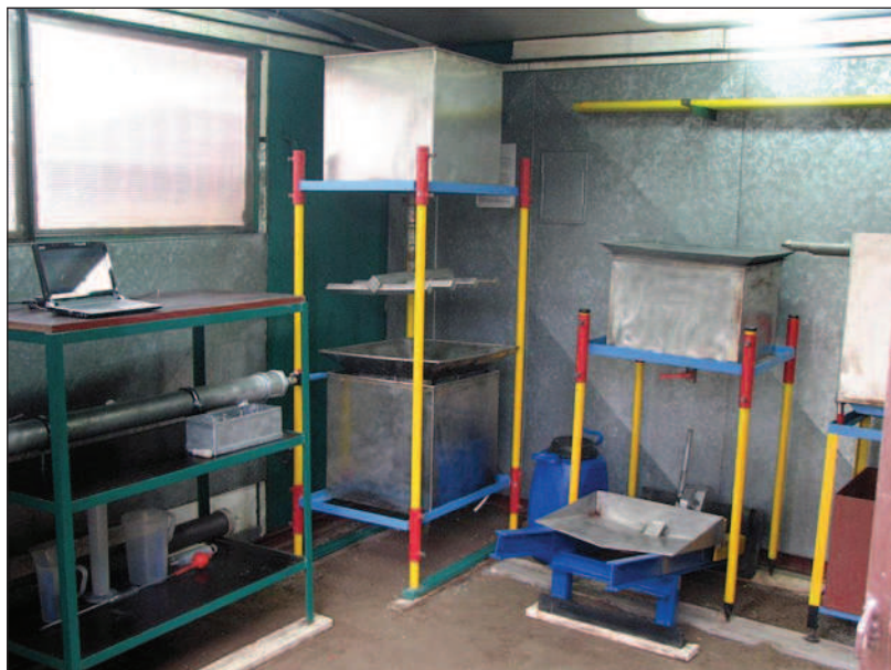
Fot. 3. Stanowiska badawcze (narożnik i po prawej stronie): do monitorowania przemieszczającej się wody w strefie aeracji profilu glebowego – Patent nr 195569, Urząd Patentowy RP, fot. Z. Staszewski, 2013r.