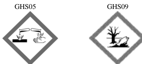
Rys. 1. Kod hasła ostrzegawczego: „Niebezpieczeństwo”. Piktogramy określone w rozporządzeniu WE nr 1272/2008 (CLP) mają czarny symbol na białym tle z czerwonym obramowaniem, na tle szerokim, aby było wyraźnie widoczne