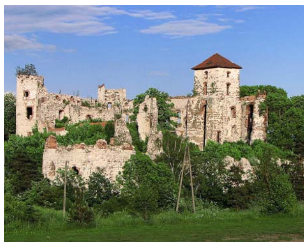
Fot. 6. Widok na ruiny zamku Tenczyn we wsi Rudno. Photo 6. View of the ruins of the Tenczyn castle in Rudno village.

Coming back to the main current of these considerations, one has to draw attention to the fact that in small, peripheral centres, devoid of classical city-creation factors, tourism is a potential direction of development – tourism based on local attractions resulting from historic collections, historic or landscape values etc. For such a programme of enlivening the discussed centres to be successful, certain conditions have to be fulfilled, such