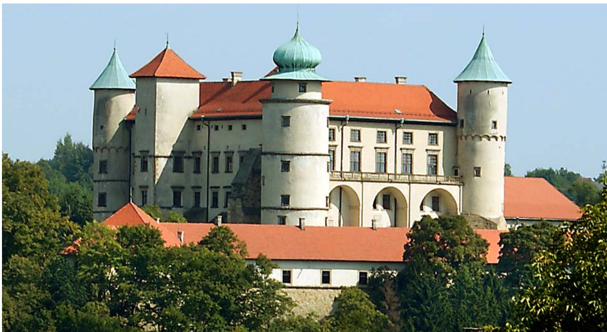
Fot. 1. Zamek Lubomirskich w Nowym Wiśniczu. Photo 1. The Lubomirski castle in Nowy Wiśnicz.