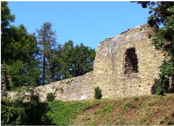
Fot. 10. Ruiny zamku w Lanckoronie. Fot. D. Kuśnierz-Krupa, 2012 Photo 10. Ruins of the castle in Lanckorona. Photo by: D. Kuśnierz-Krupa, 2012