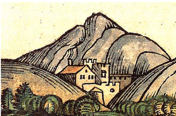
Ryc. 2. Widok zamku w Skawinie (wg. J. Mitkowskiego) w panoramie Krakowa z Kroniki Świata Hartmanna Schedla – 1493 r., ([w:] MHMK, nr inw. MHK 1591/8)

Współczesne zasady ochrony zabytków oparte są na ustawodawstwie wywodzącym się z okresu międzywojennego, zdefiniowanym w 1962 roku, później kilkakrotnie nowelizowanym; obecnie wymagają dalszej aktualizacji i przystosowania do zmieniającej się sytuacji wolnorynkowej, która uległa zasadniczym przeobrażeniom po 1989 roku. W konsekwencji owych pozytywnych przemian ustala opiekunczą rolę państwa w stosunku do zabytków, z wyjątkiem najcenniejszych zespołów i obiektów. Poza zasięgiem dotacji państwowych pozostały tysiące cennych obiektów, z których