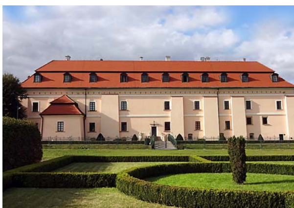
Fot. 2. Widok na zamek w Niepołomicach. Fot. D. Kuśnierz-Krupa, 2014 Photo 2. View of the castle in Niepołomice. Photo: D. Kuśnierz-Krupa 2014