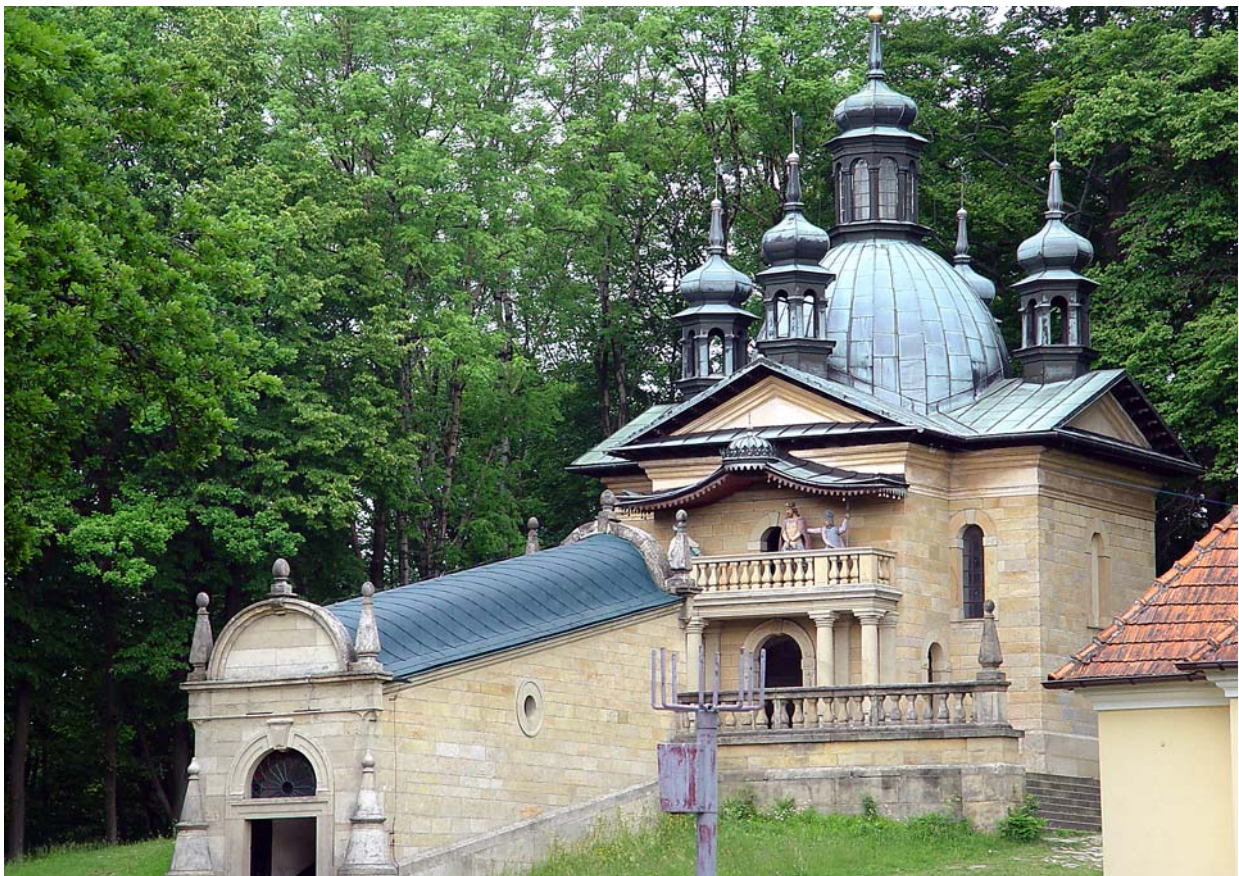
Fot. 9. Kalwaria Zebrzydowska. Droga Kalwaryjska, widok na Ratusz Piłata. Photo 9. Kalwaria Zebrzydowska. The Calvary Route, view of the Pilatus Palace.

Wówczas zaistnieje szansa, że dzięki turystyce w danym ośrodku pojawią się nowe miejsca pracy, poprawi się infrastruktura, a w konsekwencji także rozwinie gospodarka 8 .