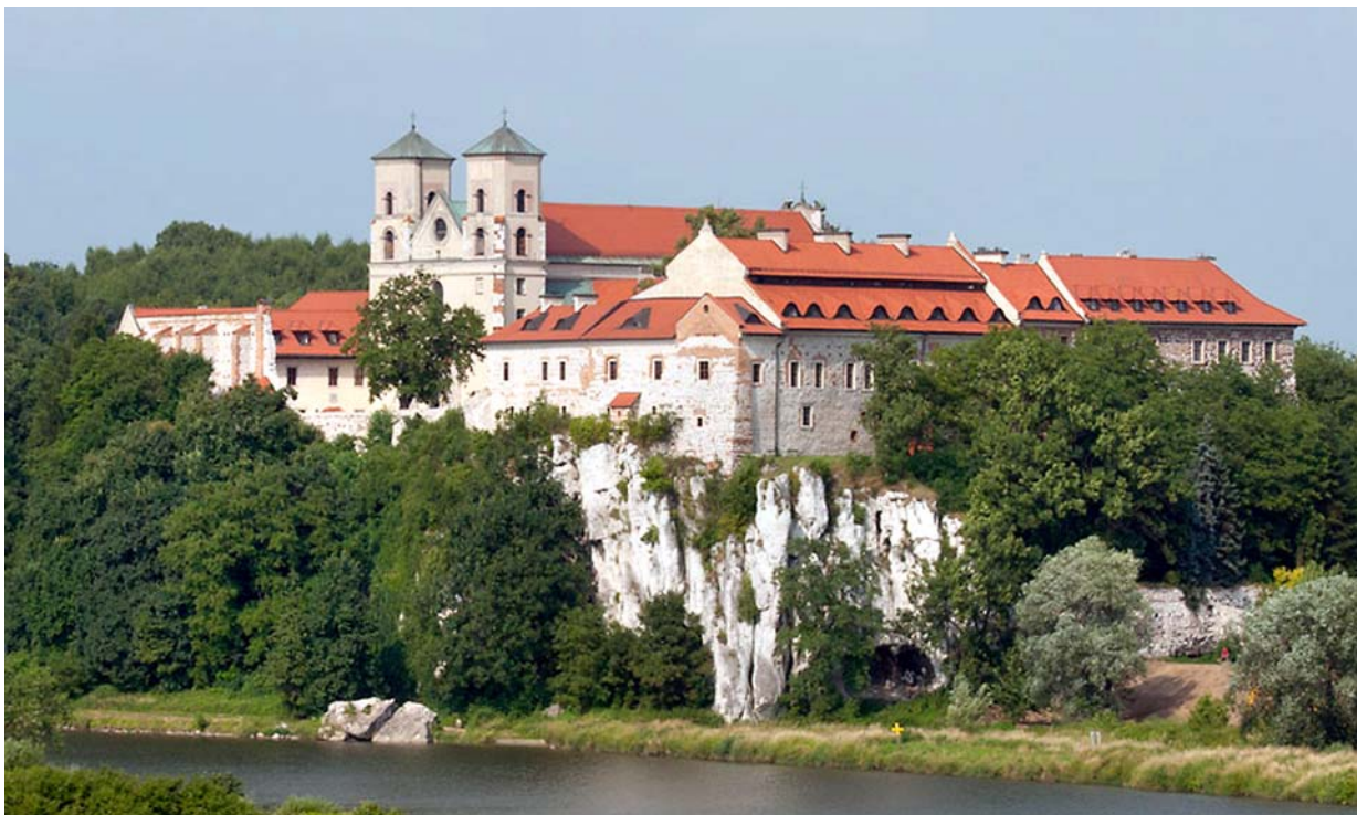
Fot. 5. Widok na klasztor Benedyktynów w Tyńcu. Photo 5. View of the Benedictine Monastery in Tyniec.

powodniej promocji ich dziedzictwa kulturowego jako „produktu turystycznego”. Teza ta wymaga pewnego wyjaśnienia, choć problem funkcji turystycznej obiektów i zespołów zabytkowych jest już znany i omawiany 5 .