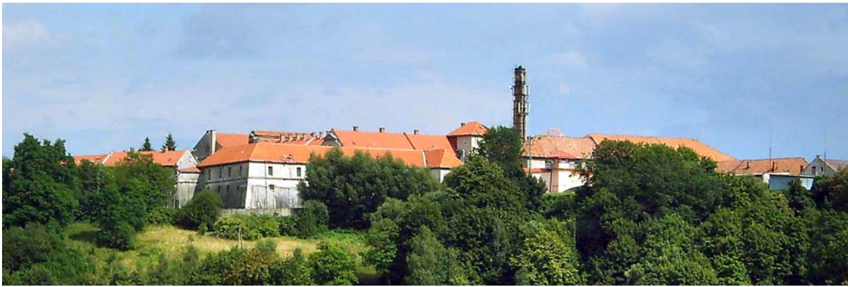
Fot. 4. Dawny klasztor w Nowym Wiśniczu. Photo 4. Former monastery in Nowy Wiśnicz.

Współczesne zasady ochrony zabytków oparte są na ustawodawstwie wywodzącym się z okresu międzywojennego, zdefiniowanym w 1962 roku, później kilkakrotnie nowelizowanym; obecnie wymagają dalszej aktualizacji i przystosowania do zmieniającej się sytuacji wolnorynkowej, która uległa zasadniczym przeobrażeniom po 1989 roku. W konsekwencji owych pozytywnych przemian ustala opiekunczą rolę państwa w stosunku do zabytków, z wyjątkiem najcenniejszych zespołów i obiektów. Poza zasięgiem dotacji państwowych pozostały tysiące cennych obiektów, z których