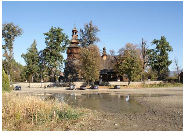
Fot. 11. Kościół pw. Marii Magdaleny w Rabce-Zdroju. Fot. D. Kuśnierz-Krupa, 2011 Photo 11. Church of St. Mary Magdalene in Rabka-Zdroj. Photo: D. Kuśnierz-Krupa, 2011

w tej jednostce jest zespół kościelno-klasztorny oraz droga kalwaryjska w Kalwarii Zebrzydowskiej. Zespół ten jest wpisany na Listę Światowego Dziedzictwa Kultury UNESCO. Jednostkę tę uzupełniają: drewniane miasteczko Lanckorona z ruinami średniowiecznego zamku fundacji króla Kazimierza Wielkiego założonego przy granicy Dzielnicy Senioralnej z Księstwem Oświęcimsko-Zatorskim (granica na rzece Cedron) oraz Zator z historycznymi stawami oraz aleją lipową. Listę ważnych obiektów zabytkowych tej jednostki kończy zespół pałacowy w Suchej Beskidzkiej.