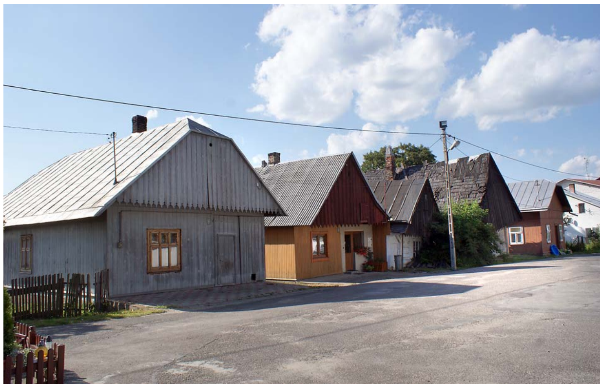
Fot. 12. Drewniana historyczna zabudowa w Jaśliskach.  Photo 12. Historic wooden buildings in Jaśliska.