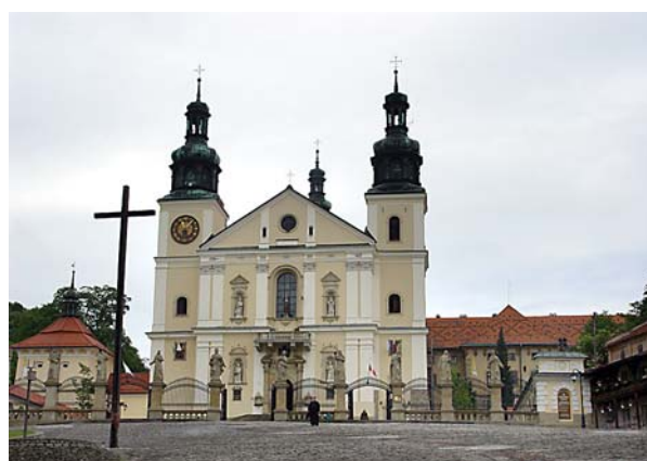
Fot. 3. Klasztor Bernardynów w Kalwarii Zebrzydowskiej. Widok na elewację frontową. Photo 3. Bernardine Monastery in Kalwaria Zebrzydowska. View of the front elevation.

w Łobzowie (letnia rezydencja królów polskich) itp. Należy też wymienić tutaj zespół zamków Jury Krakowsko-Częstochowskiej; tyniecki zespół zamkowo-kościelno-klasztorny z pobliską Skawiną; zespół zabytków w dorzeczu Popradu (zamki, miasta, uzdrowiska i in.); zespoły zabytkowe dorzecza górnego Dunajca 4 (m.in. zespoły zabudowy drewnianej Chochołowa, wsi spiskich, drewniane kościoły Dębna, Łopusznej, Nowego Targu i in). Zbiór ten uzupełniają inne ważne ośrodki zabytkowe, takie jak Wieliczka i Bochnia, stanowiące „zagłębie solne” oraz wyróżniająca się wybitnymi walorami artystycznymi, przestrzennymi i kompozycyjnymi Kalwaria Zebrzydowska (wpisana na Listę Światowego Dziedzictwa Kultury UNESCO). Wymieniony wyżej zasób ze względu na swoją unikalność oraz wartości kulturowe wyróżnia się na mapie kulturalnej Europy. Ma on szereg nośników, wśród których pojawia się także funkcja turystyczna.