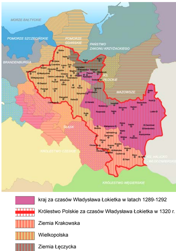
Ryc. 1. Mapa Polski na przełomie XIII i XIV wieku z podziałem na Ziemię Krakowską, Wielkopolskę i Ziemię Łęczycką (oprac. D. Kuśnierz-Krupa)