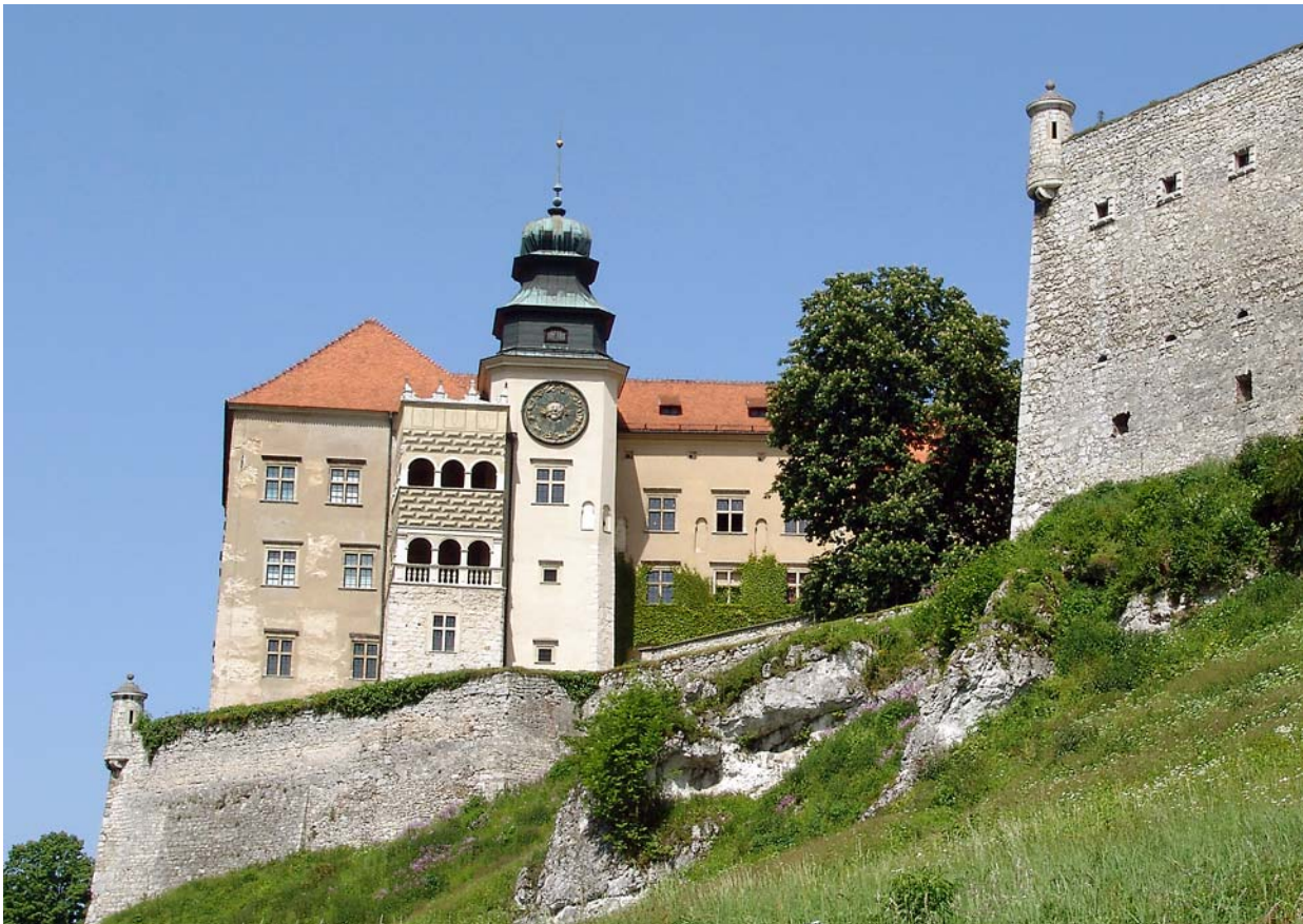
Fot. 7. Zamek w Pieskowej Skale. Photo 7. Castle in Pieskowa Skala.

hotelowy z towarzyszącymi mu funkcjami o charakterze kulturalnym 7 . Takich przykładów jest więcej, m.in. zespoły pałacowo-ogrodowe w Sieniawie czy Dubiecku. Nieco innym przykładem jest Muzeum Dom Rodzinny Jana Pawła II w Wadowicach, które jest obiektem o wielkich wartościach emocjonalnych, odwiedzanym przez tysiące turystów z całego świata. Przedmiotowe Muzeum zostało zrewaloryzowane i unowocześnione w 2013 roku. Utrzymane jest w wysokim standardzie estetycznym i jest typowym „produktem turystycznym”, gdyż nie dąży do odtworzenia pierwotnego „klimatu” domu, w którym wychował się Jan Paweł II, ale jest celowo, wtórnie, „uatrakcyjnione” z myślą o przybywających tam turystach. Można by tutaj mnożyć przykłady muzeów, których funkcja nierozdzielnie związana jest z komercją, np. kraina Amiszów w Pensylwanii czy park kulturowy w Dawson na terytorium Jukon w Kanadzie (centrum dystrybucji złota z Doliny Klondike).