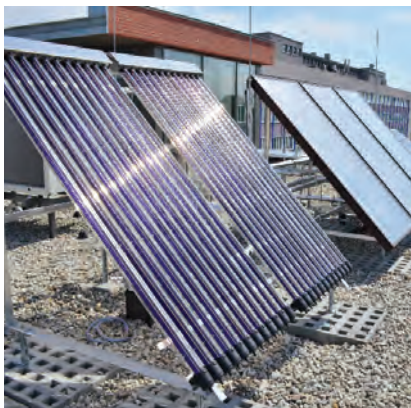
Fot. Odnawialne źródła energii zamontowane na dachu budynku MLBE

kollektory słoneczne płaskie i próżniowe, panele fotowoltaiczne stacjonarne i umieszczone na ruchomych żaluzjach zewnętrznych oraz dwa niezależne gruntowe powietrzne wymienniki ciepła. Zarówno ilość, jak i moc podstawowych źródeł ciepła i chłodu jest przewymiarowana względem potrzeb budynku. Umożliwia to projektowanie różnorodnych scenariuszy badawczych pracy urządzeń i instalacji technicznych, a także optymalizację strategii sterowania. System sterowania i automatyzacji zarządza także pracą trzech systemów wentylacji z nagrzewnicami, chłodnicami i rekuperacją. We wnętrzu budynku wyodrębniono niezależne strefy klimatyczne i energetyczne, wyposażone w pracujące i monitorowane niezależnie systemy grzewcze, chłodnicze i wentylacyjne o różnym charakterze i parametrach. W pomieszczeniach zastosowano m.in. klimakonwektory dwu- i czterorurowe, układy grzewczo-chłodnicze podłogowe, ścienne, sufitowe, belki chłodzące aktywne oraz pa-