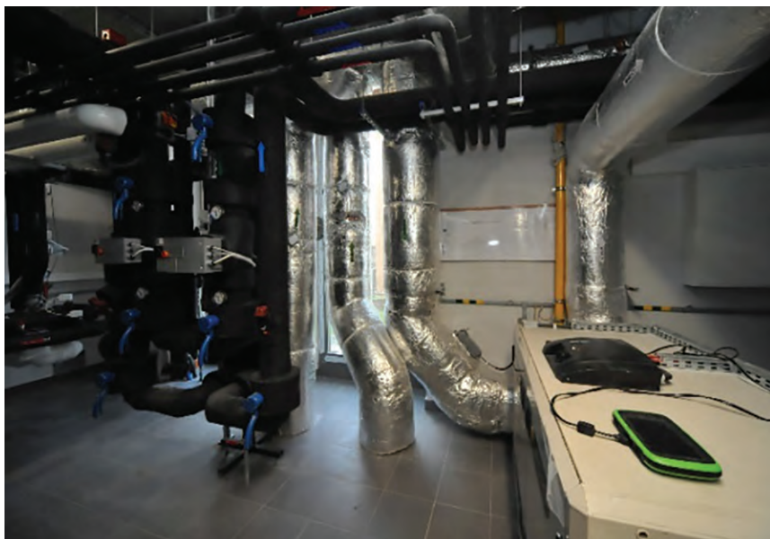
Fot. Centrala wentylacyjna w pomieszczeniu maszynowni MLBE, współpracująca z poziomymi gruntowymi wymiennikami ciepła

Małopolskie Laboratorium Budownictwa Energooszczędnego posiada wszelkie atrybuty budynku inteligentnego. Zachodzące w nim procesy są w pełni zautomatyzowane. Cechą wyróżniającą MLBE spośród innych budynków inteligentnych są imponujące możliwości badawcze. Zastosowany zintegrowany system sterowania i automatyzacji dysponuje unikatowymi możliwościami postrzegania środowiska. Na bieżąco rejestrowane są dane pomiarowe z około 3 tysięcy specjalistycznych czujników. Wśród nich duża część jest zatopiona w ścianach lub umieszczona głęboko pod ziemią. Zintegrowany system zarządza także zasilaniem budynku w energię pochodzącą ze zróżnicowanych źródeł, w tym ze źródeł odnawialnych. Do dyspozycji naukowców pozostają zarówno te tradycyjne, jak kocioł gazowy lub węzeł MPEC, jak i ekologiczne, takie jak pompy ciepła: powietrzna, gazowa, gruntowa wykorzystująca pionowe sondy pod budynkiem,