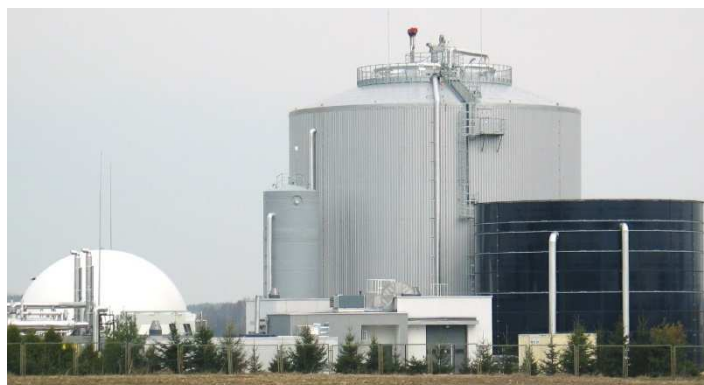
Rys. 2. Reaktor beztlenowy, zbiornik osadu, serwatki i biogazu