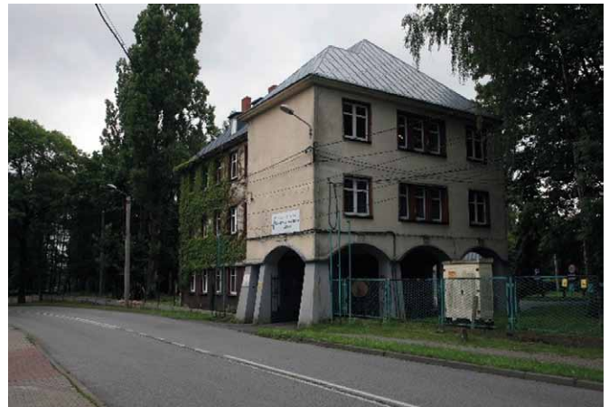
Rys. 1. Kopalnia Doświadczalna „Barbara” w Mikołowie