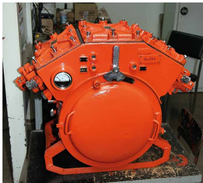
Rys. 3. Ognioszczelny wyłącznik typu OW 206K

W roku 1972 wydano nową edycję Polskich Norm z zakresu bezpieczeństwa przeciwybuchowego, dotyczących zarówno urządzeń górniczych, jak i urządzeń dla przemysłu chemicznego. Wymagania dla różnych rodzajów budowy opracowano w normie PN-72/E-08110 „Elektryczne urządzenia