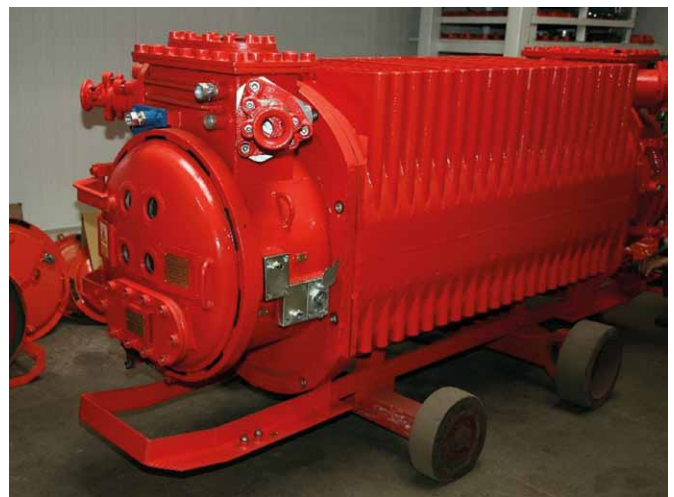
Rys. 2. Ognioszczelna stacja transformatorowa

konstrukcji urządzenia powinna potwierdzać uprawniona jednostka atestacyjna.