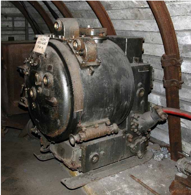
Rys. 4. Ognioszczelne pole rozdzielcze typu ROK 6 kV

Zagadnienie bezpieczeństwa w obwodach iskrobezpiecznych opracowano w 1972 roku, wydając normę PN-72/E-08107 „Urządzenia iskrobezpieczne”. Norma dzieliła urządzenia iskrobezpieczne na dwie klasy według oznaczeń I BI i II BI. Najwyższy stopień bezpieczeństwa miały urządzenia klasy II BI, przeznaczone do pomieszczeń o dowolnej koncentracji metanu. W roku 1984 normę tę zastąpiono normą PN-84/E-08107 „Urządzenia i obwody iskrobezpieczne”. Obwody iskrobezpieczne stanowiły wykonania, w których mogące powstawać iskry elektryczne w normalnym lub awaryjnym stanie pracy nie powodują zapalenia mieszaniny wybuchowej określonego gazu. Urządzenia elektryczne iskrobezpieczne posiadały wszystkie obwody elektryczne, wewnętrzne i zewnętrzne wraz ze źródłami zasilającymi w wykonaniu iskrobezpiecznym.