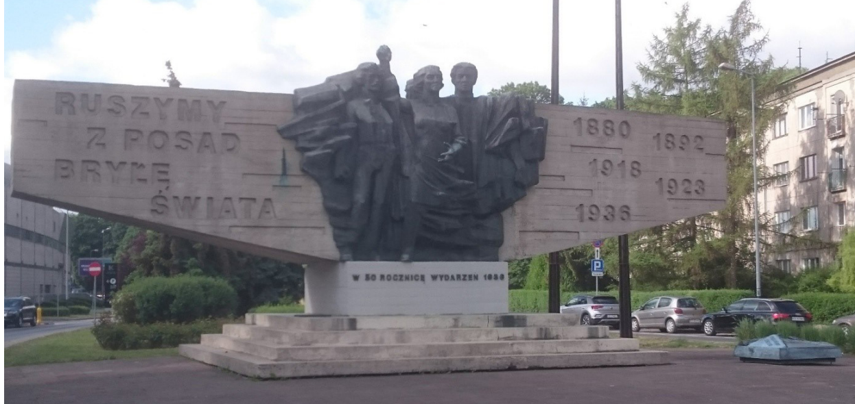
Il. 8. Sakralizacja miejsca – kontynuacja (pozostały: desygnat, znak i rytuał – obchodzi się tu m. in. Święto Pracy 1 Maja). Pomnik Czynu Zbrojnego Proletariatu Krakowa (Pomnik Semperitowców), wg projektu Antoniego Hajdeckiego, odsłonięty w marcu 1986 r. Kraków, aleja Ignacego Daszyńskiego. Istnieje do dzisiaj i jest miejscem rytuału środowisk lewicowych. Fot. L. Bylina, maj 2022

III. 8. SACRALISATION of a place – continued (remain in place: designatum , sign , and ritual – such events as the Labour Day on 1 May are celebrated here). Monument to the Militant Proletariat in Krakow (Semperit Labourer Monument) was designed by Antoni Hajdecki and unveiled in March 1986. Kraków Ignacego Daszyńskiego Avenue. It exists today and leftist rituals take place there. Photograph L. Bylina, May 2022