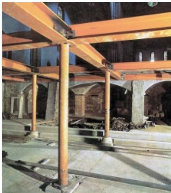
3. Florencja, Katedra Santa Maria Del Fiore: montaż konstrukcji nośnej stropu nad podziemnym rezerwatem bazyliki Santa Separata