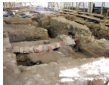
8. Kraków, Rynek Główny: odkopane relikty pomieszczeń Wagi Wielkiej zachowane pod nawierzchnią