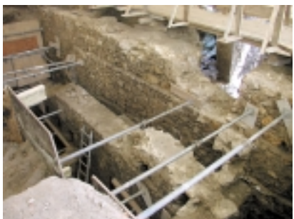
10. Kraków, Rynek Główny: odsłonięte relikty XIII-wiecznych kramów (?) odnalezione w uliczce XIV-wiecznych Kramów Bogatych