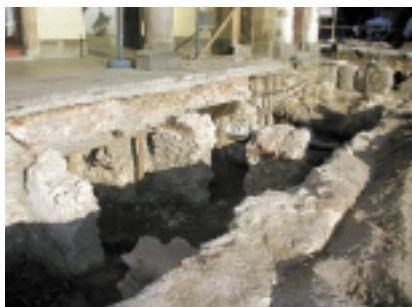
9. Kraków, Rynek Główny: odkopane relikty komór warsztatów pod nieistniejącymi sklepami Kramów Bogatych