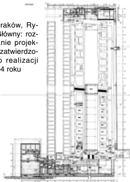
12. Kraków, Rynek Główny: rozwiązanie projektowe zatwierdzone do realizacji w 2004 roku