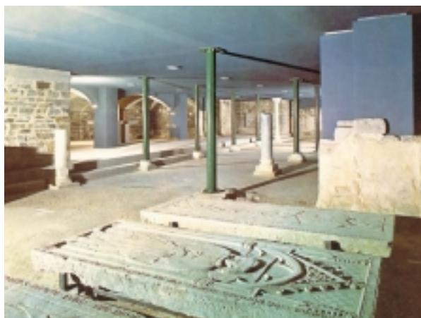
4. Florencja, Katedra Santa Maria Del Fiore: widok ukończonego wnętrza podziemnego rezerwatu