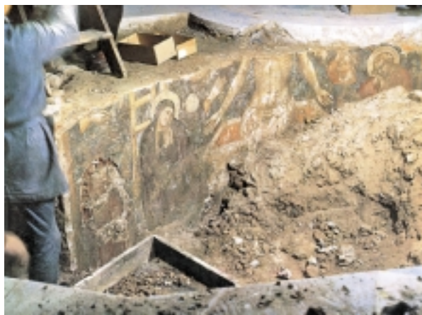
1. Florencja, Katedra Santa Maria Del Fiore: odsonięty po rozpoczęciu demontażu posadzki fragment polichromowanej ściany apsydy transeptu bazyliki Santa Separata