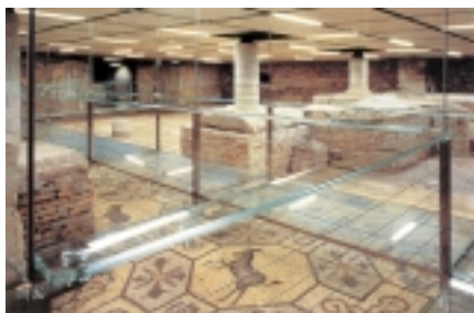
5. Aquileia: rezerwat architektoniczny eksponujący zachowane mozaiki pałacu Teodoryka z IV-VI wieku