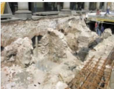
11. Kraków, Rynek Główny: montaż słupów i płyty stropowej przekrywającej relikty Kramów Bogatych