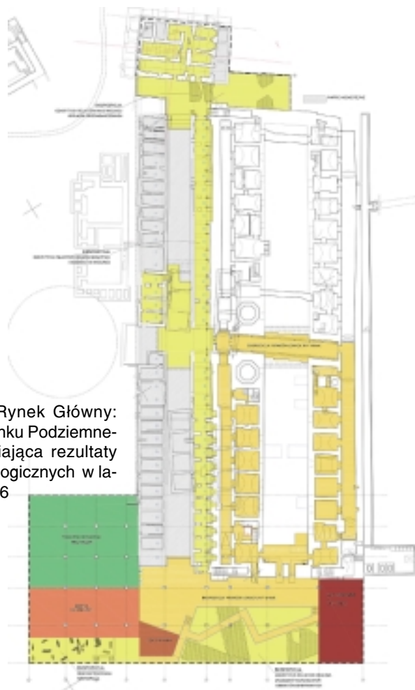
13. Kraków, Rynek Główny: koncepcja „Rynku Podziemnego” uwzględniająca rezultaty badań archeologicznych w latach 2005-2006