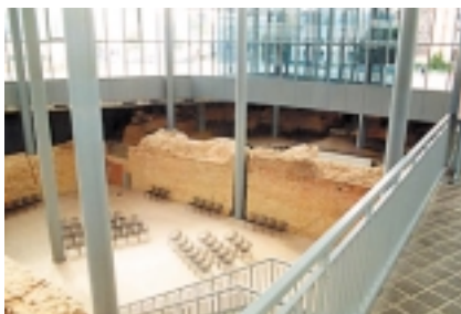
6. Trewir: widok hali na placu Viermarkt przekrywającej relikty odkrytych rzymskich term