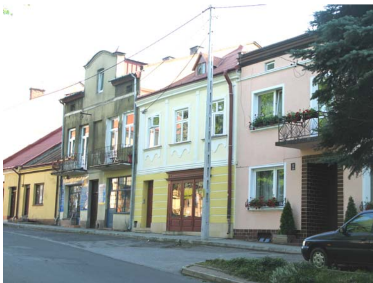
Ryc. 6. Tyczyn.

Wybrane do analizy miasta znajdują się blisko siebie, w centralnej części województwa. Liczba ich mieszkańców waha się w granicach 3,4–7,7 tys., co sprawia, że można zaliczyć je do miast małych. Dynów powierzchniowo jest największym ośrodkiem spośród analizowanych. Dominującą funkcją miast: Brzozowa i Dynowa jest turystyka. W przypadku Tyczyna jest to rolnictwo. Miasta są atrakcyjne ze względu na zabytki oraz walory krajobrazowe. W ich układzie urbanistycznym można wyróżnić historycznie ukształtowane rynki. Swoim mieszkańcom zapewniają bliskość usług i przestrzeni zielonych.