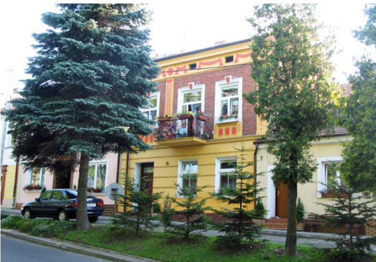
Ryc. 5. Tyczyn.

Fig. 4. Dynów.