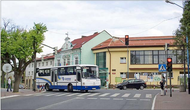
Ryc. 2. Brzozów.

tycko-renesansowy kościół św. Wawrzyńca, rynek z pomnikiem Władysława Jagiełły, pozostałości murów miejskich z drugiej połowy XVII w., dworki z XVIII i XIX w., w tym dwór Trzeciekich z 1750 lub 1760 r. w otoczeniu zabytkowej zieleni oraz kirkut z XIX w. Miasto przed wojną w dużej mierze zamieszkiwane było przez Żydów, którzy do dziś odwiedzają Dynów. W jego okolicach stacjonowały oddziały AK i WiN.