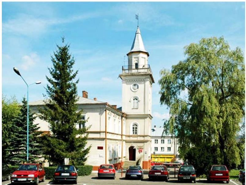
Ryc. 1. Brzozów.

Województwo w ponad 45% wpisane jest w system krajowej sieci ekologicznej. Ze względu na sprzyjające warunki prozdrowotne, wynikające m.in. z leczniczych właściwości natury, odpowiedniego klimatu, atrakcyjnego krajobrazu, obecności gazów leczniczych, peloidów oraz wód mineralnych, na terenie Podkarpacia powstały cztery uzdrowiska – Horyniec-Zdrój, Iwonicz-Zdrój, Polańczyk-Zdrój oraz Rymanów-Zdrój.