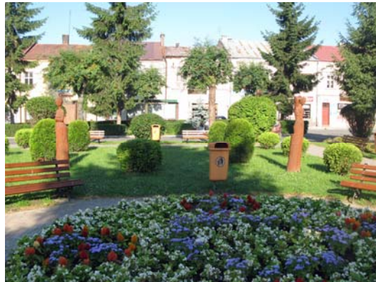
Ryc. 4. Dynów.

Fig. 3. Dynów.