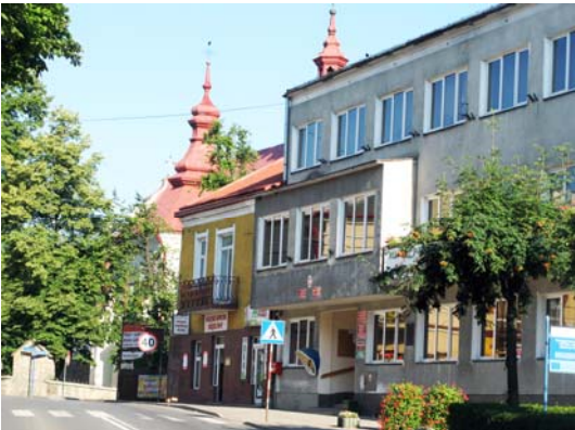
Ryc. 3. Dynów.

Fig. 2. Brzozów.