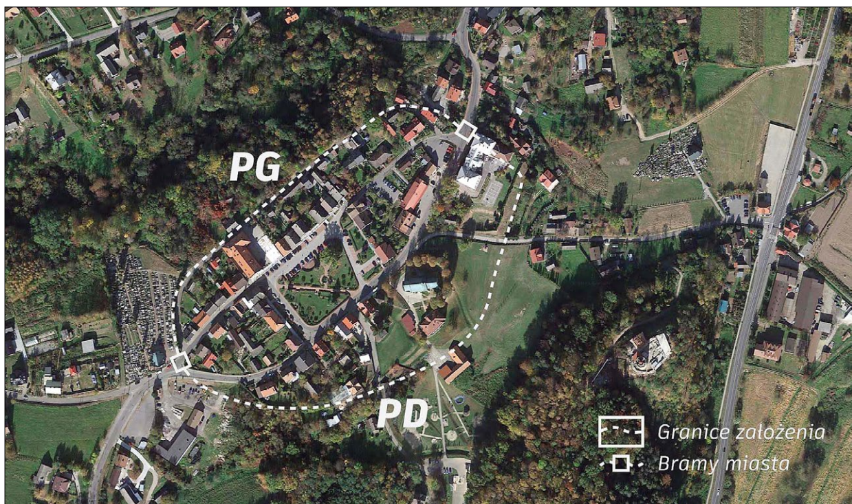
Ryc. 2. Czchów, przebieg granic centrum lokacyjnego naniesiony na współczesną mapę miasta; PG – Przedmieście Górne, PD – Przedmieście Dolne; oprac. autorka.