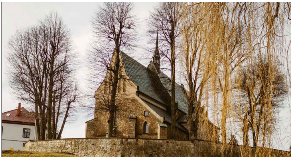
Ryc. 4. Kościół parafialny Narodzenia Najświętszej Marii Panny w Czchowie; źródło: https://dnidziedzictwa.pl/kosciol-pw-narodzenia-nmp-w-czchowie/ (dostęp: 4 IV 2022).