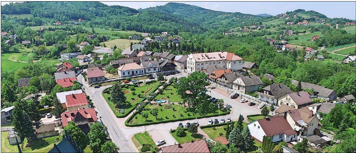
Ryc. 3. Rynek w Czchowie; źródło: https://www.czchow.pl/ (dostęp: 4 IV 2022).