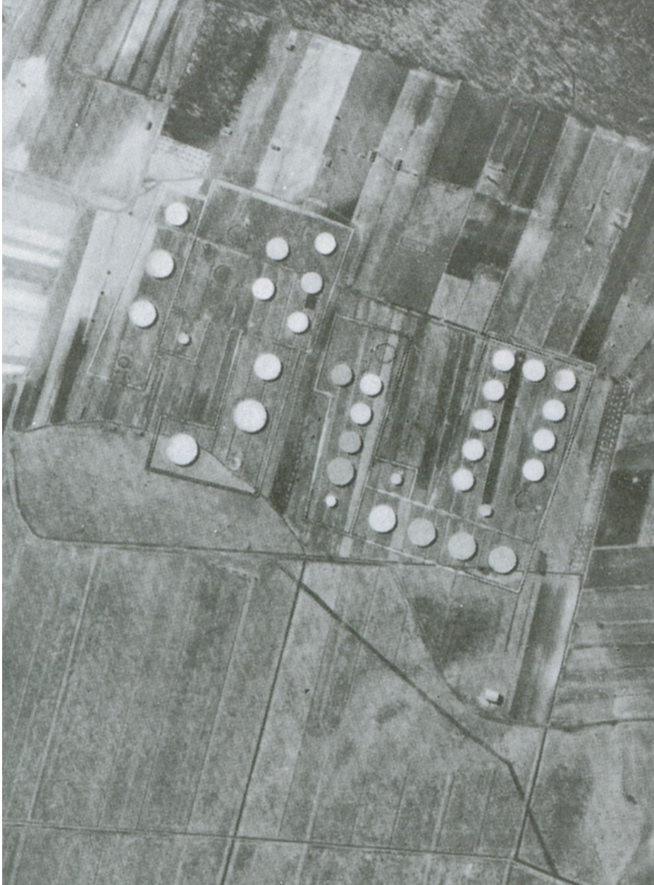
Rys. 3. Przykład kamuflażu stosowanego przez Niemców. 10 kilometrów na północ od fabryki benzyny syntetycznej w Policach (niem. Hydrierwerke Pölitz AG) zbudowano makietę mającą zmylić alianckich lotników podczas bombardowania. Przygotowana makieta jest łatwo identyfikowalna w dzień, jednak w nocy razem z towarzyszącymi jej efektami świetlnymi, ogniskami była dość często mylona z oryginalnymi obiektami i zostawała bombardowana [Price, 2003]