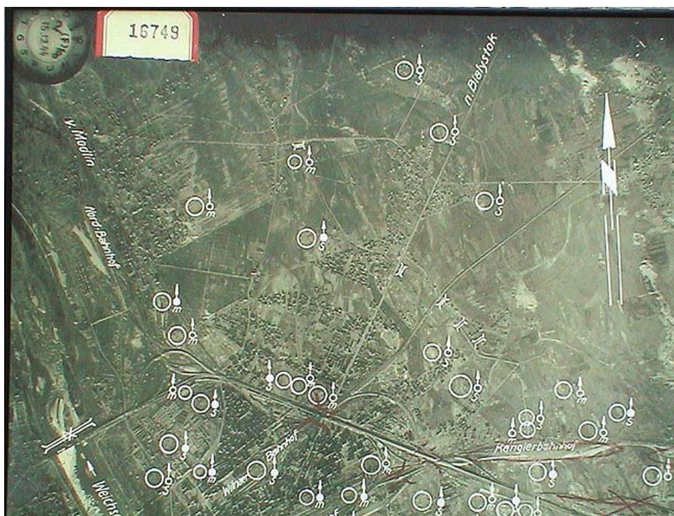
Rys.4. Niemiecki raport przedstawiający sytuację z 15 grudnia 1944 roku – fragment północnej Warszawy.

Na zdjęciu zaznaczono pozycje radzieckich stanowisk baterii przeciwlotniczych. Oznaczenia: s – ciężka bateria (kal. 60–159 mm), m – średnia (kal. 37–59mm)