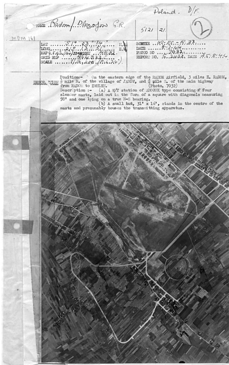
Rys. 2. Fragment raportu oznaczonego AIR 34/693.

Raport z 25 sierpnia 1944 dot. lotniska Radom-Sadków. Raport składa się z dwóch zdjęć oraz dwóch stron opisu. Dokładny opis zawiera m.in.: długości pasów, rozpoznanie dot. występujących budynków, hangarów, magazynów (również z wymiarami), listę stacjonujących w tym czasie samolotów z dokładnym rozpoznanem ich typów