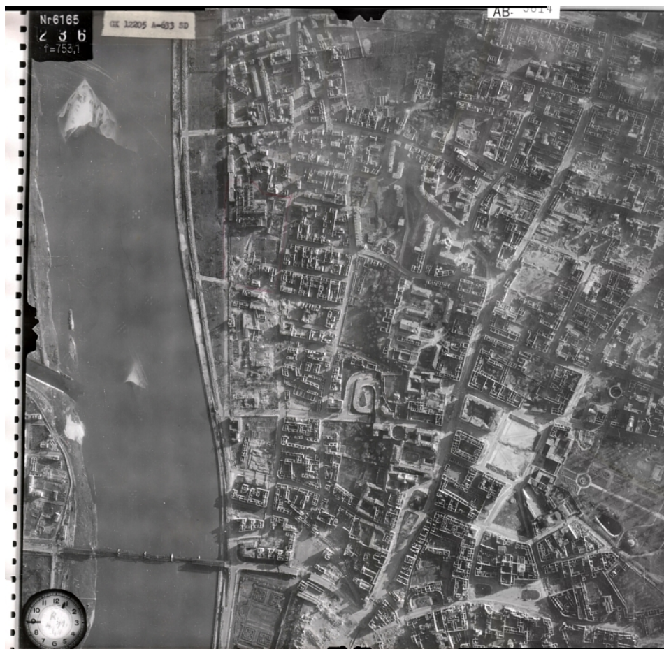
Rys. 1. Niemieckie zdjęcie Warszawy wykonane 5.11.1944.

Korpus kamery można było wyposażyć w jeden z trzech obiektywów o ogniskowych: 200 mm, 500 mm lub 750 mm. Dla przykładu oznaczenie kamery Rb 50/30 oznacza, że zdjęcie wykonano ogniskową 50 cm na perforowanym filmie o szerokości 32 cm. Dokładna długość ogniskowej była zapisywana na skraju zdjęcia wraz z kolejnym numerem zdjęcia. Np. zapis f=753.1\text{mm} (Rys. 1) wskazuje, że zdjęcie to wykonano kamerą RB 75/30.