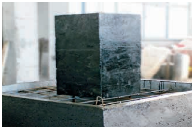
Ryc. 4. FHT produkcji WPŻ Elbud Gdańsk Sp. z o.o.

Konstruktorzy WPŻ Elbud Gdańsk Sp. z o.o. opracowali również kompatybilne ze skorupą FHT moduły budowy komina (ryc. 3 i 4). Występują one w dwóch wariantach wymiarowych: A – 60 x 60 x 20 cm, B – 80 x 120 x 20 cm, umożliwiając osiągnięcie w prosty i niezasochłonny sposób oczekiwanej wysokości komina.