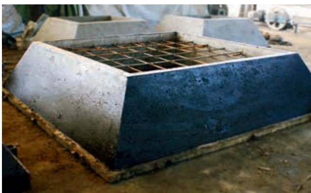
Ryc. 2. FHT produkcji WPŻ Elbud Gdańsk Sp. z o.o.

Fundamenty FHT dedykowane są pod budowę hal oraz innych obiektów, których konstrukcja nośna bazuje na strukturze stalowej lub żelbetowej.