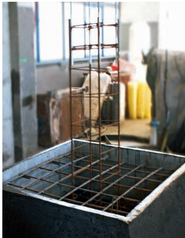
Ryc. 3. FHT produkcji i WPŻ Elbud Gdańsk Sp. z o.o.

Dzięki skorupowej konstrukcji (ryc. 1) fundamenty FHT pozwalają poczynić daleko idące oszczędności zarówno na etapie logistyki (transportu), jak również usprawnić proces ustawiania fundamentu w finalnej pozycji. Uzyskany dzięki powyższemu relatywnie krótki czas instalacji fundamentów FHT umożliwia dalszą redukcję roboczogodzin.