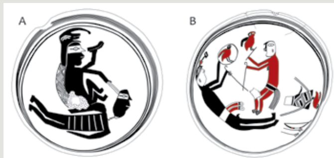
Rys. 3. (A) Scena dekapitacji – postać dominująca nosi charakterystyczne nakrycie głowy przypominające węża (miejsce przechowywania naczyń – nieznanie). (B) Postać mężczyzny i kobiety w trakcie tresury papug. Twarz postaci kobiecej ma cechy ptasie. Obie postaci posługują się zagiętymi kijami oraz obręczami używanymi w trakcie tresury. Dodatkowo po prawej stronie zobrazowany został charakterystyczny kosz służący do transportu m.in. ptactwa oraz luk i strzały (Logan Museum of Anthropology, rys. autorki).