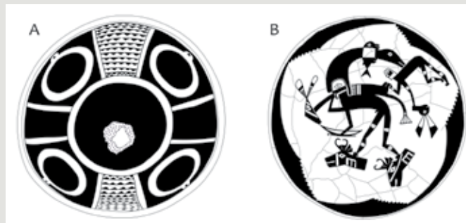
Rys. 4. (A) Ornament wykonany w technice negatywowej ukazujący cztery bransolety z muszli Glycymeris odnajdywane na terenach kultury Hohokam (Arizona State Museum). (B) Bracia bliźniacy w trakcie wędrówki na sklepieniu nieba, przedstawienie zawiera serię symboli. Prócz głów jelenia i królika (odniesienie do Słońca i Księżycy) trzymanych przez obie postaci w rękach, u stóp większej znajdują się także dwie głowy widłorogów oznaczających parę braci. Na głowie dominującej sylwetki namalowany został ptak śmierci, pożerający dusze zmarłych, tutaj uosabiane przez rybę zatkniętą na jego szyi (kolekcja prywatna, rys. autorki).

Stanów Zjednoczonych i z pewnością w żaden sposób nie odzwierciedlają rzeczywistości [6].