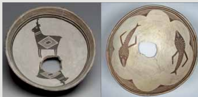
Fot. 2. Przykłady naczyń odnajdywanych na stanowiskach kultury Mimbres, ukazujące typową dla nich kolorystykę. Na misie po lewej stronie przedstawiono parę widłorogów (antylop), natomiast po prawej stronie znalezienia przypominające ryby, jednak z nietypowymi płetwami budzącymi skojarzenia z wyglądem ludzkich ramion. Dna naczyń, uszkodzone poprzez wybicie otworu, świadczą o ich odkryciu w miejscu pochówku (The Michael C. Rockefeller Memorial Collection, zdjęcia wykorzystano na zasadzie domeny publicznej: https://www.metmuseum.org/art/collection/search/310574 ; https://www.metmuseum.org/art/collection/search/310575 ).

Niezależnie od kunsztu wykonania ceramika Mimbres nie stanowiła prawdopodobnie przedmiotu luksusowego. Wiele fragmentów rozbitych naczyń odnalezionych zostało w kontekście domowym, co pozwala przypuszczać, że przed zniszczeniem były wykorzystywane w codziennych praktykach gospodarczych, takich jak podawanie posiłków lub magazynowanie żywności. Ślady codziennego użytkowania zdradzają także naruszone malowane powierzchnie mis. Podejrzewa się, że naczynia mogły pełnić też pewne funkcje w czasie ceremonii odbywanych w miejscu znalezienia obiektów [2, 19]. Pojedyncze misy stanowią ponadto standardowy element wyposażenia grobowego, gdzie trafiały po wcześniejszym uszkodzeniu, polegającym na przebicie w ich dnie małego otworu. W takiej formie nakładane były na głowę zmarłego, co sugeruje, że stanowiły ważny element obrzędów pogrzebowych.