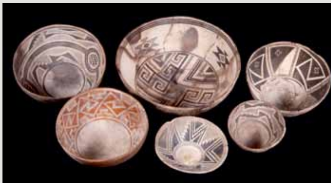
Fot. 1. Misy Mimbres zdobione ornamentem geometrycznym. Na większości naczyń zastosowano element dekoracyjny w postaci klasycznej szrafury składającej się z prostych, równoległych linii (Museum of Northern Arizona, fot. Ryan Belnap/Dan Boone).

przemiany obejmujące w różnym czasie większość Południowego Zachodu dzisiejszych Stanów Zjednoczonych. Wpłynęły m.in. na przejście na osiadły tryb życia, rozwinięcie się rolnictwa z przewagą uprawy kukurydzy, a także na wytwórczość ceramiczną [15].