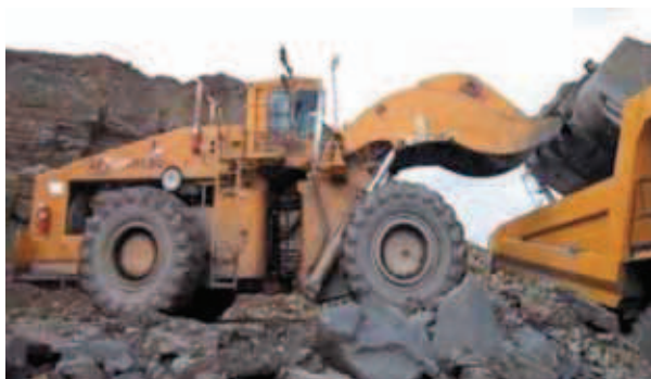
Rys. 10. Ładowarka łyżkowa Fig. 10. Bucket wheel loader