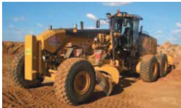
Rys. 11. Równiarka Fig. 11. Grader