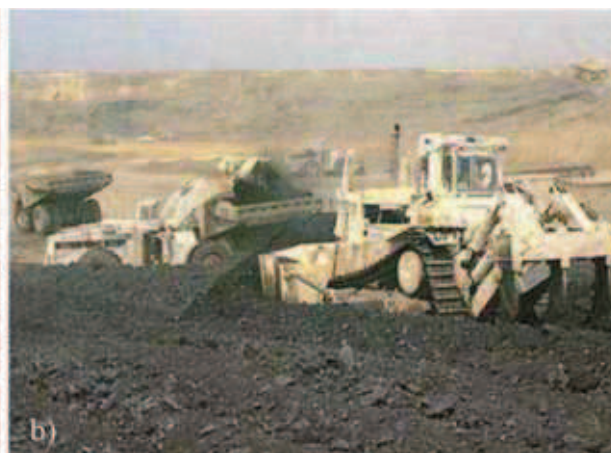
Rys. 4a i b. El Cerrejón: spycharko-zrywarki kruszące węgiel Fig. 4a and b. El Cerrejón: bulldozer-ripper crushing coal