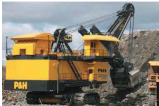
Rys. 3. Łyżkowa koparka linowa P&H 2800XPC Fig. 3. P&H 2800XPC bucket excavator

Koparki łyżkowe, obecnie głównie P&H 2800XPC (masa użyteczna w łyżce 60 t), (rys. 3), służą przede wszystkim jako maszyny ładujące. Urabianie za ich pomocą odbywa się w niewielkim stopniu. Liczba tych maszyn w kopalni wynosi 50 jednostek. Spycharko-zrywarek jest około 100, przy czym część z nich jest na podwoziu kołowym. Praca tych maszyn w polu eksploatacyjnym jest pokazana na rysunku 4a i b. Widoczne na tych rysunkach spycharki są produkcji firmy Caterpillar. Niektóre maszyny są wyposażone w tzw. system impact ripper realizujący zrywanie bardziej efektywnie od konwencjonalnych zrywarek dzięki mechanizmowi udarowemu będącemu na wyposażeniu tych maszyn. Są to maszyny typu D11N (moc 700 kW, masa 105 t).