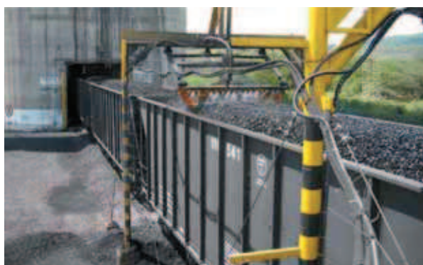
Rys. 8. Zwilżanie węgla przed transportem Fig. 8. Wetting coal prior to transport

Kolej jest również wykorzystywana do dostarczania podstawowych środków niezbędnych do funkcjonowania kopalni i eksploatowanego tam systemu maszynowego. Mowa tu o takich materiałach jak: olej napędowy, opony, części zamienne itd. Transport kolejną w obie strony wraz z załadunkiem i rozładunkiem węgla trwa ok. 12 godzin. W ciągu jednego dnia pociąg pokonuje trasę pomiędzy kopalnią a portem 9 razy.