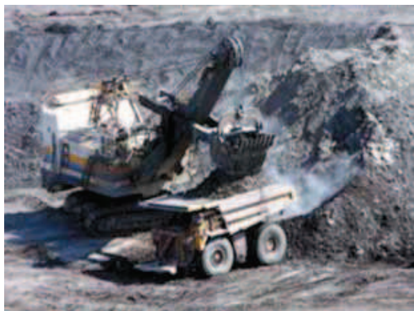
Rys. 5. El Cerrejón: koparka linowa ładująca na wozidła Fig. 5. El Cerrejón: power shovel loading dumper trucks