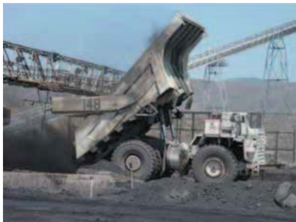
Rys. 6. El Cerrejón: rozładunek węgla do leja załadunkowego Fig. 6. El Cerrejón: unloading coal to the charging hopper