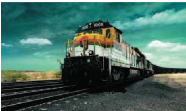
Rys. 9. Lokomotywa GE B36-7 Fig. 9. Locomotive GE B36-7

Niektóre stosowane lokomotywy to bardzo popularne swego czasu w Ameryce Północnej i Południowej jednostki typu GE B36-7. Są to lokomotywy czteroosiowe spalinowo-elektryczne produkowane przez GE Transportation Systems w latach 1980 i 1985. Część maszyn powstała specjalnie na potrzeby kopalni El Cerrejón; są to maszyny o mocy 2700 kW (rys. 9).