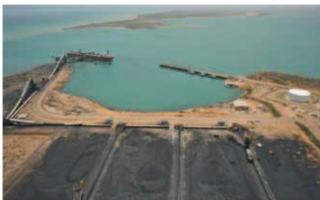
Rys. 12. Jeden z największych portów węglowych na świecie Fig. 12. One of the largest coal terminal in the world