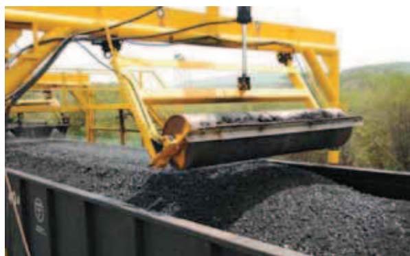
Rys. 7. Wyrównywanie węgla po załadunku Fig. 7. Levelling coal after loading