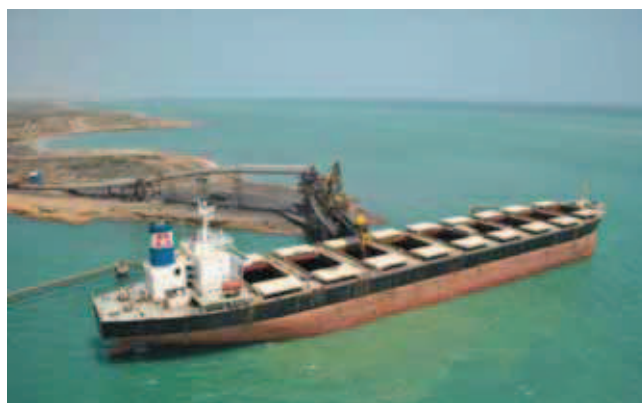
Rys. 13. Załadunek statku w porcie Bolivar Fig. 13. Ship loading in Puerto Bolivar harbour

http://www.cerrejon.com/site/english/press-room/multi-media-gallery/puerto-bolivar.aspx