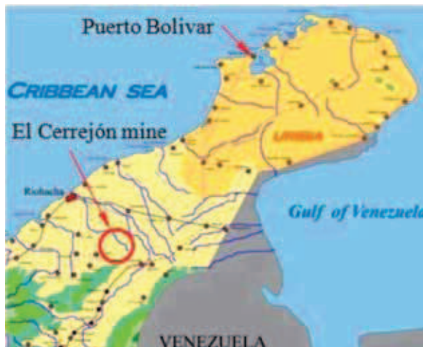
Rys. 1. Lokalizacja kopalni i portu Puerto Bolivar Fig. 1. Location of the mine and the Puerto Bolivar harbour

W wyniku przeprowadzonych badań geologicznych stwierdzono, że w tym rejonie, obejmującym 70 hektarów, jest około 40 złóż węgla możliwych do wydobywania i których eksploatacja ma sens ekonomiczny. Węgiel charakteryzuje się dobrą jakością; zawartość siarki jest niska – 0,7 %, zawartość popiołów – 7,5 %. Głębokość zalegania złóż nie przekracza 100 m. Pokłady mają grubość od 0,7 do 10 m. Średnia grubość pokładu to około 3m, a średnie nachylenie to 16°. W obszarze tym w warstwach górotworu, niestety, znajdują się liczne uskoki i pofałdowania. Zasoby kopaliny użytecznej są szacowane na 5250 milionów ton.