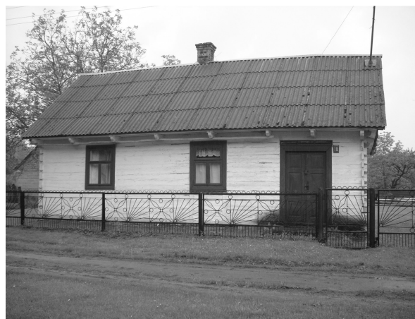
Fot. 2. Stare siedlisko w Ladeniskach służące jako „drugi dom”.

Photo 2. Old farm in Ladeniska, used as “second house”.