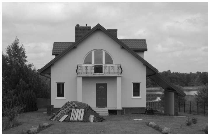
Fot. 3. Nowa zabudowa we wsi Siedliszczki.