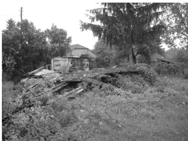
Fot. 1. Ladeniska – zdewastowane Gospodarstwo.

Podobne zjawisko zaobserwowano w Siedliszczkach - wieś powoli zatracą swój „swojski” charakter, pojawiają się domy weekendowe mieszkańców miast (m. in. z Warszawy i Chełma). Niejednokrotnie wymiana bądź modernizacja budynków następowała bez kontynuacji tradycyjnych form zabudowy regionalnej, przez co spowodowała dysharmonię w tradycyjnym wizerunku wsi (fot. 3).