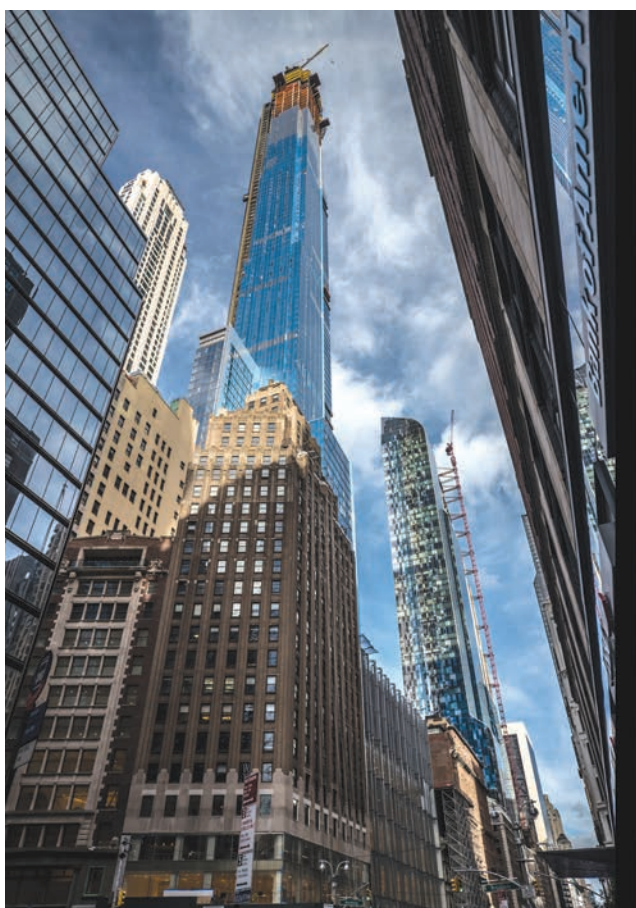
iii. 10, 11. Central Park Tower, design by Adrian Smith + Gordon Gill Architecture, 2021