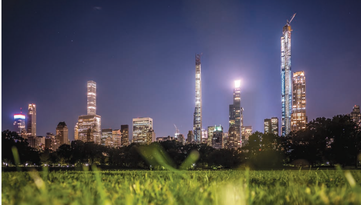
il. 1. Widok na południową krawędź Central Parku z powstającymi wieżami mieszkalnymi, fot. Mariusz Twardowski Ill. 1. View of the southern edge of Central Park and its newly-built residential towers, photo by Mariusz Twardowski

we – budynek Chryslera (1930), Empire State Building (1931) czy dawne World Trade Center (1973). Upadek Lehman Brothers w 2008, który zapoczątkował finansowy kryzys oraz ruch społeczny #occupywallstreet (red. Blumenkranz, Gessen, Greif i inni, 2012), okazują się jednak symbolicznym końcem tej epoki i początkiem nowej – postnowoczesnej, hybrydowej, w której miasto wymaga rozwiązań typu smart (Shah, Kothari, Doshi, 2019), a przestrzeń domowa i biurowa mieszają się, a sukces przestaje być mierzony godzinami spędzonymi przy korporacyjnym biurku.