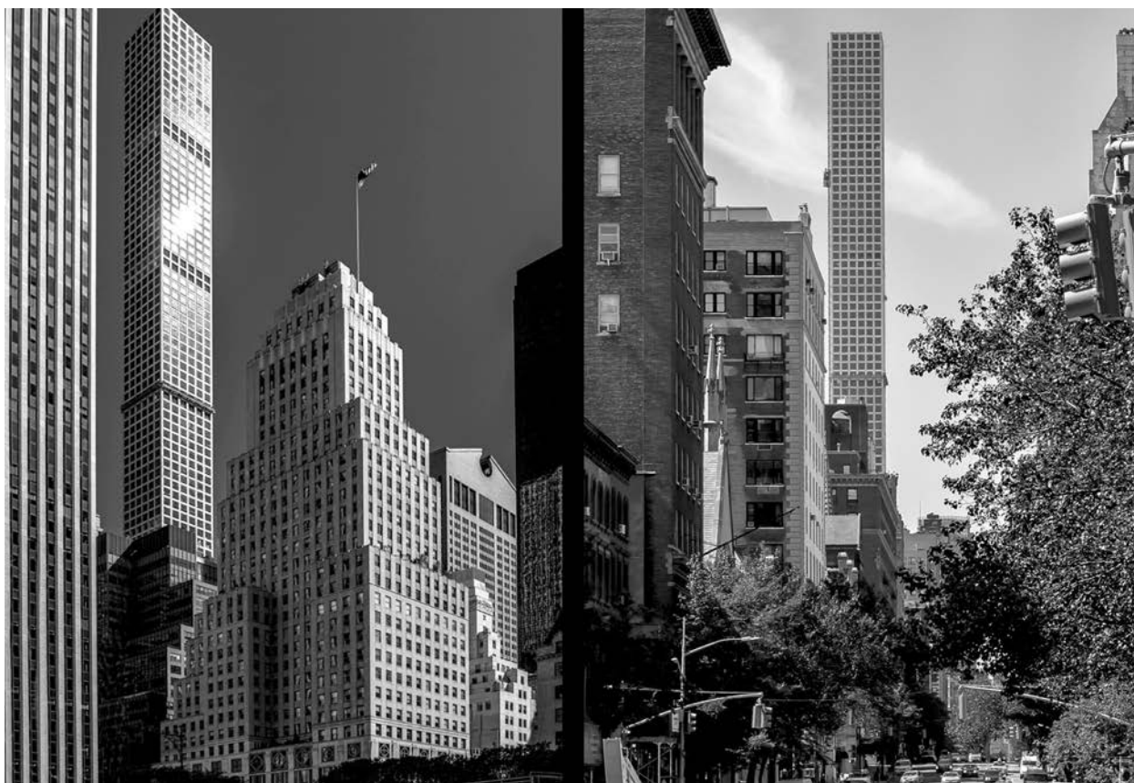
il. 4, 5. 432 Park Avenue, proj. Rafael Viñoly, 2015 r. ill. 4, 5. 432 Park Avenue, design by Rafael Viñoly, 2015

Completed in 2015 and designed by Rafael Viñoly's design firm (Uruguay), it clearly stands out and towers above the remainder of Midtown's development and the nearby trees of Central Park. Four hundred and twenty-five metres. This is how tall Viñoly's building