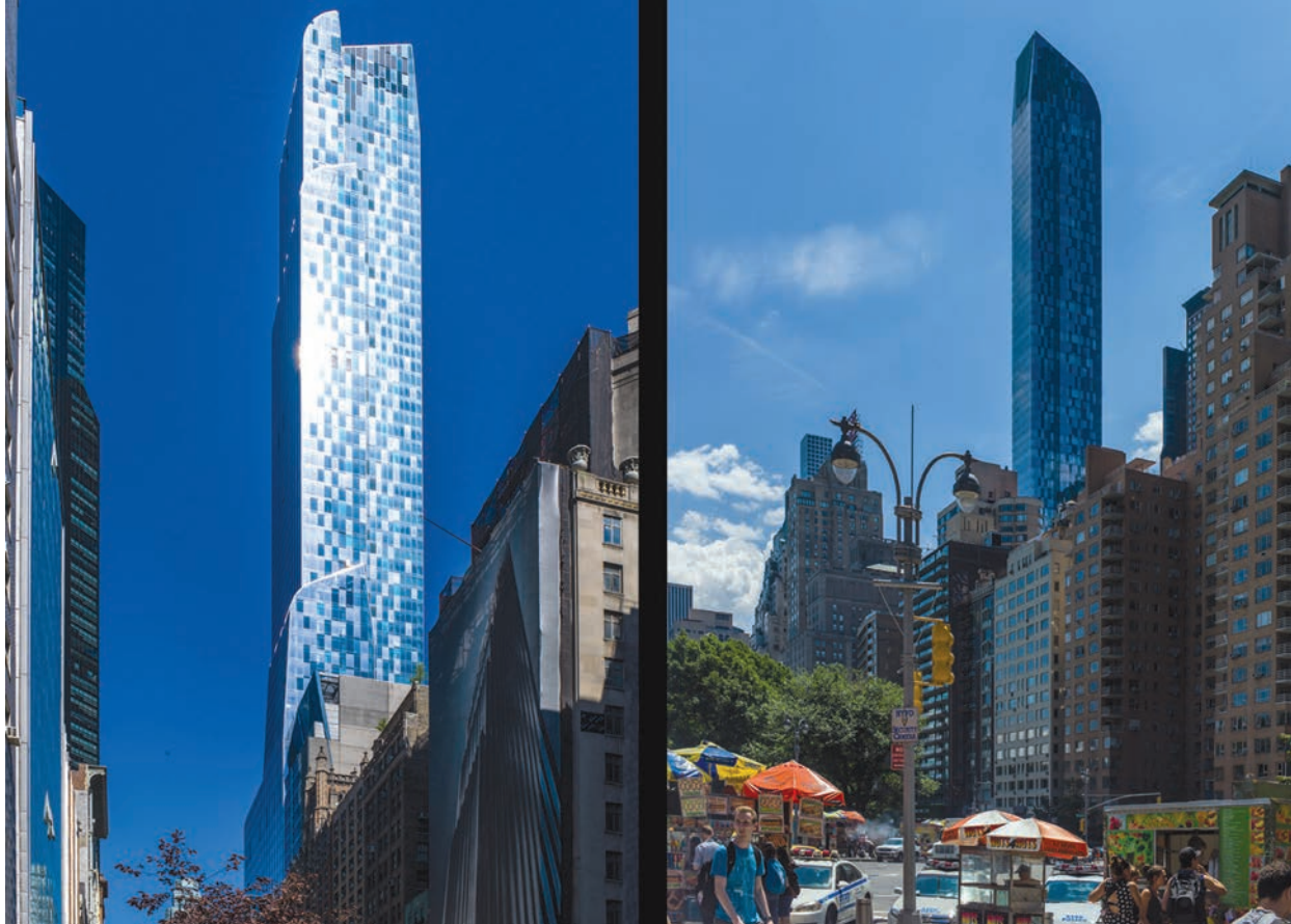
il. 2, 3. One 57, proj. Christian de Portzamparc, 2014 r. ill. 2, 3. One 57, design by Christian de Portzamparc, 2014

i Hudson, a także granice Central Parku. Jak opisał swój projekt sam autor: „(to) unosząca się ku chmurom artystyczna rzeźba, elegancka, paskowana ściana osłonowa wydaje się płynąć w kierunku ziemi jak kaskadowy wodospad”. Budynek jest jedną z pierwszych wież mieszkalnych, która wizualnie sprawia wrażenie, że przekracza proporcje szerokości rzutu do wysokości 1:12. Ta „magiczna” liczba od lat stanowiła wyzwanie dla konstruktorów. Pierwszą z budowli, w których się udało ją przekroczyć był One Marison Park (proj. Cetra Ruddy, 2010). W tym przypadku jednak proporcje te przekroczyła górna część budowli, w niższej części pojawia się zjawisko „kaskadowego wodospadu” – bliżej gruntu budynek rozszerza się, stwarzając wrażenie przysadzistej i wtapiającej się w otoczenie konstrukcji.