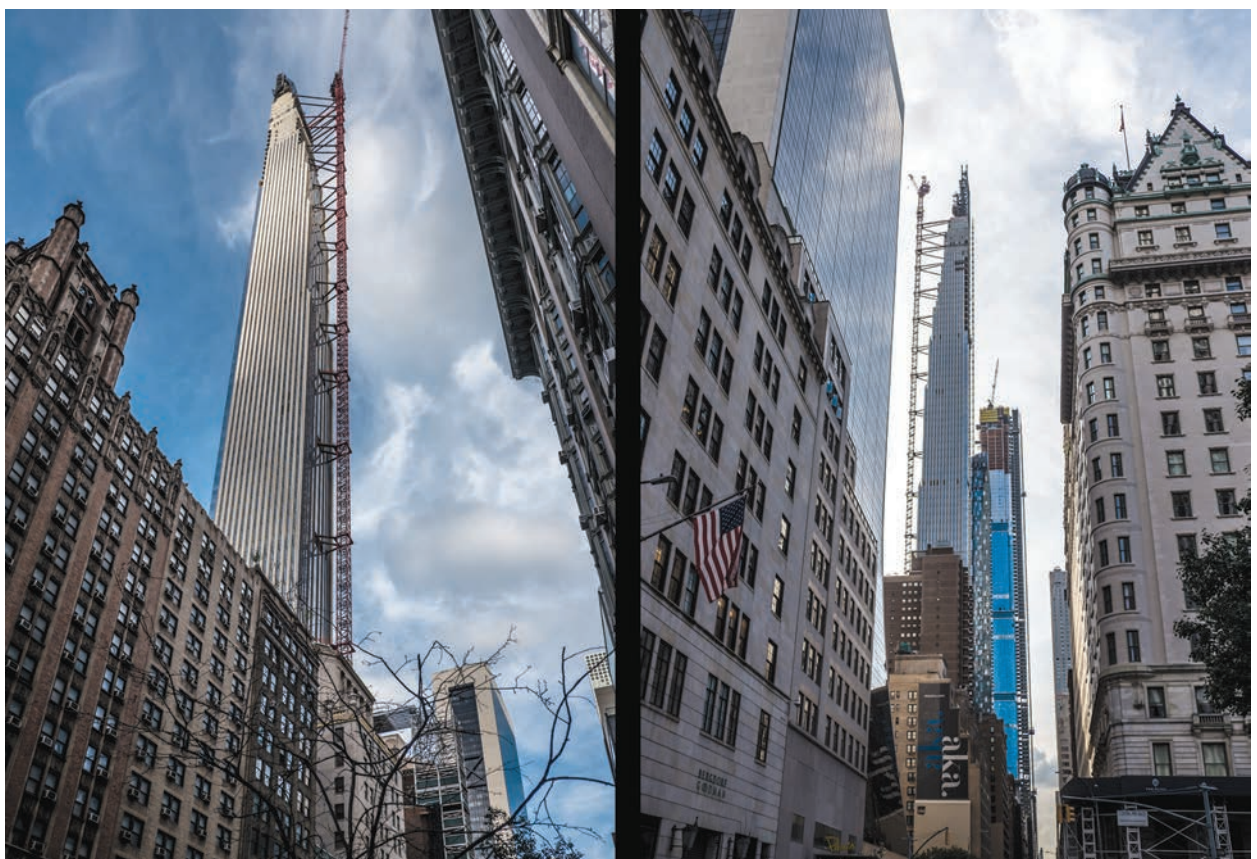
ill. 6, 7. 111 West 57th Street (Steinway Tower), design by SHoP Architects, 2021