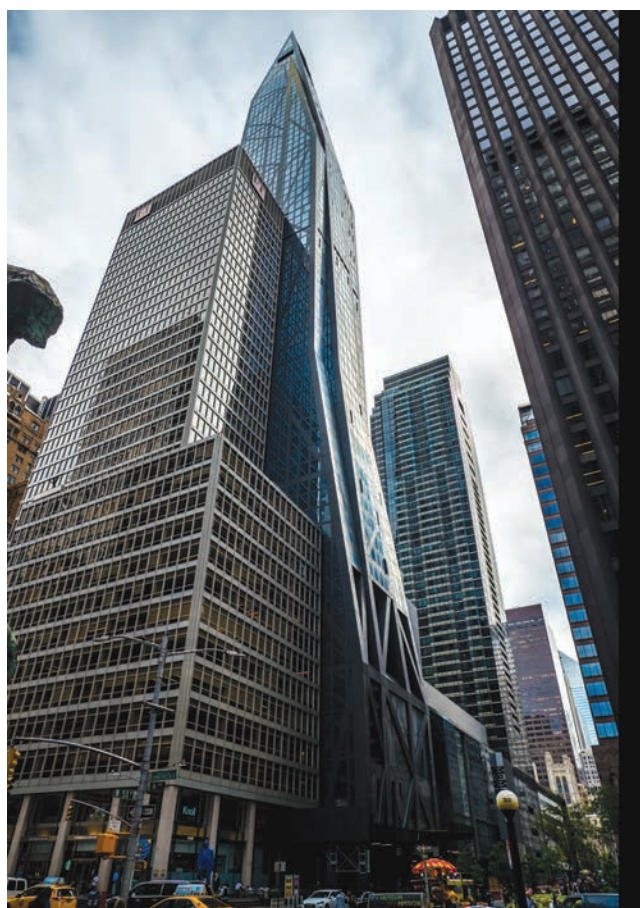
il. 8, 9. 53W53, proj. Jean Nouvel, 2019 r. / 53W53, design by Jean Nouvel, 2019

The building has a distinctive structural system. The foundations have been affixed by 200 anchors to bedrock at a depth of 30 m. This solution allows the slender building to remain vertical. Two external, massive walls, with a width of 91 cm, maintain the static system, with additional beams placed at three-storey intervals and four outrigger walls on mechanical levels (Marcus, 2015). Three