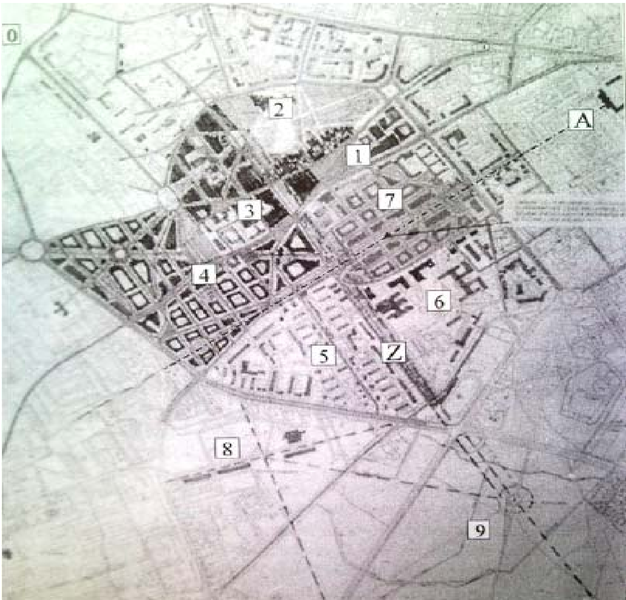
racja 4. Koncepcja adaptacji osiemnastowiecznego założenia ogrodowo-urbanicznego do projektowanego Centrum.

„Of Branickich”, Z – „Zielona Oś”, 1 – Rynek Sienny, 2 – Park Centralny i Kaplica Magdaleny, 3 – kwartał obiektów usługowych, 4 – osiedle Kopernika, 5 – osiedle Tyecia, 6 – kompleks szpitalny, 7 – osiedle Piaski, 8 – Politechnika Białostocka, Zwierzyniec, 10 – tereny dworców PKP i PKS (przej. A. Turecki 1995).