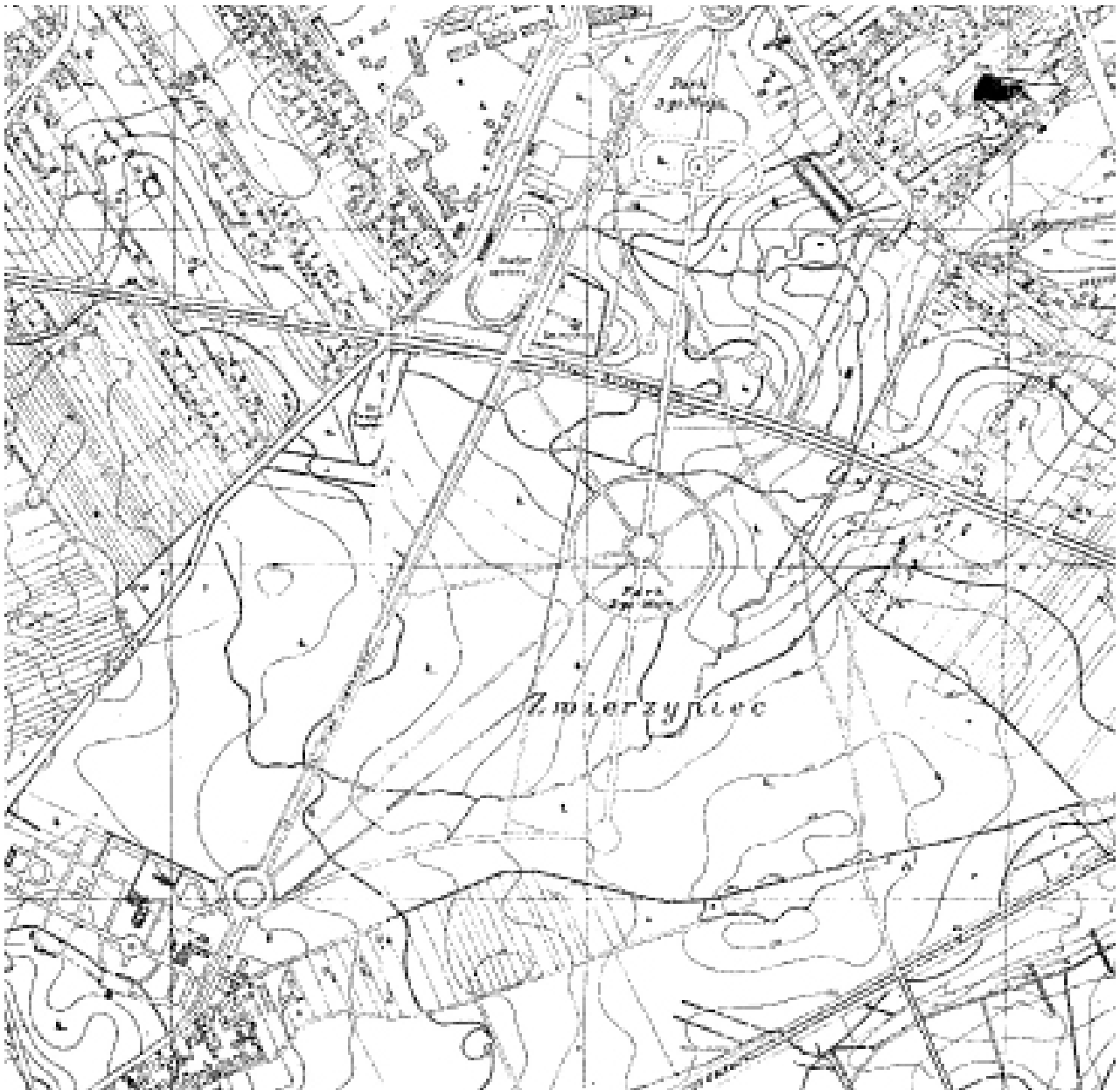
II. 2. Plan Parku 3-go Maja – (Zwierzynica) z 1937 r.