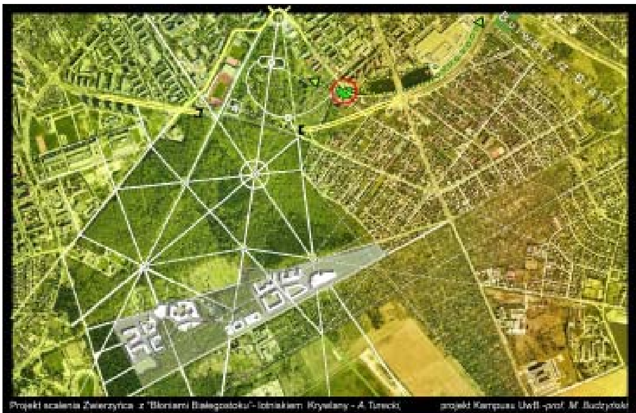
Il. 4. Projekt scalenia Parku Konstytucji 3 Maja z Błoniemi Białegostoku- lotniskiem na Krywlanach. autor. A. Turecki (W południowej części projektu kampusu Uniwersytetu w Białymstoku, projekt: prof. M. Budzyński, Z.Badowski z zespołem), aut. A. Turecki, 2009