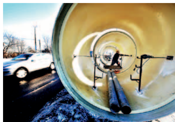
Ryc. 9. Rura przeciskowa OD 3000 mm wbudowana w ramach projektu „Czajka” [3]

końcowych i technologicznych. Jako podstawowe rozwiązanie w zakresie ochrony przed napływem wód gruntowych przyjęto ściany szczelne Larsena, które zagłębiano w warstwy gruntu otaczające wykop na głębokość gwarantującą stateczność dna. Należy jednak podkreślić, że przyjęcie tylko takiego rozwiązania było możliwe jedynie wtedy, gdy w bezpośrednim sąsiedztwie wierceń występowały wyłącznie grunty spoiste, nieprzepuszczalne. W przypadku występowania gruntów piaszczystych, wodonośnych, konieczne było zastosowanie dodatkowego uszczelnienia ścian pionowych i dna wykopu w postaci przesłon wykonywanych metodą iniekcji strumieniowej [2, 4, 7].