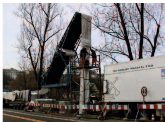
Ryc. 3. Specjalny przenośnik taśmowy wraz z wieżą inwersyjną [5]

nieprzerwaną pracę pompowni Powiśle w trakcie prowadzonych prac oraz wykonać próby ciśnieniowe odnowionych kanałów (0,4 MPa) [5].