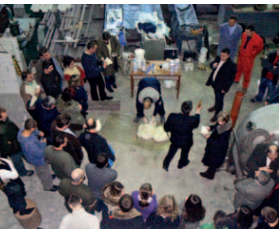
Ryc. 7. Uczestnicy studium podyplomowego Technologie Bezwykopowe w Inżynierii Środowiska w czasie pokazu technologii utwardzanych in situ powłok żywicznych