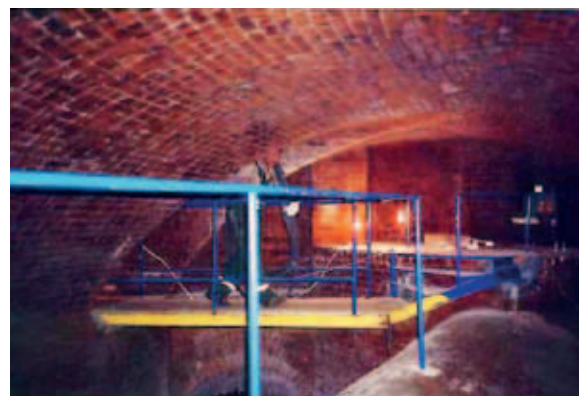
Ryc. 2. Komora zbiorcza w ul. Karowej [1]

Podsumowując, nagrodzony projekt obejmował rehabilitację ok. 5 km kanałów tłocznych i ok. 1 km kanałów grawitacyjnych, usytuowanych w 80% w pasach drogowych. Wykonawca musiał uwzględnić zmienną geometrię przewodów zarówno w zakresie kierunków przebiegu (np. obejścia przejść podziemnych, mostu Śląsko-Dąbrowskiego, pionowego przekroczenia kolektorów przełazowych), jak i zmienność średnic np. z \varnothing 1200 do \varnothing 1000 poza studniami czy komorami. Wszelkie prace rehabilitacyjne należało wykonać bez utrudnień dla ruchu kołowego, szczególnie w ciągu Wisłostrady. Wykonawca musiał również zapewnić