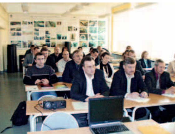
Ryc. 6. Uczestnicy studium podyplomowego Technologie Bezwykopowe w Inżynierii Środowiska