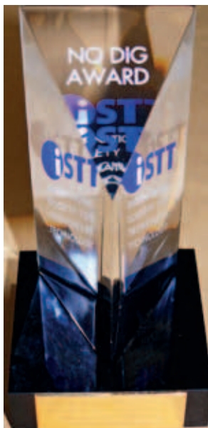
Ryc. 4. Statuetka No-Dig Award za zorganizowanie w Polsce pierwszego na świecie studium podyplomowego Technologie Bezwykopowe w Inżynierii Środowiska