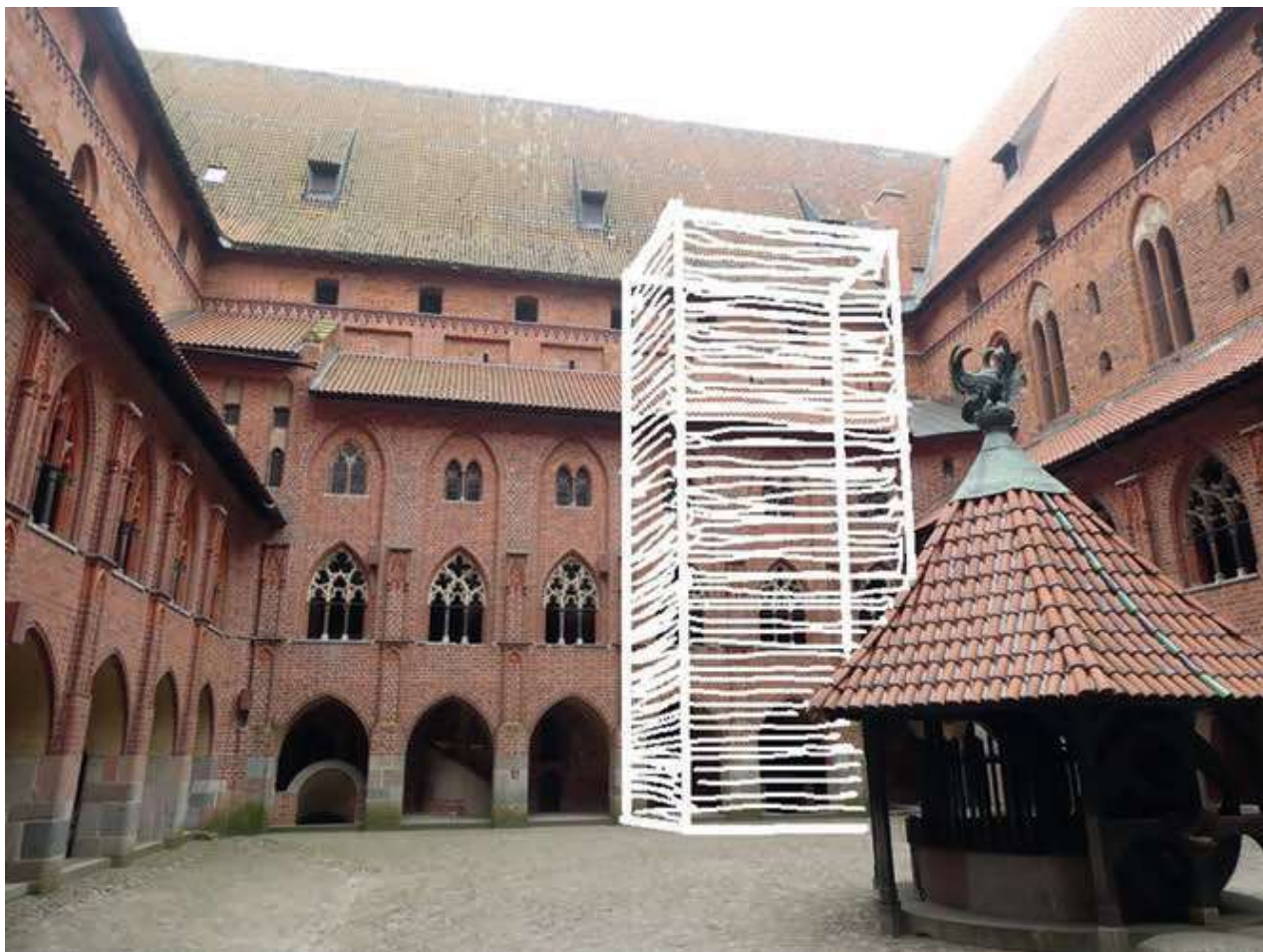
Ryc. 4 Zamek Wysoki w Malborku, dziedziniec. Szkicowa wizualizacja kubatury szybu mieszczącego dźwig i klatkę schodową; możliwa do zaakceptowania, oprac. G. Bukal.

Sytuowanie natomiast szypów dobudowanych do ścian zewnętrznych (elewacji) nie powinno być brane pod uwagę z uwagi na ekspozycję każdej z nich od strony miasta oraz w panoramie zamku od strony Nogatu. Prawdopodobnie zresztą jeden taki pion komunikacyjny nie poprawiłby sytuacji całego obiektu.