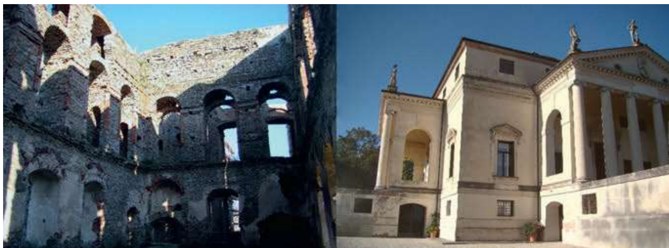
Ryc. 1 Obiekt o strukturze otwartej (Krzyżtopór) oraz obiekt o strukturze zamkniętej (Villa Rotonda, Vicenza)

Zabytki architektury można ogólnie podzielić na dwa typy pod względem struktury architektonicznej. Stronę funkcjonalną można uznać tu za drugorzędną, albowiem często zmieniała się ona w czasie długiego życia obiektu.