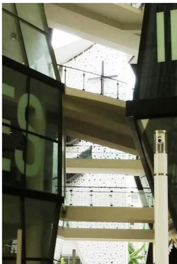
III. 5. Singapore Life Church, design by LAUD Architects. Views of the church from the site of the LaSalle College of the Arts