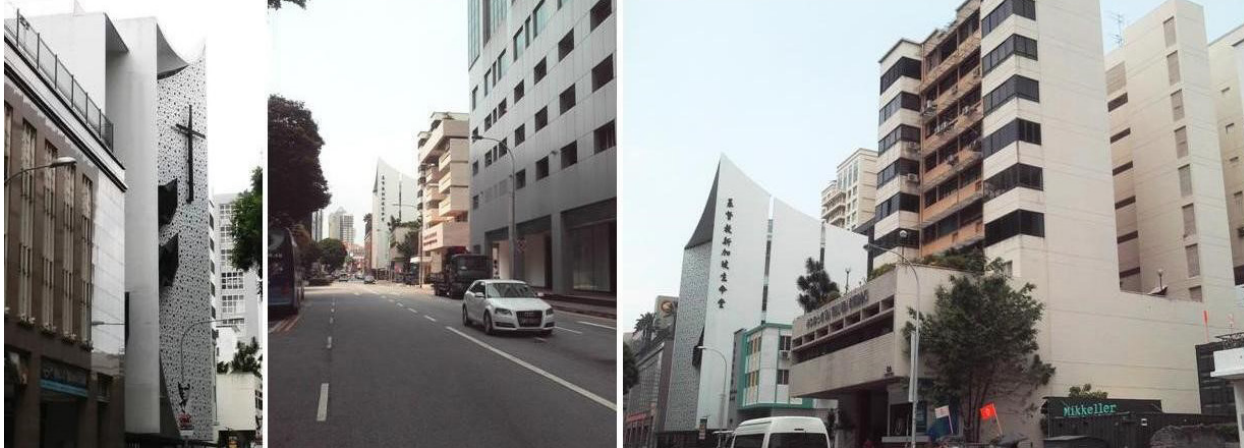
II. 4. Kościół Życia Chrześcijańskiego w Singapurze, projekt LAUD Architects. Widok bryły kościoła w krajobrazie ulicznym oraz na tle zabudowy mieszkaniowej, 2016