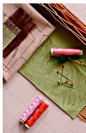
Rys. 7. Zadanie Manipulacje tekstylne – Smocking zrealizowany w pracowni Technicznych Aspektów Modelowania, praca studentka, autor: Eliza Sikora Fig. 7. The manipulation of the textile – Smocking, student work, author: Eliza Sikora

W takiej formie kształcenia istotna jest nauka projektowania wzorów stanowiąca bazę projektowania tkanin, gdzie na podstawie multiplikacji studenci równolegle poznają zasady druku na różnych materiałach i jego rodzaje, a także zagadnienia formalne dotyczące operowania skalą, rytmem i iluzją przestrzeni. Następnym ważnym zagadnieniem okazują się być manipulacje tekstylne i wykorzystanie całego potencjału tkwiącego w formowaniu materiału m.in. poprzez składanie, warstwowanie, plisowanie, pikowanie i inne, często eksperymentalne metody. W ramach Technicznych Aspektów Modelowania Tkaniny powstają też tekstylne obiekty. Miękka materia bardzo często stanowi konstrukcję, jak i zewnętrzne poszycie, gdzie eksponowane są estetyczne i funkcjonalne jej walory. Dzięki praktycznej metodzie pracy, gdzie student od projektowania wzoru przechodzi do próbek materiałowych i dalej realizacji pełnowymiarowe-