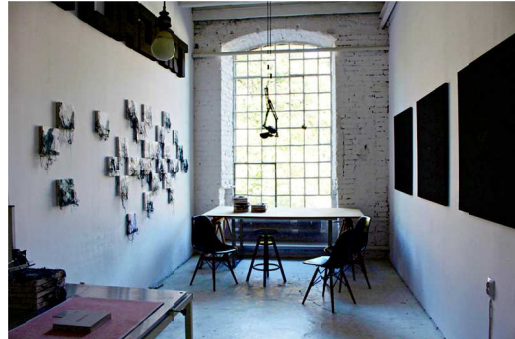
Rys. 5. Wystawa indywidualna Rysunek szyty i haft, Shlagart Off Piotrkowska, Łódź design Festival 2015 Fig. 5. Individual exhibition Sewing draw and embroidery, Shlagart Off Piotrkowska, Łódź design Festival 2015

W ten oto sposób tkanina stała się dla mnie medium, którym posługuję się na gruncie rysunku, mogąc się w ten sposób wypowiadać się na wiele sposobów, nieustannie odkrywając nowe jej obszary i przestrzenie do artystycznej penetracji, łącząc artystyczną kreację z elementami wiedzy z zakresu projektowania tkaniny.