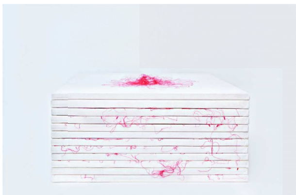
Rys. 3. Plantacja, rysunek szyty, haft, tkanina bawełniana Fig. 3. Plantation, sewn drawing, embroidery, fabric

Na innej zasadzie działam w cyklu Plantacja , gdzie czerwoną nicią „wrysowuję” jednocześnie analizując kształty płatków róż różnego gatunku, a następnie ręcznie wyhaftowuję wybrane zarysy. Jest to swoiste rosarium zapisane na kilkunastu białych, tkaninowych tablicach, gdzie poza kwadratowe płaszczyzny wyłaniają się intensywnego koloru nici sugerujące, że poza obrazem jest coś więcej (rys. 3).