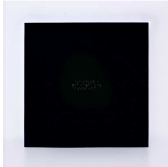
Rys. 4. Dziewczynki nie bawią się pistoletami, haft, tkanina bawełniana Fig. 4. The girls don't play with the guns, embroidery, fabric