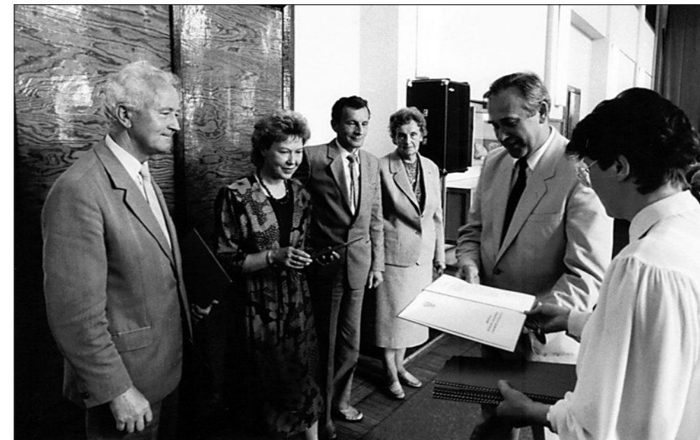
Fot. 3. Przyznanie dyplomów i nagrody zespołowej w roku 1989 za publikowanie monografii pt. „Ekologiczne skutki uprzemysłowienia Puław”

Profesor Jan Siuta w roku 2000 powołał nowy periodyk pt. „Inżynieria Ekologiczna” ukazujący się początkowo jako cykl monografii książkowych, a następnie jako czasopismo naukowe. Czasopismo ukazywało się drukiem do końca