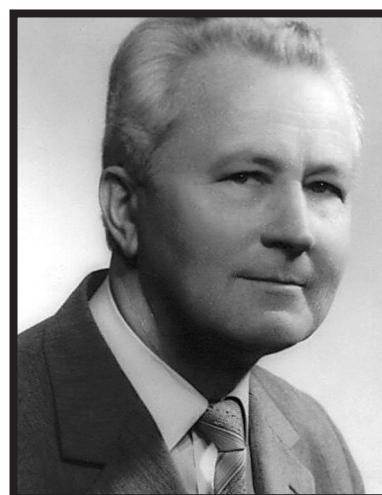
Fot. 1. Profesor Jan Siuta (1928–2020)

Studia wyższe rozpoczął na Wydziale Rolniczym Wyższej Szkoły Gospodarstwa Wiejskie-