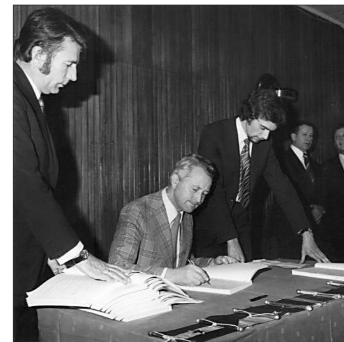
Fot. 4. Uroczyste podpisanie protokołu z dorocznych obrad Rady Pełnomocników RWPG (1985)