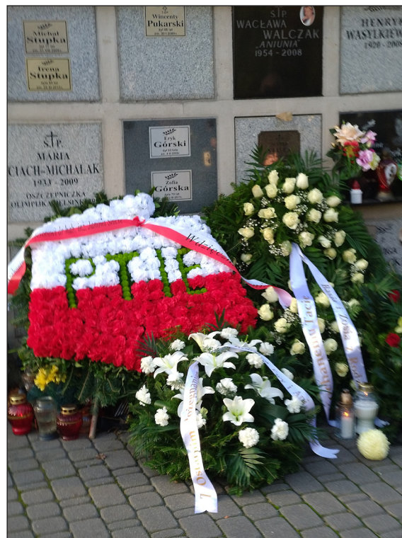
Fot. 12. Złożony wieniec przed kolumbarium z białych i czerwonych goździków ułożonych w logo PTIE

i przemysłowych na cele rolnicze. Monografia ukazała się nakładem Wydawnictwa Politechniki Lubelskiej w końcu 2019 r. W roku 2020 profesor Jan Siuta intensywnie promował i rozprowadzał egzemplarze autorskie wśród swoich znajomych i przyjaciół, praktycznie do końca swoich dni (Fot. 11 i 12).