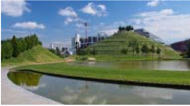
Il. 4. Widok na kopiec i skarpe Spirals of Time w Parku Vittoria.