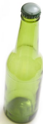
Rys. 2. Butelka szklana Fig. 2. Glass bottle

Projekt ustawy zakłada, że przedsiębiorcy, którzy wprowadzają napoje w opakowaniach objętych systemem będą mieli obowiązek uzyskania określonego poziomu zbierania. Będzie jednak