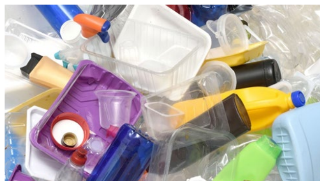
Rys. 1. Opakowania i odpady opakowaniowe Fig. 1. Packaging and packaging waste

1. Rezygnację z definicji „napoju” i wprowadzeniu definicji „opakowania na napoje”, co wynikało z uzgodnień z Rządowym Centrum Legislacji.