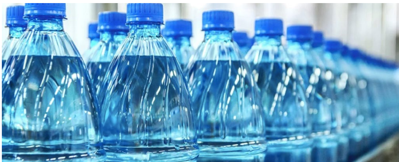
Rys. 3. Butelki tworzywowe Fig. 3. Plastic bottles