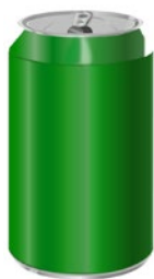
Rys. 4. Puszka aluminiowa Fig. 4. Aluminum can