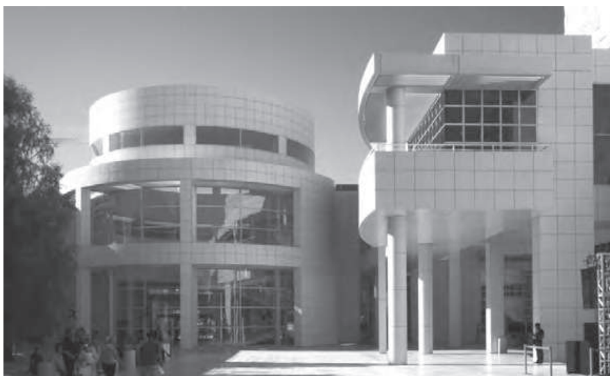
Рис. 9. Гетти-центр в Лос-Анжелесе, США. Арх. Р. Мейер, 1984-1997

Сформировавшийся во второй половине 1980-х годов деконструктивизм (Д. Либерскинд, П. Эйзенман, Ф. Гери, З. Хадид и др.) сегодня развивается в русле неомодернистских тенденций. Проектируемые формы отличаются геометризмом и динамикой (рис. 10). Используя подчеркнутую контрастность форм и материалов представители направления черпают идеи из супрематизма 1920-х годов. Теоретическим обоснованием деконструктивизма является концепция Ж. Деррида.