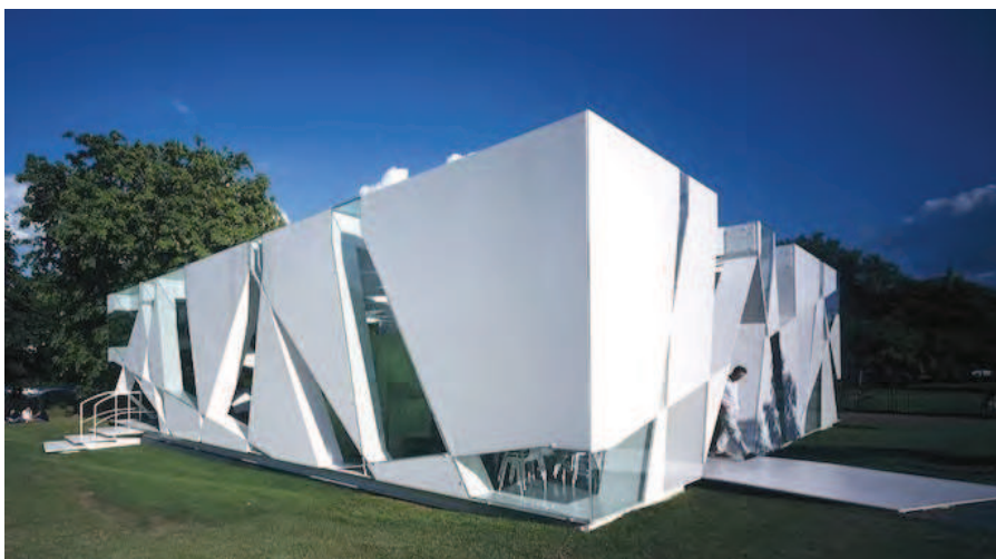
Рис. 11. Павильон для галереи Серпентин. Лондон. Арх. Тойо Ито, 2002

Минимализм 1990-2000 гг. (Д. Джадд, М. Судзуки, Т. Ито), провозглашающий возврат к «простоте форм», основан на «авангардном аскетизме» А. Лооса. В то же время представители минимализма стремятся с помощью простых форм и деталей достигнуть равновесия между архитектурой и природой (рис. 11). Данная задача становится одной из важнейших для новейшей архитектуры.