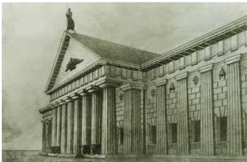
Рис. 1. И.А. Фомин. Проект музея в Москве, 1910 [2]

Но и его первые теоретические обоснования были во многом связаны с традицией. В 1902 г. Ж. Годэ издал книгу «Элементы и теория архитектуры». Опираясь на концепции Ж.Н.Л. Дюрана, Годэ разрабатывал методы «рациональной комбинации типовых архитектурных форм», положив начало функциональному методу «современной архитектуры» [3, с. 93]. Возникшая в 1910-1920-е гг. «первая волна» модернизма породила интерес к абсолютному новаторству, техницизму, утопической устремленности в будущее и отрицанию исторического наследия.