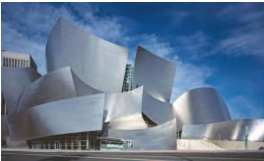
Рис. 10. Концертный зал У. Диснея. Лос-Анджелес. Арх. Ф. Гери, 1999-2003