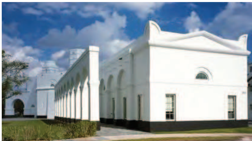
Рис. 6. Архитектурный центр Хорхе М. Переса. Арх. Л. Крие, 2005 [2]

архитектурного ордера. Представители направления используют достаточно точные цитаты и мотивы исторической архитектуры, а теоретики (в первую очередь братья Крие) пропагандируют прямое и непосредственное продолжение классицистической традиции как противостояние дисгармонии современной жилой среды (рис. 6, 7).