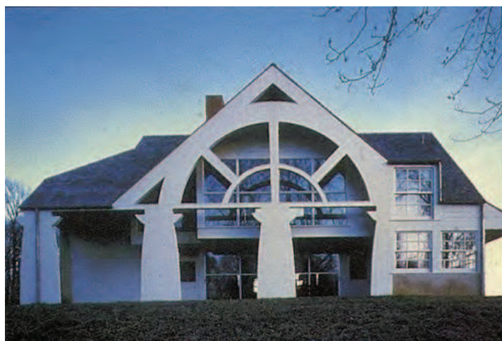
Рис. 5. Особняк в Делавере. Нью - Касл. Арх. Р. Вентури и др., 1978-1983 [2]

Исследование архитектурной теории и практики 1970-1990-х годов раскрывает многообразие подходов к вопросу интерпретации классической традиции. Общая тенденция, связанная с ее реализацией в архитектуре, отражает стремление к поиску новых методов образно-символической выразительности и гуманизации предметно-пространственной среды.