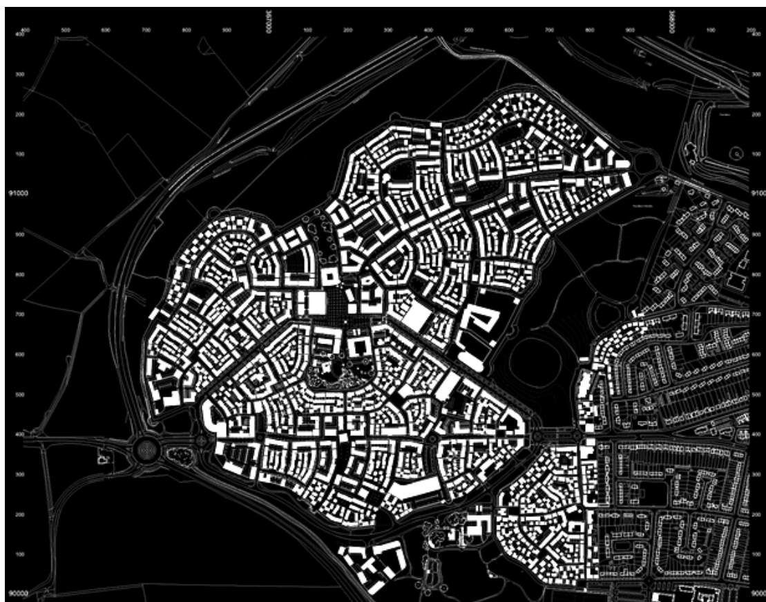
Рис. 7. Мастер-план Паундбери - пример неоурбанизма. Арх. Л. Крие, 1993 [2]