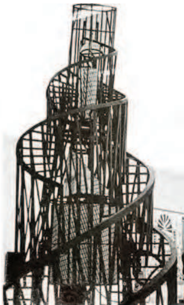
Рис. 2. Проект памятника III Коммунистического Интернационала. Арх. В. Татлин, 1919-1920 [2]

К началу 1930-х гг. годов вновь встал вопрос о художественных средствах архитектуры и возник новый виток обращения к классической традиции. Именно она позволяла придать художественную выразительность утилитарной форме традиционными и всем понятными средствами. При этом классическая традиция проявлялась не в воспроизведении конкретно-исторических форм, а в использовании общих эстетических принципов. Для теоретического обоснования данной тенденции во многих европейских странах (но особенно в СССР) проводились фундаментальные исследования в области истории архитектуры. Печатались многочисленные руководства по созданию градостроительных ансамблей, анализу классической композиции, правилам построения начертания ордеров, и др. В предвоенный период во многих европейских странах наблюдалась тенденция использовать принципы классицистического формообразования для выражения общественных, социальных и политических задач. Наряду с прямыми «цитатами» памятников ордерной архитектуры (рис. 3) применялись упрощенные геометризованные формы (рис. 4). Такие упрощенные формы позволяли «примирить» классицизирующую архитектуру с рационалистическими формами архитектуры «нового движения».