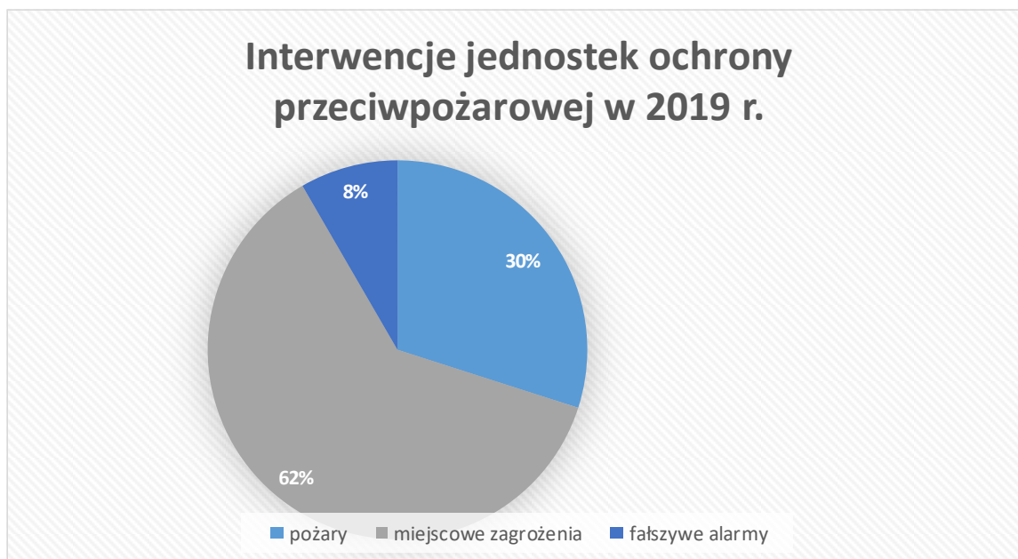
Rysunek 1. Interwencje jednostek ochrony przeciwpożarowej w 2019 r.