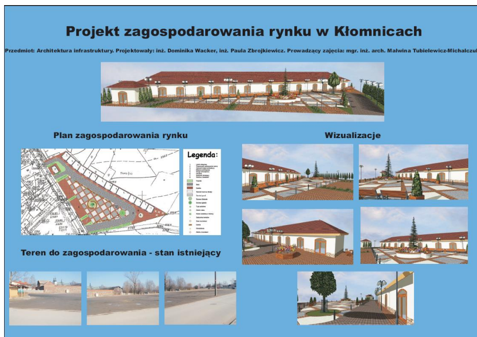
Rys. 3. Projekt zagospodarowania rynku w Kłomnicach