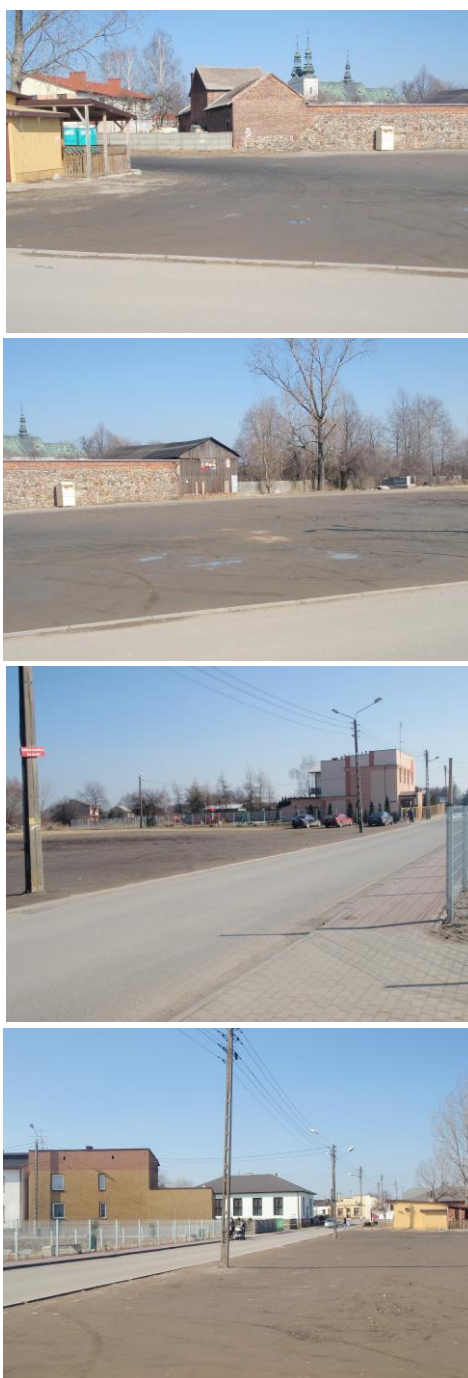
Rys. 2. Dokumentacja fotograficzna stanu istniejącego rynku w Kłomnicach. Opracowanie własne: dr inż. arch. Nina Sołkiewicz-Kos, mgr inż. arch. Malwina Tubielewicz-Michalczuk