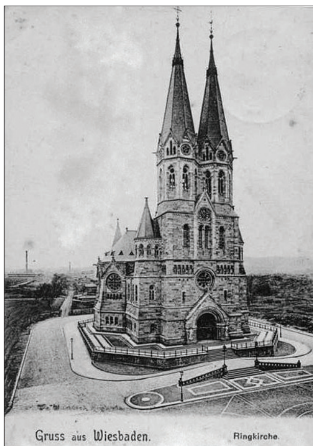
1. Kaiser-Wilhelm-Gedächtniskirche w Berlinie, Votivkirche w Wiedniu, Ringkirche w Wiesbaden. 1. The Kaiser-Wilhelm-Memorial Church in Berlin, the Votive Church in Vienna, the Ring Church in Wiesbaden.