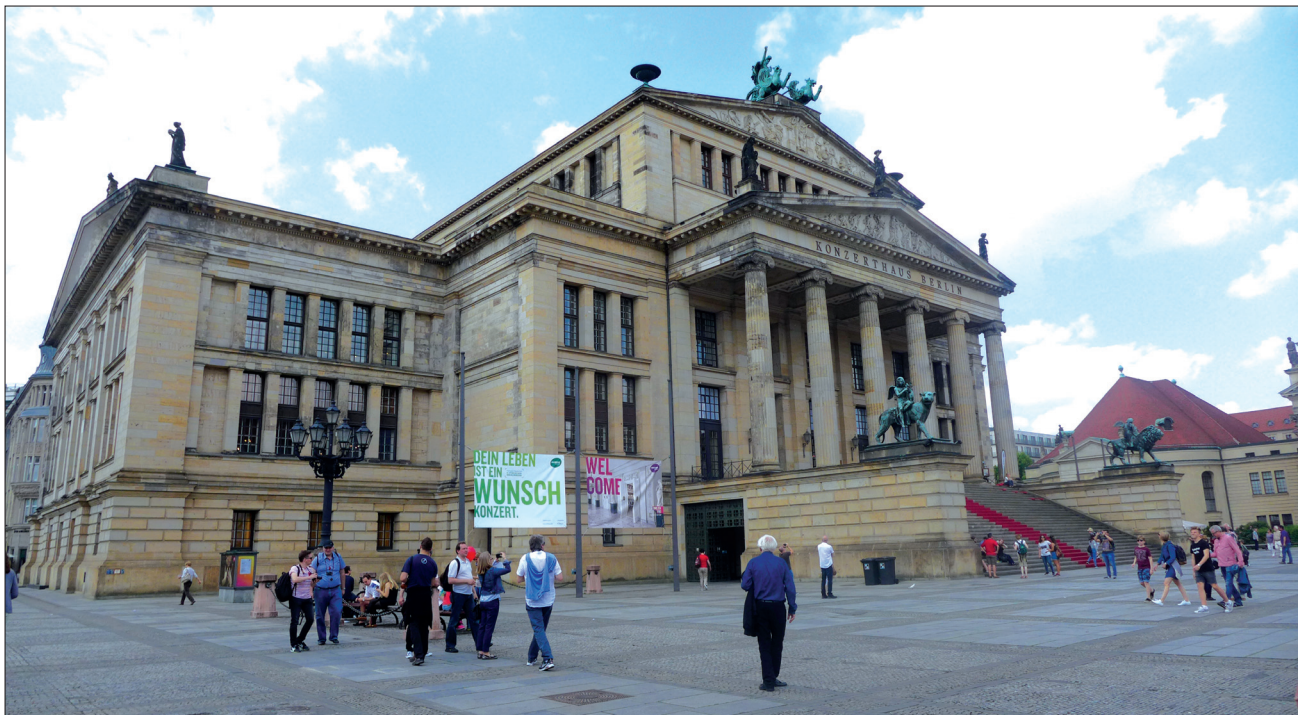
5. Schauspielhaus w Berlinie. Fot. autor, 2016 r. 5. The Konzerthaus in Berlin. Photo by the author, 2016

tektoniczny znak upamiętniający niemieckich bohaterów. Budowla niczym grecka świątynia góruje nad Dunajem, a wrażenie monumentalności potęguje stopniowany postument. „ Monument reprezentował pragnienie powrotu do pierwotnych form, archetypowych form i konkretyzował przede wszystkim doświadczenie wieczności. ” 31 Symbolika budowli monumentalnych tworzona była poprzez porządek dorycki i kompozycję nawiązującą do starożytnych świątyń greckich, dopełnioną przez podteksty literackie i znaczeniowe. Elegancja, ponadczasowość i harmonia architektury klasycystycznej rozstrzygała o charakterze wielu ówczesnych rezydencji szlacheckich, wznoszonych w przestrzeni natury. „ Specyficzną polską symbolikę reprezentowała architektura polskiego dworu ” – podkreśla Dariusz Kozłowski. „ Przez długie lata klasycystyczna potem eklektyczna zachowała lokalne wartości znaczeniowe jako symbol trwania i patriotyzmu. ” 32