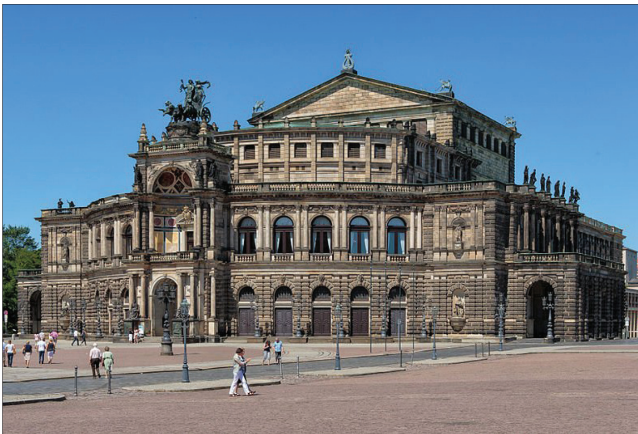
8. Opera Paryska, Opera Drezdeńska. 8. The Palais Garnier, the Dresden Opera.