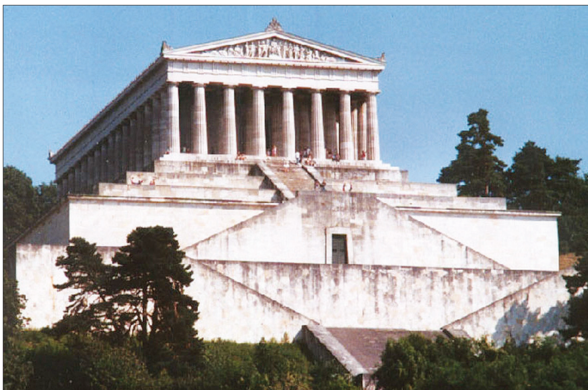
6. British Museum w Londynie, Walhala koło Ratzbony. 6. British Museum in London, the Walhalla near Regensburg.