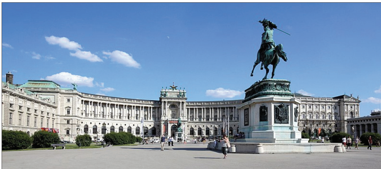
4. Michaelertrakt i Neue Burg w Wiedniu. 4. The Michaelertrakt and the Neue Burg in Vienna.

wzbudzała nastroje o charakterze politycznym 29 . Wzorowanie się na architekturze antycznej miało na celu podkreślenie rangi związanej z funkcją muzeum, ratusza czy architektonicznego pomnika. Budowę British Museum w Londynie projektu Roberta Smirke'a rozpoczęto w roku 1823. Główną fasadę utrzymano w wielkim jońskim porządku wzorując się na Erechtejonie w Atenach. Także Karl Friedrich von Schinkel czerpał inspirację z architektury starożytnej Grecji projektując Schauspielhaus (1818–1821) na placu Gendarmenmarkt czy Altes Museum (1823–1833) na Wyspie Muzeów w Berlinie (il. 5, 6). Natomiast ratusz w Birmingham,