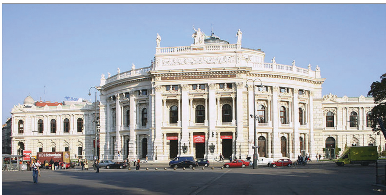
2. Kunsthistorisches Museum i Burgteater w Wiedniu. 2. The Kunsthistorisches Museum and the Burgteater in Vienna.