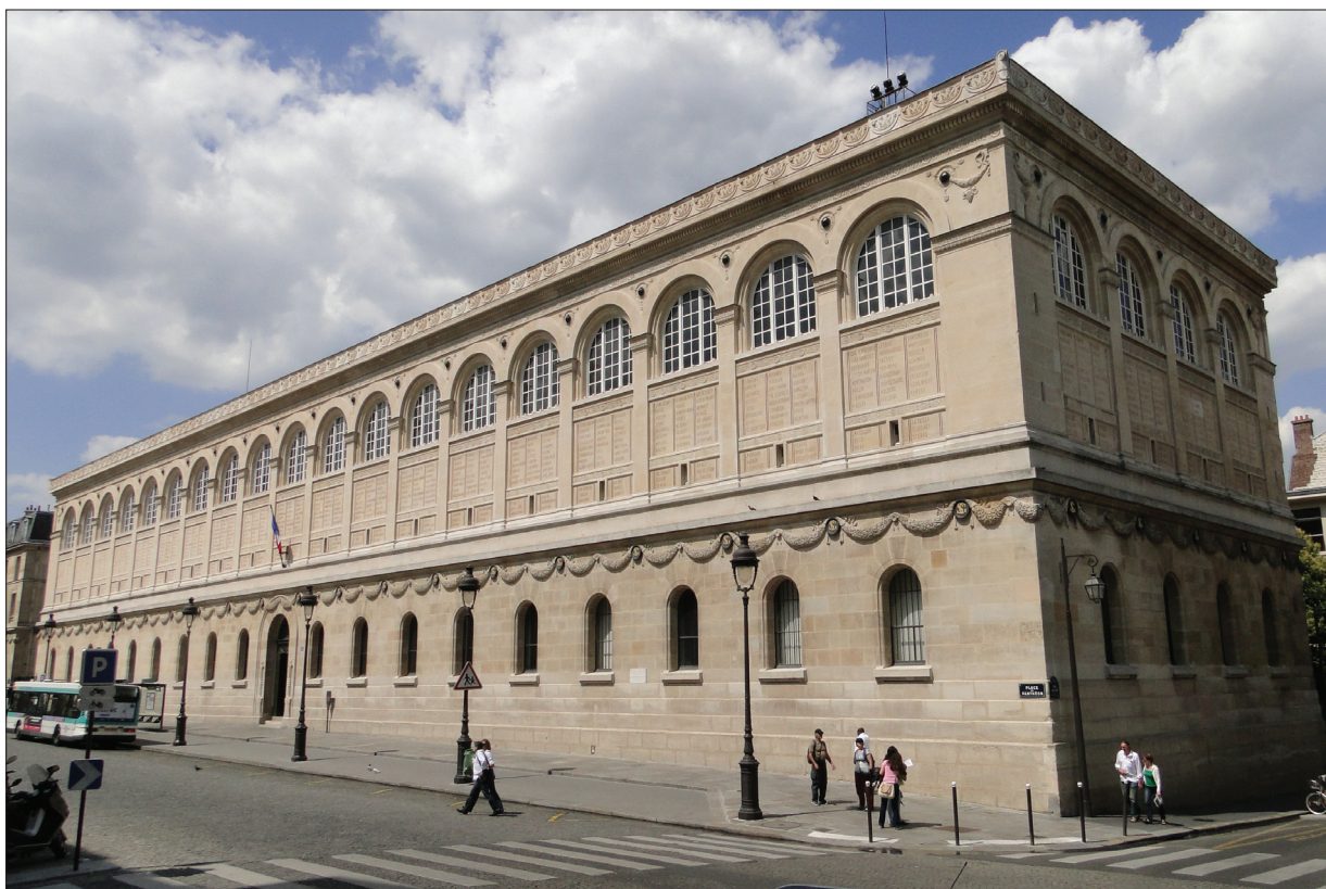
9. Biblioteka Sainte-Geneviève w Paryżu. 9. Sainte-Geneviève Library in Paris.

budowli. Dostrzegalny jest rozdział między strukturą a stylem i problem „fasadowości”. Architektów zajmowało głównie dekorowanie fasad i konstrukcji, w myśl twierdzenia Johna Ruskina, iż „ornament jest zasadniczą częścią architektury” 48 . Architekci dziewiętnastowieczni przenoszą na mieszczańskie domy oraz kamienice „ formy zapożyczone z gotyckich i renesansowych zamków, klasyczne frontony greckich i rzymskich świątyń czy fasady włoskich pałaców epoki Odrodzenia ” 49 . Świątynia i pałac zostają w XIX wieku zastąpione przez monument, muzeum, architekturę mieszkaniową, teatr, salę wystawową, fabrykę czy budynek biurowy. „ Każdy z tych obiektów, jak również chronologia ich powstawania wskazują na tworzenie się nowej formy życia, opartej na nowych znaczeniach egzystencjalnych. ” 50 César Daly wyróżnia trzy wielkie pomniki architektury dziewiętnastowiecznej: kościół, operę i dworzec kolejowy, których symbolikę utożsamiano z cnotami wyrzeczenia, subtelnej rozrywki i pracy 51 . Budowle te przywodzą na myśl: świątynia – mistycyzm i try-