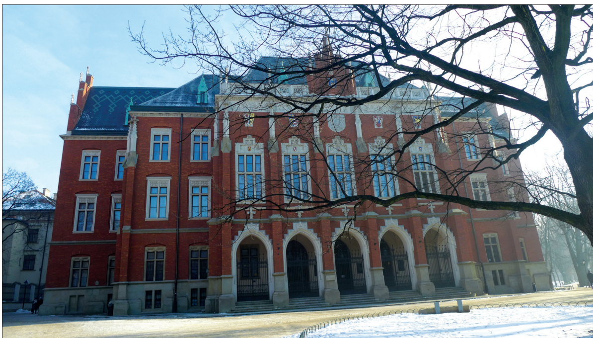
7. Collegium Novum Uniwersytetu Jagiellońskiego w Krakowie. Fot. autor, 2017 r. 7. Collegium Novum of the Jagiellonian University in Cracow. Photo by the author, 2017

publiczne charakteryzowała forma monumentalna, czytelna w przestrzeni miasta, dopełniona przez bogactwo i symbolikę detali. Kulminację tych dążeń można podziwiać w architekturze dziewiętnastowiecznych gmachów operowych. Architekturę opery miała cechować wystawność formy architektonicznej oraz detali jako odzwierciedlenie uczuć wzniesionych przez sztukę operową. Piotr Krakowski wskazuje na gmachy opery drezdeńskiej, wiedeńskiej i paryskiej jako najświetniejsze przykłady architektury XIX wieku w skali światowej (il. 8). „Opera, owo cudowne zestawienie, czy raczej koncentracja wszystkich sił sztuki, która jest najbardziej pełnym wizerunkiem owej drugiej dążności nowoczesnego społeczeństwa – pisze César Daly – opera jest ulubionym teatrem każdego, kto kocha piękno, przepych; jest to królestwo wyobraźni, widziane przez uroki sztuki.” 40 Wystawność architektury oper kreowana była przez piękno i harmonię stylu neorenesansowego lub wybujałość i przepych neobaroku, co miało symbolizować uczucia wyzwalone przez sztukę operową. Architektura podążała za muzyką, a muzyka czerpała moc z wzniesionej na jej cześć architektury. „Trzeba – pisał Charles Garnier – aby owa obfitość wrażeń tryskająca z lirycznego dramatu jeszcze została dopełniona wrażeniem obfitości, bijącej z architektury.” 41