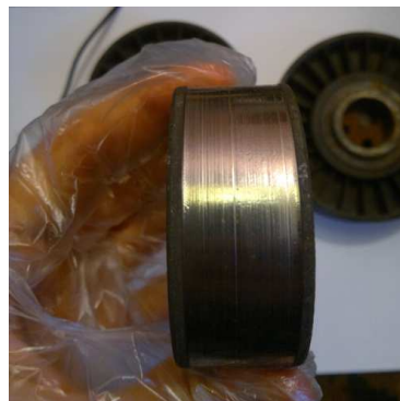
Rys. 1. Zużyte rolki wykorzystane do badań

skowa obiektywu F = 34,7 mm, przesłona f = 7,8 , czas otwarcia migawki 1/8 s.