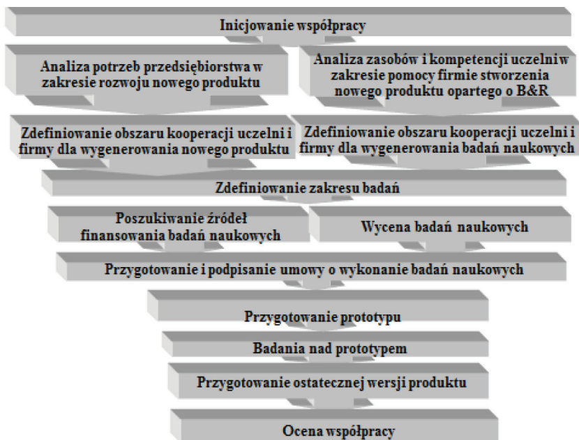
Rysunek 3. Etapy inicjowania współpracy pomiędzy uczelnią a przedsiębiorstwem dla strategii ciągnięcia technologii lub/i produktu.

Etapy inicjowania współpracy pomiędzy uczelnią a przedsiębiorstwem dla strategii ciągnięcia technologii lub/i produktu przedstawia rys. 3.