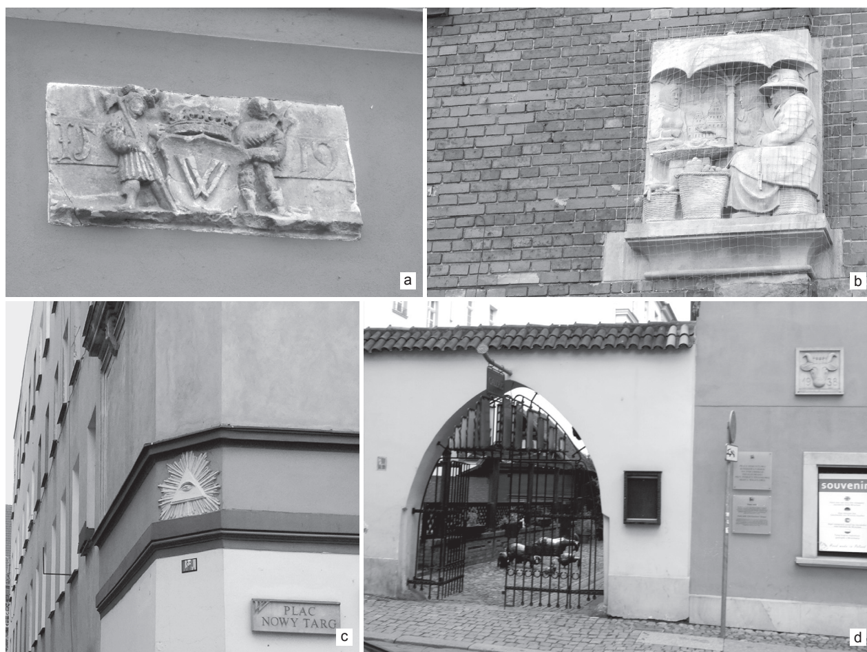
II. 1. Przykłady znaków w historycznej przestrzeni publicznej, odwołujących się do grup mieszkańców i do ich aktywności. Wrocław, ulice: a), b) Piaskowa, c) plac Nowy Targ, d) Odrzańska, wejście na ulicę Stare Jatki