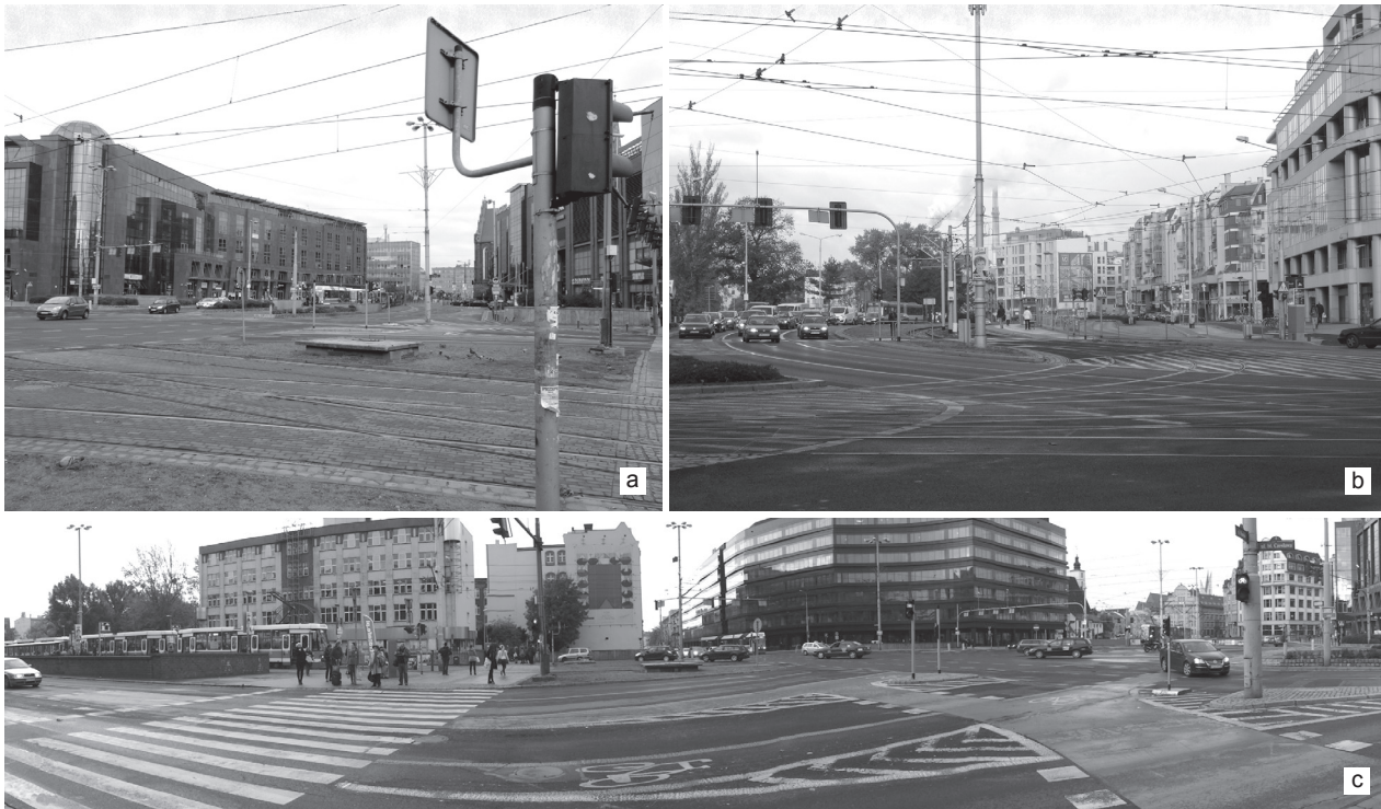
II. 4. Przykład przestrzeni publicznej wyznaczonej na węźle komunikacyjnym, która w całości zdominowana jest przez infrastrukturę drogową. Wrocław: a), c) plac Dominikański, b) plac Bema