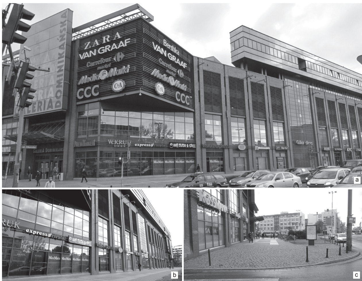
Il. 2. Przykłady najsilniejszych komunikatów we współczesnej przestrzeni publicznej. Wrocław, plac Dominikański: a) najbardziej eksponowany narożnik od strony placu, b) ściana wzdłuż ciągu pieszoego bez drzwi i okien, za to w całości zapełniona wielkopowierzchniowymi reklamami, c) strefa wejściowa bez jakiegokolwiek wyposażenia dla mieszkańców, natomiast oznakowana logotypami globalnych marek

Fig. 2. Examples of the most powerful messages in contemporary public space. Wrocław, Dominikański Square: a) the most exposed square corner, b) the wall with no doors or windows along a pedestrian lane, covered entirely by large ads, c) the entrance area with no facilities for residents, marked with logos of global brands