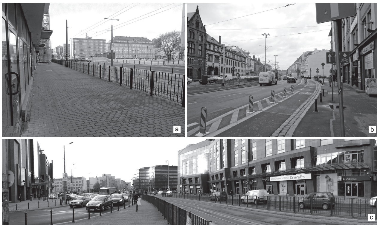
Il. 5. Różne sposoby użytkowania i inni zarządcy terenów wchodzących w zakres obszaru określonego w Studium jako przestrzeń publiczna [22]. Granice oddzielające odmienne przeznaczenia i funkcje są widoczne w formie barier, plotów i różnych materiałów nawierzchni. Wrocław: a) plac Nowy Targ, b) ul. Kazimierza Wielkiego, c) plac Dominikański