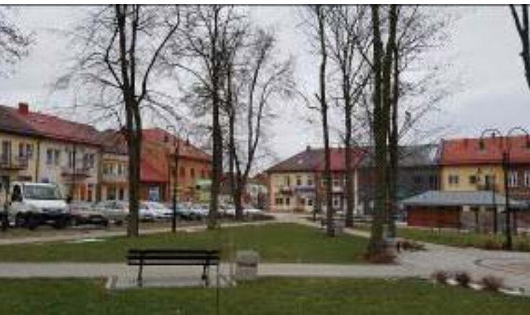
Il. 8. Widok na fragment rynku w Wiślicy – narożnik północno-zachodni.