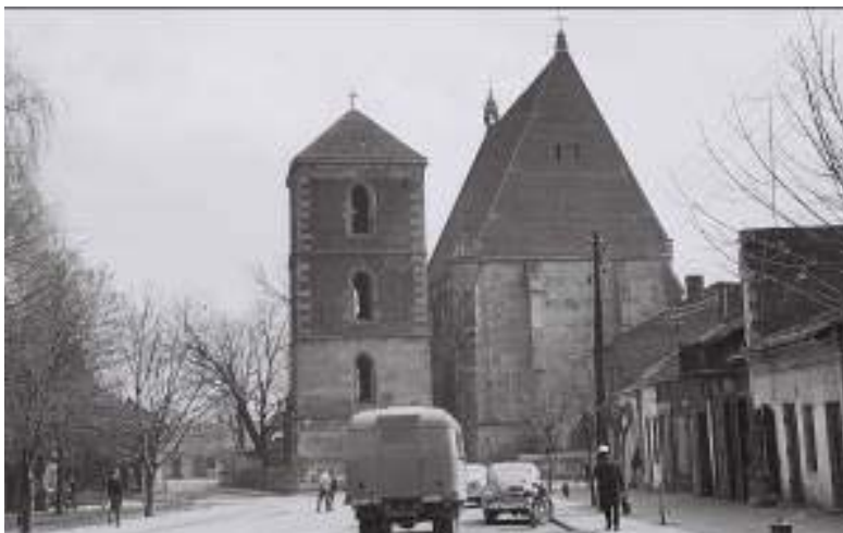
Il.2. Widok na kolegiatę w Wiślicy od strony rynku w latach 60-tych XX wieku.

Ill. 2. View of the collegiate church in Wiślica from the market square in the 1960s.