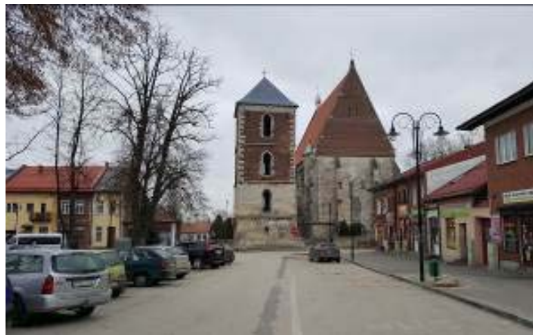
Il.3. Widok na kolegiatę w Wiślicy od strony rynku obecnie.

Ill. 3. View of the collegiate church in Wiślica from the market square nowadays.