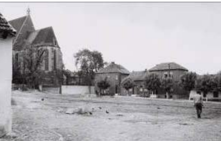
Il. 4. Widok na kolegiatę w Wiślicy od strony Placu Solnego w latach 60-tych XX wieku.

Ill. 4. View of the collegiate church in Wiślica from the Salt Square in the 1960s.