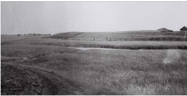
III.1. Widok na grodzisko w „Łąkach” w latach 60-tych XX wieku.

III.1. View of the hillfort in “Łąki” in the 1960s.