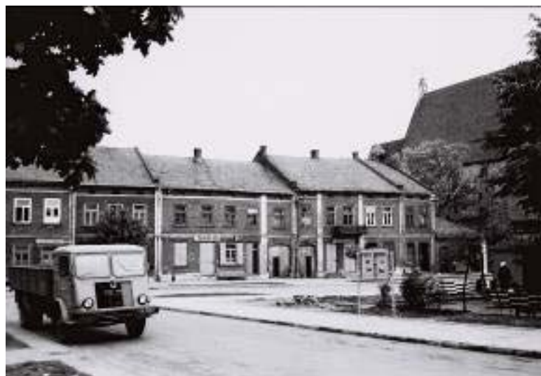
Il. 6. Widok na fragment rynku w Wiślicy w latach 60. XX wieku.

Ill. 6. View of a fragment of the market square in Wiślica in the 1960s.