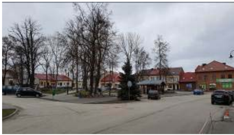
Il. 9. Widok na fragment rynku w Wiślicy – narożnik południowo-zachodni.

Wracając do problematyki układu urbanistycznego Wiślicy, który wytyczono w wieku XIII, należy dodać, że centrum miasta zajął rynek o wymiarach