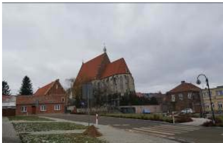
Il. 5. Widok na kolegiatę w Wiślicy od strony Placu Solnego obecnie.

Dawne miasto Wiślica jako zespół osadniczy powstało w okresie wczesnego średniowiecza. Wówczas to wykrystalizowały się najcenniejsze elementy tego zespołu takie jak: grodzisko w „Łąkach”, zlokalizowane na płd-wsch. od historycznego centrum miasta; drugie grodzisko zlokalizowane na najwyższym wzniesieniu terenowym, nazwane przez Jana Długosza „in Regio” oraz osada podgrodową, która rozwinęła się wokół kościoła św. Mikołaja i drugiego przedlokacyjnego kościoła położonego w miejscu późniejszej gotyckiej kolegiaty. Na przełomie XII i XIII wieku w Wiślicy dalej rozwijało się osadnictwo. Miała to związek przede wszystkim ze szczególnie dogodnym położeniem tego ośrodka: na starym trakcie handlowym łączącym Kraków z Sandomierzem oraz w rozlewiskach Nidy, co sprzyjało obronności. Wówczas to powstała osada przy kościele św. Marcina. Była ona położona w płd.-wsch. części miasta, przy dawnym trakcie prowadzącym do grodziska w „Łąkach”; oraz położona „extra muros” osada przy kościele św. Wawrzyńca, tworząca, na północ