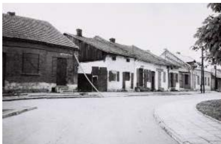
Il. 7. Widok na fragment rynku w Wiślicy w latach 60-tych XX wieku.

Ill. 6. View of a fragment of the market square in Wiślica in the 1960s.