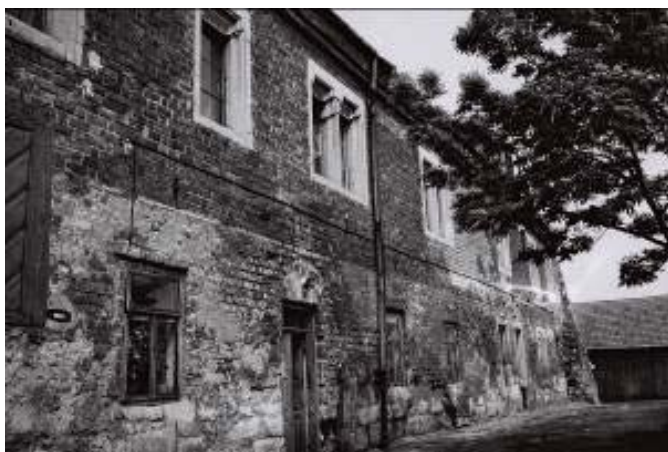
Il. 10. Widok na dom Długosza w latach 60-tych XX wieku.

Ill. 10. View of the House of Długosz in the 1960s.