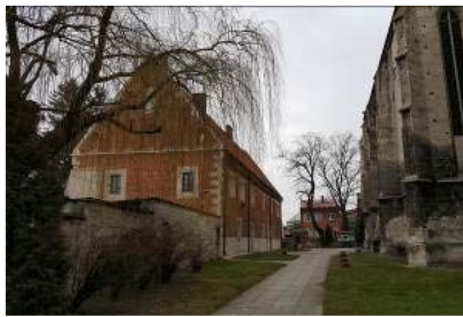
Il. 11. Widok na dom Długosza w Wiślicy obecnie. Fot. Autorzy, 2016.

Ill. 10. View of the House of Długosz in the 1960s. Photo: [in:] Archive of the Chair of History of Architecture, Urban Planning and Popular Art, Faculty of Architecture, Cracow University of Technology (further: KHAUiSzP WA PK), s.v.