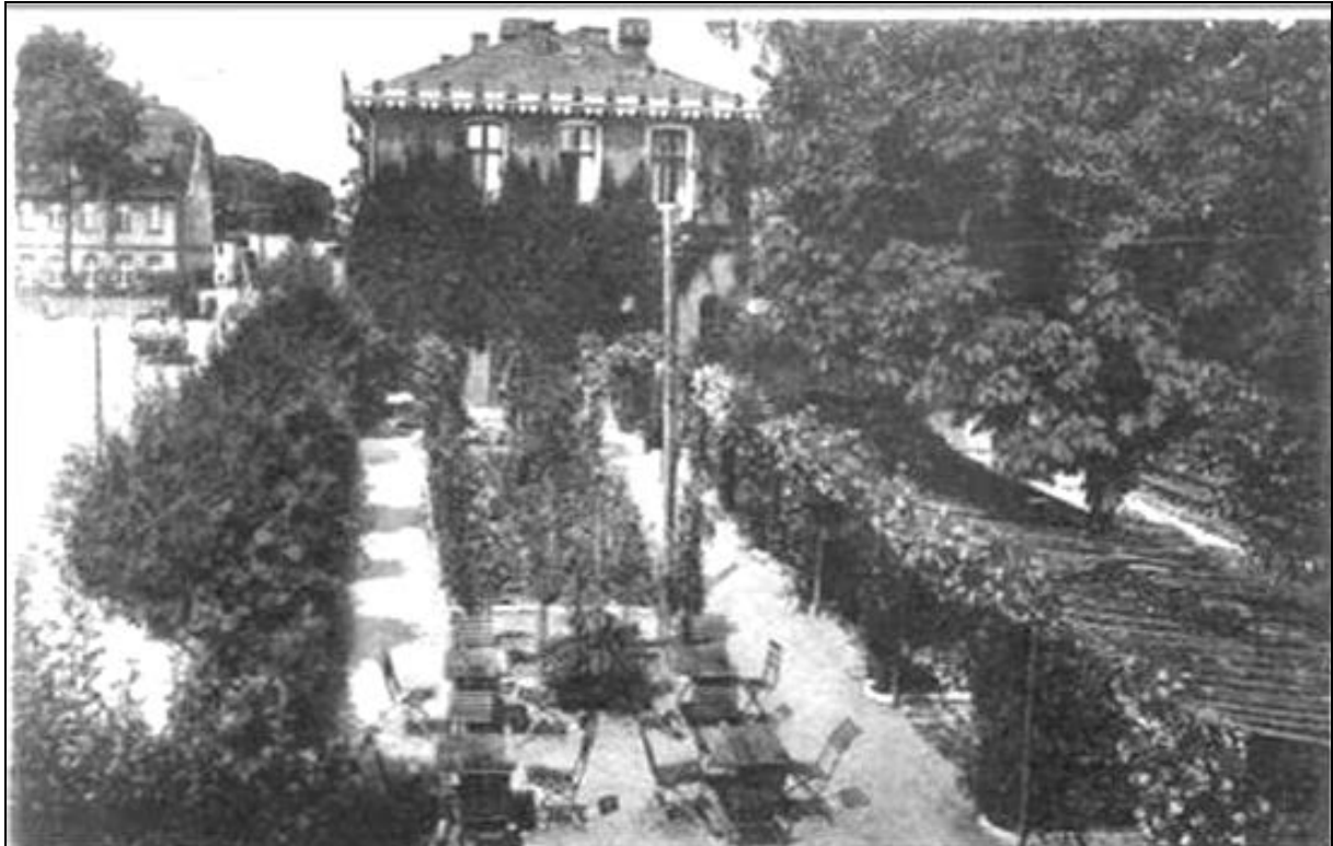
Fot. 2. Promenada Wagnera, południowo-wschodnia część dworca kolejowego, Bahnhofwirtschaft Bartenstein, Ostpreussen.