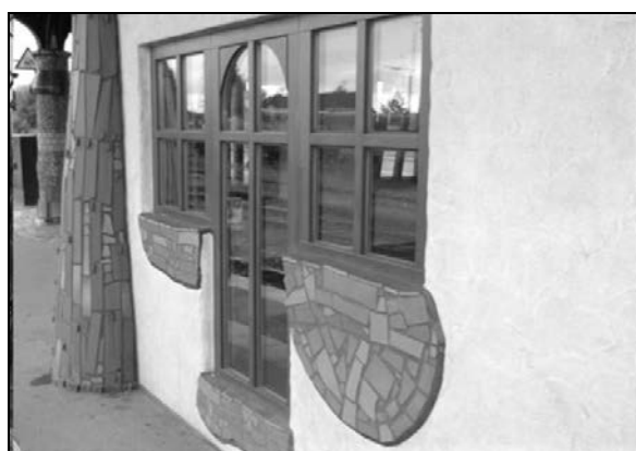
Fot. 1. Hundertwasser Bahnhof w Uelzen (Dolna Saksonia): budynek dworca oraz infrastruktura na peronach.