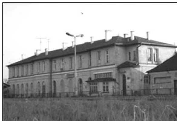
Fot. 3. Obecny stan budynku dworca od frontu i peronów.