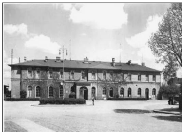
Photo 4. The railway station from Plac Dworcowy view after 1945.