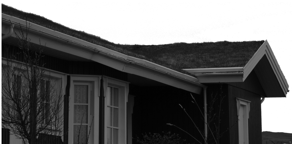
Rys. 2. Budynek z zielonym dachem - Sólheimar Ecovillage

Fig. 1. The building with a green roof - Historical Village and Museum Arbaejarsafn