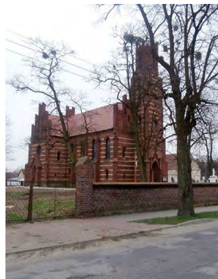
Ryc. 5. Kościół pw. Najświętszego Serca Pana Jezusa XIX w. w Szczepanowie

Fig. 4. Church dedicated to St Stephen in Szczepanów