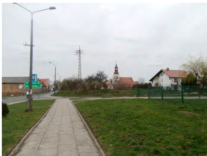
Ryc. 2. Kościół w Ciechowie

Tożsamość wsi wzbogacają także tradycja, kultura i poczucie wspólnoty. W Ciechowie organizowane są festyny z okazji dnia dziecka i końca wakacji, odpust w kościele parafialnym (24 maja), dożynki gminne, obchodzone są Mikołajki, Andrzejki i opłatek. W Rakoszycach ma miejsce procesja Bożego Ciała, organizowane są dożynki, piknik rodzinny, dzień kobiet, dzień seniora i opłatek. Natomiast w Szczepanowie odbywają się dożynki, odpust parafialny (św. Szczepana, 26 grudnia) i uroczystość