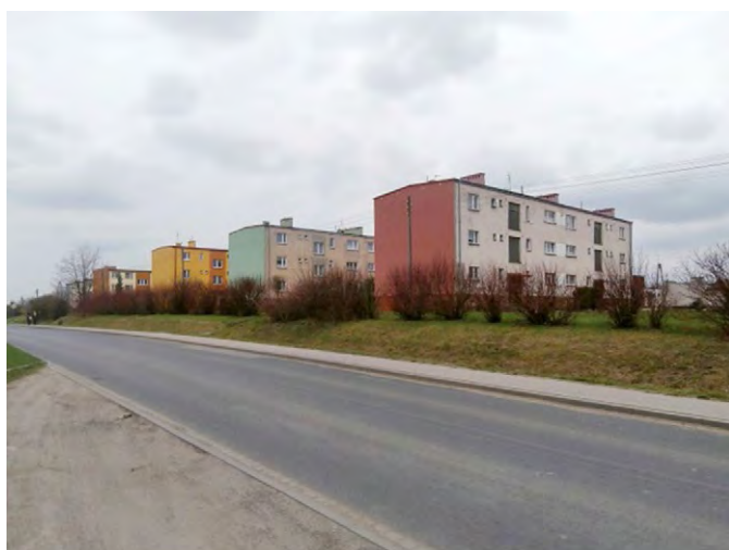
Ryc. 6. Nieodpowiednia kolorystyka bloków w Ciechowie, która miała na celu ożywienie przestrzeni, niekorzystnie zaakcentowała te budynki

On the image of villages negatively affect: building of state-owned collective farm's block of flats (Fig. 6, 7, 8), buildings nearby (Fig. 9), shops (Fig. 11) and falling apart