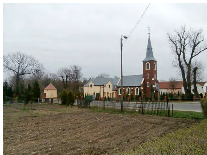
Ryc. 3. Kościół filialny w Rakoszycach

Fig. 2. Church in Ciechów