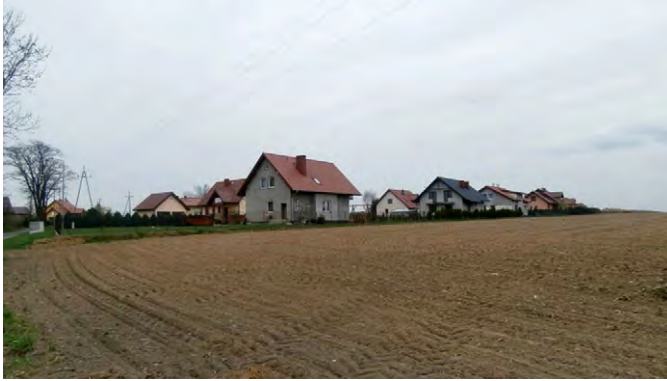
Ryc. 13. Widok osiedla powstającego w zachodniej części Rakoszyc