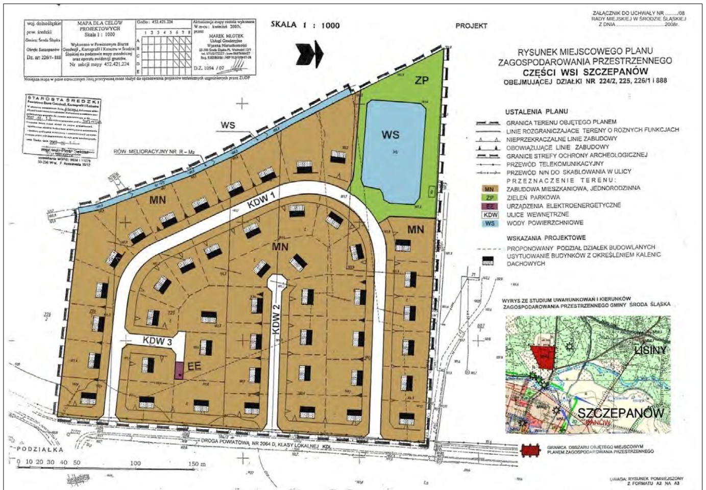
Ryc. 15. Miejscowy plan zagospodarowania przestrzennego części wsi Szczepanów obejmującej działki nr 224/2, 225, 226/1 i 888 położone w północnej części miejscowości w otoczeniu lasów (Urząd Miasta i Gminy Środa Śląska)