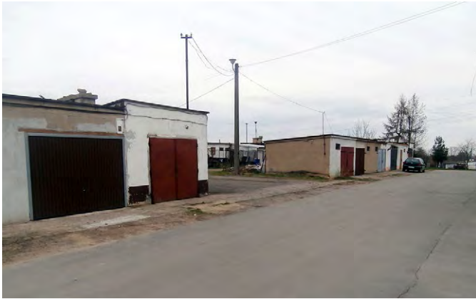
Ryc. 9. Garaże towarzyszące blokom