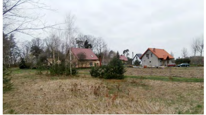
Ryc. 14. Nowa zabudowa rozproszona na terenie wsi Szczepanów