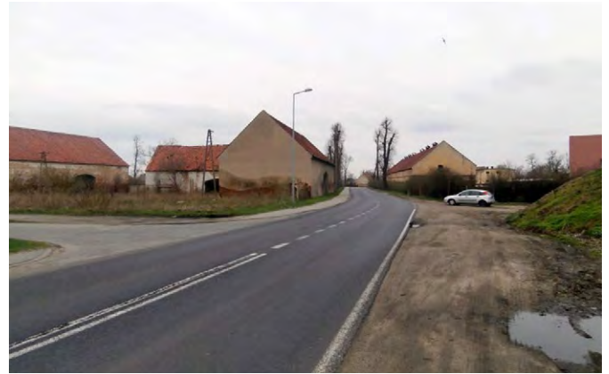
Ryc. 10. Pustostany w Rakoszycach