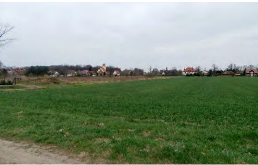
Ryc. 16. Panorama wsi Szczepanów