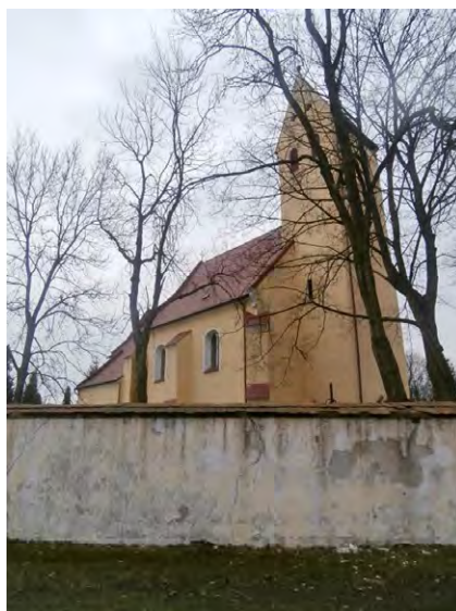
Ryc. 4. Kościół pw. św. Szczepana w Szczepanowie

Identity of village is enriched by tradition, culture and sense of community. In Ciechów, they organize feasts on the occasion of Children's Day and end of vacation, indulgence in parish church (24th of