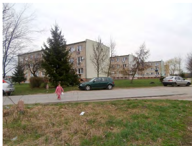
Ryc. 7. Zabudowa wielorodzinna w Rakoszycach

Fig. 6. Improper coloring of block of flats in Ciechów which aimed at reviving space but negatively accentuated these buildings