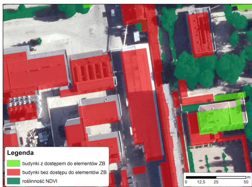
Rys.5. Wynik analizy dotyczącej odprowadzania wody deszczowej dla dzielnicy Łódź – Śródmieście

dotyczyła kryterium: na gruntach ornych o powierzchni większej niż 2 ha lub w ich bliskim sąsiedztwie powinien znajdować się zbiornik lub ciek wodny . Założono, że dla gruntów ornych o powierzchni mniejszej niż 50 ha pozytywny wpływ zbiorników i cieków wodnych jest istotny niezależnie od ich rozmieszczenia, wielkości oraz ilości, natomiast dla gruntów ornych o powierzchni większej niż 50 ha wspomniane parametry BI mają znaczenie. Pierwszy zautomatyzowany etap to utworzenie narzędzia generującego warstwę dotyczące gruntów: o powierzchni < 50 ha spełniających kryterium, o powierzchni \geq 50 ha potencjalnie spełniających kryterium oraz tych, które go nie spełniają. Natomiast drugi etap tej analizy, to fotointerpretacja ortofotomapy dla gruntów ornych, potencjalnie spełniających kryterium. Ocenie podlega rozmieszczenie, ilość oraz wielkość zbiorników wodnych. Pozwala to na ostateczną ocenę, czy dany grunt spełnia założone wymagania.