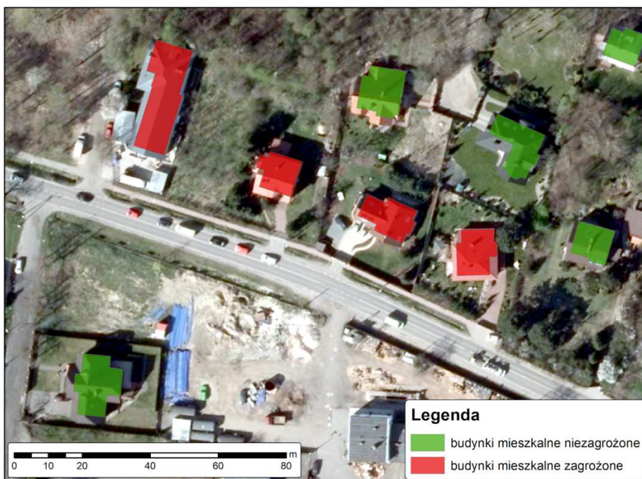
Rys. 4. Wynik analizy dotyczącej dróg i roślinności wysokiej dla gminy Brwinów

ich negatywne oddziaływanie) oraz budynki niezagrożone – znajdujące się daleko od dróg (rys. 4).