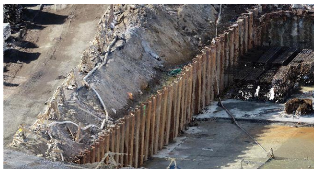
Rys. 2. Widok na fragment chmury punktów – wykop

W pierwszym przypadku uzyskana w wyniku wykonanego nalotu BSP dokumentacja wizualna jest przetwarzana w dane przestrzenne (m.in. chmurę punktów) z zastosowaniem specjalistycznego oprogramowania fotogrametrycznego. W drugim przypadku zgromadzone dane mogą być wykorzystane od razu po zgraniu z urządzenia, jednak koszt ich pozyskania jest najczęściej wyższy niż w pierwszym przypadku. Efektem finalnym inwentaryzacji z użyciem obu technik jest m.in. chmura punktów – rysunek 2.