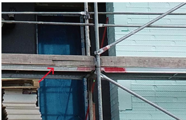
Rys. 6. Widok na uszkodzoną deskę krawężnikową – zdjęcie wykonane za pomocą drona