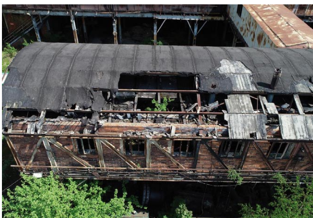
Rys. 4. Kontrola stanu technicznego kompleksu przemysłowego za pomocą drona – fragment analizowanego budynku grożącego zawaleniem

zagrożeń, takich jak: możliwość upadku pracownika z wysokości, możliwość uderzenia spadającym fragmentem konstrukcji itp. Rozwiązaniem powyższego problemu jest wykorzystanie w procesie kontroli stanu technicznego obiektu, bezzałogowego statku powietrznego. Umożliwia to zgromadzenie obszernego materiału zdjęciowego obrazującego ewentualne uszkodzenia obiektu oraz pozwala na opracowanie produktów pochodnych tj. chmury punktów zewnętrznej części konstrukcji lub ortofotoplanów elewacji, które mogą stanowić wysokiej jakości dokumentację pozwalającą podnieść jakość wykonanej ekspertyzy.