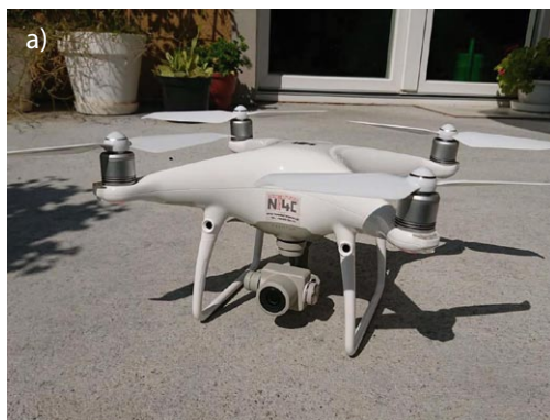
Rys. 1. Bezzałogowy statek powietrzny wyposażony w: a) aparat, b) skaner laserowy