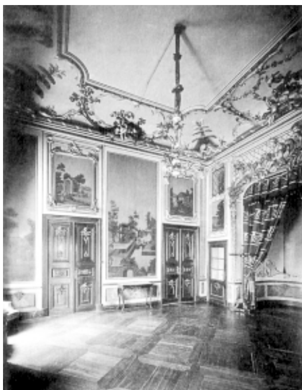
Pałac w Jelgawie. Sypialnia książęca. Stan z 1913 r.