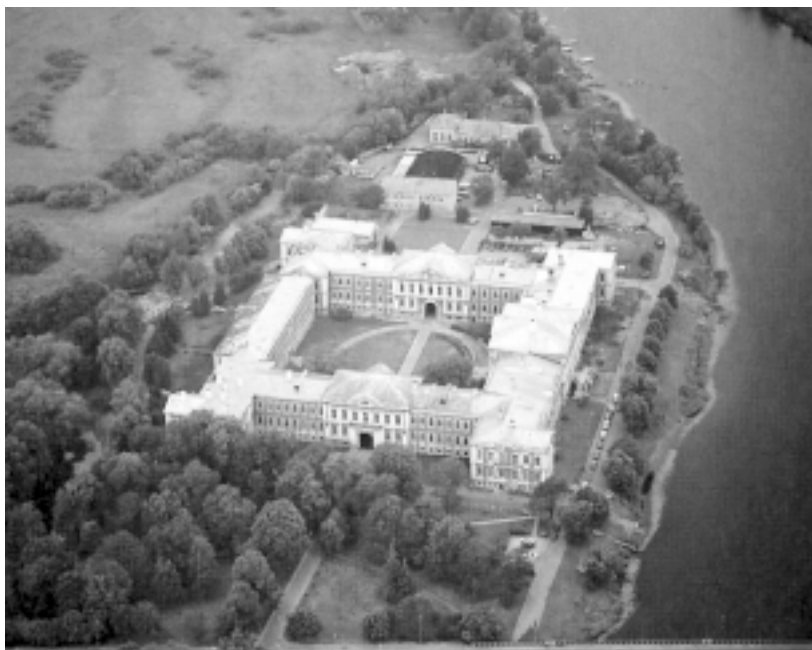
Pałac w Jelgawie. Widok z lotu ptaka