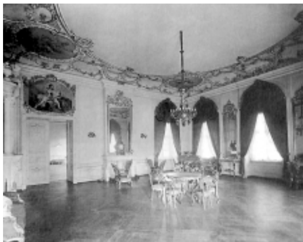
Pałac w Jelgawie. Salon złoty. Stan z 1913 r.