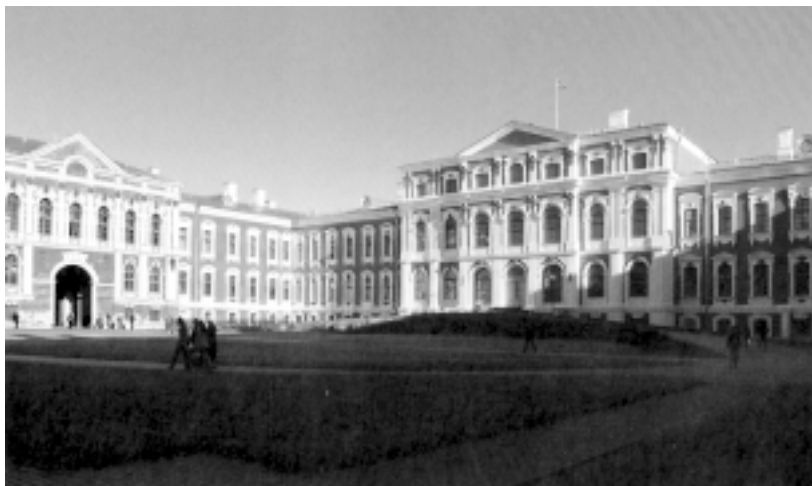
Pałac w Jelgawie. Fasada zachodnia (główna) i fasada północna