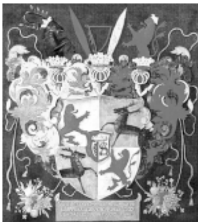
Herb rodu Kettlerów