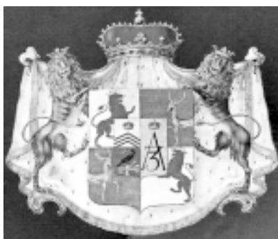
Herb rodu Bironów