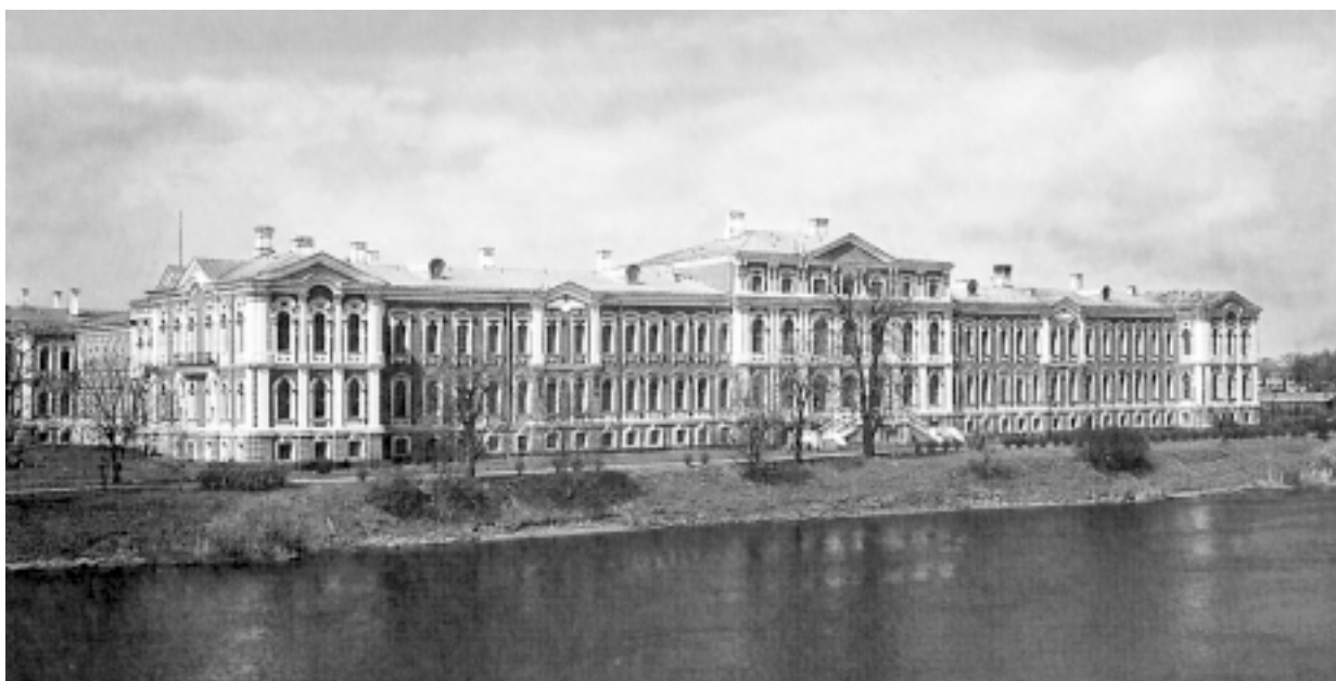
Pałac w Jelgawie. Widok od strony południowo-wschodniej