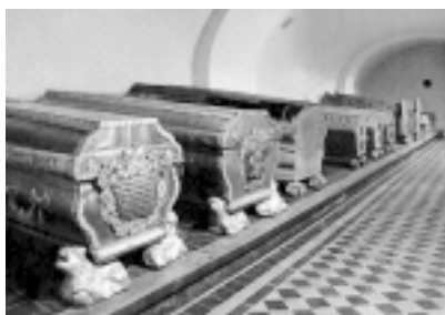
Krypta grobowa książąt Kurlandii