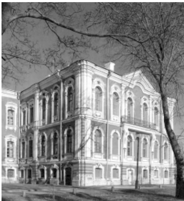
Pałac w Jelgawie. Ryzalit boczny, południowo-wschodni, mieszczący apartamenty książęce