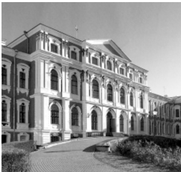
Pałac w Jelgawie. Ryzalit centralny