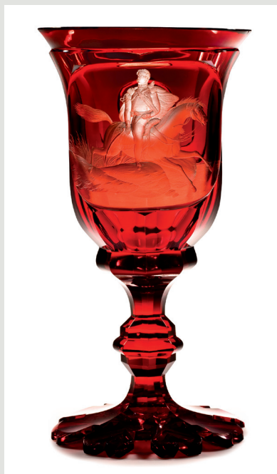
Rys. 1. Puchar, Czechy, szkło, huta hrabiów von Harrach w Neuwelt (Nový Svět), dekoracja rytowana – Emanuel Hoffmann (?) w Karlsbadzie (ob. Karlowe Wary), ok. 1845.

upamiętniania ważnych prywatnych rocznic i wydarzeń, najczęściej w postaci kosztownych pucharów z ogromnie wtedy modnego materiału – kryształowego, bezbarwnego, a potem również kolorowego szkła. Najbardziej znane było w Europie barwne szkło pochodzące z wytwórni na terenie Czech, eksportowane także do Ameryki Północnej i Południowej. W latach 30., 40. i 50. XIX w. pamiątkowe naczynia były zdobione rytowanymi, rzadziej malowanymi portretami osób prywatnych, postaci historycznych, władców i osobistości życia politycznego. Osobną grupę, bardzo liczną, stanowiły tzw. szkła uzdrowiskowe, czyli pamiątki z pobytu w uzdrowiskach: najsłynniejszych w środkowej Europie: Karlsbadzie i Franzensbadzie (ob. Františkovy Lázně) oraz śląskich, takich jak Cudowa (Kudowa-Zdrój), Landeck (Łądek-Zdrój), Warmbrunn (Cieplice-Zdrój), Salzbrunn (Szczawno-Zdrój). To właśnie w miejscowościach uzdrowiskowych pracowali w sezonie letnim artyści zdobiący szkło, m.in. najsłynniejszy autor portretów rzeźbionych w szkło, Dominik Biemann (1800–1858), który był czynny głównie w Karlsbadzie odwiedzany przez władców, arystokrację i kuracjuszy z całej Europy [1]. Poza sezonem zdobione szkło można było nabyć w sklepach Pragi i Wiednia. Lata 40. i 50. XIX w. były okresem działalności najlepszych rzeźbiarzy szkła w Czechach. Z tego czasu pochodzi większość pamiątkowych pucharów i szklanic z portretami, scenami rodzajowymi, scenami o tematyce religijnej i batalistycznymi.