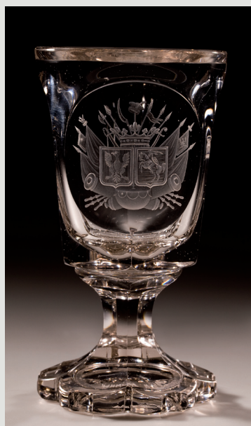
Rys. 6. Pucharek z godłem Królestwa Polskiego, Śląsk lub Polska, huta „Zajaczek” w Jasieniu, ok. 1831.