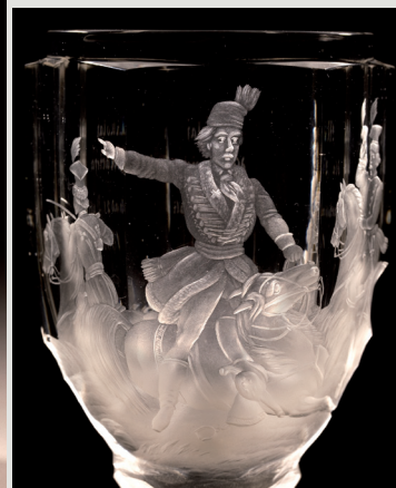
Rys. 9. Puchar pamiątkowy (fragment), Czechy, szkło, huta hrabiów von Harrach w Neuwelt, dekoracja rytowana – Johann F. Hoffmann w Karlsbadzie, dat. 1863.

misterną dekoracją szlifowaną „płaski kamień”. Na ścianie frontalnej w owalnym medalionie umieszczono rytowane symbole trzech cnót teologicznych: wiary, nadziei i miłości oraz napis w języku polskim: Żyj słodka nadziejo! (fot. 7). Napis ten, niebudzący podejrzeń carskich cenzorów, mógł być interpretowany przez Polaków jako przypomnienie o nadziei na wolność, która kiedyś nadejdzie.