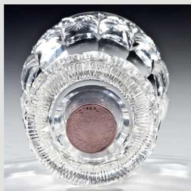
Rys. 4. Dno szkalanicy z monetą, Czechy, szkło, huta hrabiów von Harrach w Neuwelt, 1831.

Powstańcy i patrioci polscy uchodzący z kraju przed prześladowaniami carskimi unosili drobne pamiątki z czasów walki i krótkiej wolności. Należały do nich monety z czasów Królestwa Polskiego 1830–1831 z godłem Królestwa na rewersie: Orłem Polskim i Pogonią Litewską. Ciekawym przykładem pamiątki szklanej