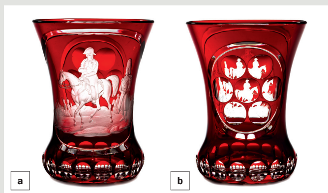
Rys. 3a, 3b. Szkalanica pamiątkowa, Czechy, szkło, huta hrabiów von Harrach w Neuwelt, dekoracja rytowana – Emanuel Hoffmann (?) w Karlsbadzie, ok. 1845.

rozeta harrachovska. Odbija się w niej zwielokrotniona dekoracja ze ścianki przedniej (fot. 3b). Na spodzie dna wyszlifowano złożoną rozetę gwiaździstą zbudowaną ze szlifów klinowych.