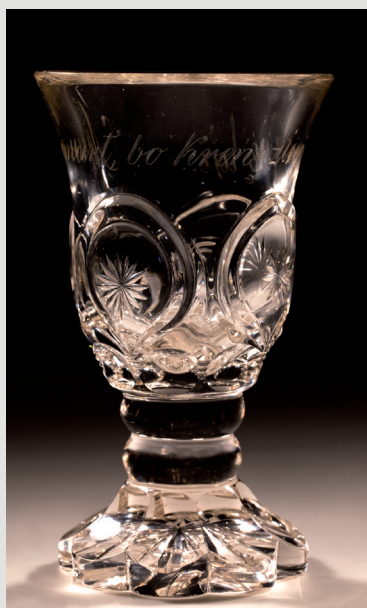
Rys. 8. Pucharek, Śląsk lub Polska, huta „Zajaczek” w Jasieniu, dat. 1839.