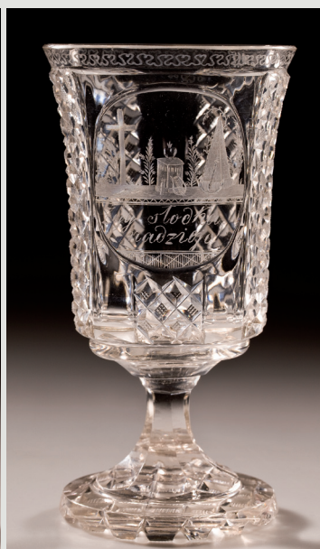
Rys. 7. Pucharek, Polska, huta „Zajaczek” w Jasieniu, ok. 1831.