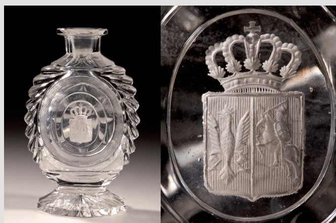
Rys. 5. Flakonik toaletowy, Czechy, szkło, huta hrabiów von Harrach w Neuwelt, po 1831.

Miniaturowa plakietka z białego biskwitu porcelanowego z wyciśniętym reliefowym godłem Królestwa Polskiego z lat 1830–1831, zatopiona w szkłe, zdobi niewielki szlifowany flakonik toaletowy (fot. 5). Ten luksusowy przedmiot mógł być elementem damskiego zestawu podróznego. W końcu 1 ćw. XIX w. sposób dekorowania plakietkami biskwitowymi (z przedstawieniami religijnymi, portretami sławnych osobistości, herbami) naczyń szklanych przejęła z Francji wytwórnia szkła hrabiów von Harrach w Neuwelt. Tak dekorowane ozdoby, a także użytkowe naczynia powstawały w latach 30. i 40. XIX w. [6]