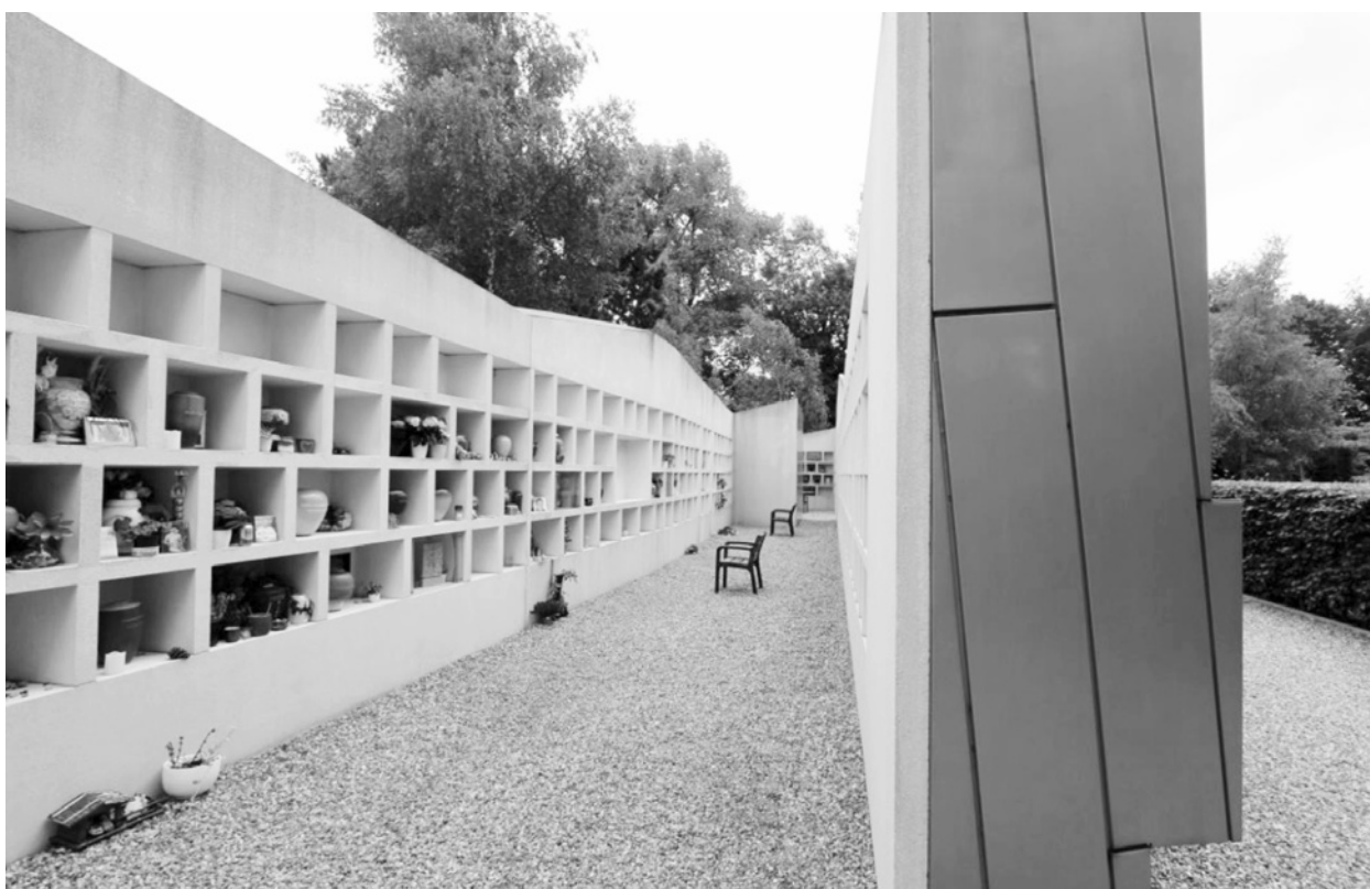
Ryc. 9. Wnęki na urny pozostawiono puste – nie są przysłaniane żadną tablicą, co pozwala na większą swobodę w jej zagospodarowaniu. Nawet wielkości otworów są różne, co wzmaga poczucie nieskrępowania formą. Cmentarz de Nieuwe Ooster w Amsterdamie

Wzrastająca popularność pochówków urnowych wiąże się z kilkoma czynnikami – od ekonomicznych (zarówno sama kwatery, jak i urna są o wiele tańsze od tradycyjnej trumny i kamiennego pomnika), poprzez ekologiczną (wiele osób nie chce „zabierać sobą” zbyt wiele miejsca), estetyczne (co dzieje się z ciałem po śmierci), aż po kwestie związane z pewną modą, ogólnym trendem. Jeśli chodzi o formę, kolumbaria to na ogół mało wyszukane pod względem estetycznym