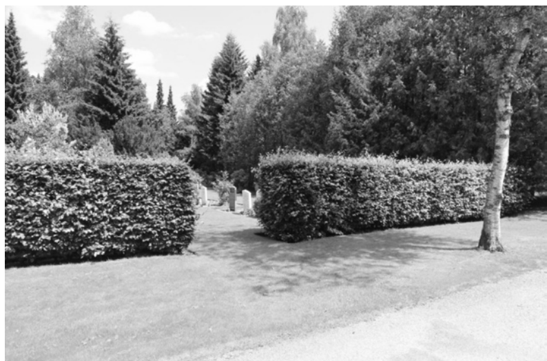
Ryc. 12. Wydzielenie obszaru pod pochówki powoduje, że można korzystać z pozostałej przestrzeni cmentarza jak z parku.

Cmentarz Heidehof w Apeldoorn, Holandia Fig. 12. Separation of the area for burials makes it possible for the remaining space of the cemetery to be used as a park. Heidehof Cemetery in Apeldoorn, Netherlands