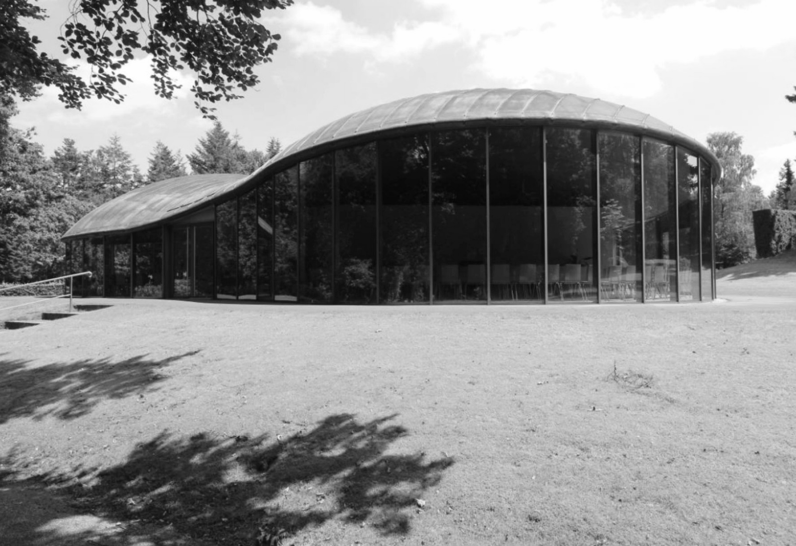
Ryc. 17. Miejsce spotkań i wypoczynku wyposażone w samoobsługową kawiarenkę na cmentarzu w Apeldoorn w Holandii.

Projekt biura architektonicznego Moriko Kira (2008)