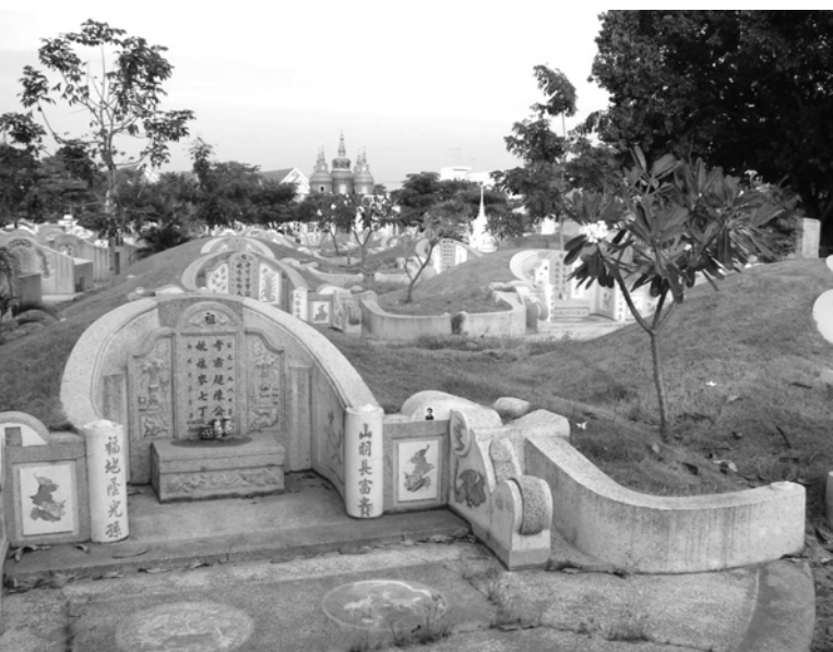
Fot. 6. Tak wystawny nagrobek to marzenie niejednego miłującego tradycję Chińczyka. W samych Chinach na ten rodzaj nagrobka może sobie pozwolić raczej tylko najbogatsza warstwa społeczeństwa. Cmentarz chiński w Kanchanaburi w Tajlandii

Fig. 5. Not very impressive, office-like interior of the columbarium building in the area of beautiful and greatly interesting Vagankovo Cemetery in Moscow