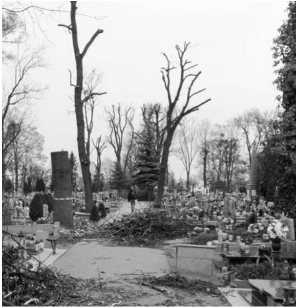
Ryc. 14. Wycinka gałęzi lub całych drzew na cmentarzach to zawsze przygnębiający widok. Obcięte kikuty nie dodają blasku nawet najbardziej urokliwej nekropolii. Cmentarz parafialny w Śremie, woj. wielkopolskie; fot. autorka

Fig. 14. Cutting old trees on cemeteries creates a depressing view. Tree stumps never add charm. Parish cemetery in Srem, Greater Poland Voivodeship; photo by the author