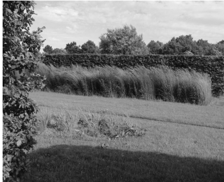
Ryc. 16. Sielankowy nastrój cmentarza w Langedijk; fot. autorka Fig. 16. Idyllic look of Langedijk Cemetery; photo by the author

Fig. 14. Cutting old trees on cemeteries creates a depressing view. Tree stumps never add charm. Parish cemetery in Srem, Greater Poland Voivodeship; photo by the author