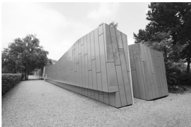
Ryc. 8. Niezwykle nowoczesne, a przy tym tchnące spokojem i elegancją kolumbarium na cmentarzu de Nieuwe Ooster w Amsterdamie

urnowych, zabierających mniej miejsca niż tradycyjne pochówki. Zauważyć można również stopniowy wzrost liczby kremacji, choć Kościół katolicki niechętnie na to przystaje: Kościół zezwala na kremację, „jeśli nie podważa wiary w zmartwychwstanie ciała” (KKK 2301, KPK kan. 1176 § 3).