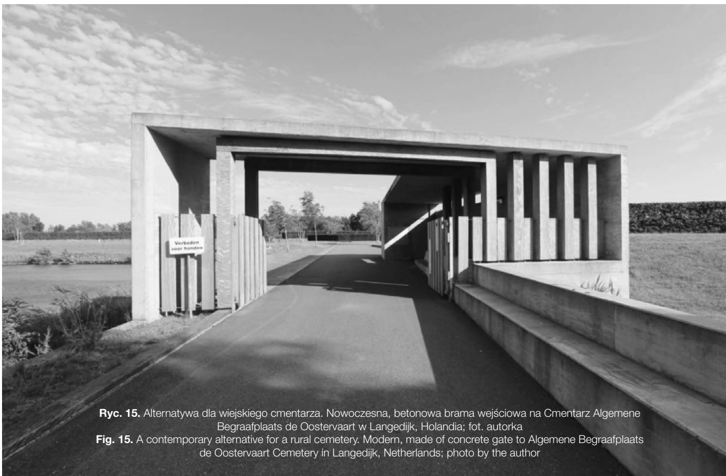
Ryc. 15. Alternatywa dla wiejskiego cmentarza. Nowoczesna, betonowa brama wejściowa na Cmentarz Algemeene Begraafplaats de Oostervaart w Langedijk, Holandia

Fig. 15. A contemporary alternative for a rural cemetery. Modern, made of concrete gate to Algemeene Begraafplaats de Oostervaart Cemetery in Langedijk, Netherlands