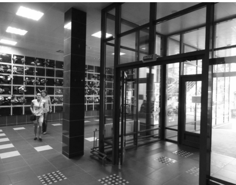
Ryc. 5. Mało oryginalne, wręcz biurowo-sklepowe wnętrze kolumbarium na, skądinąd niezwykle pięknym i interesującym, Cmentarzu Wagańkowskim w Moskwie

Fig. 5. Not very impressive, office-like interior of the columbarium building in the area of beautiful and greatly interesting Vagankovo Cemetery in Moscow