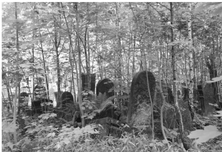
Ryc. 3. Mnogość macew na żydowskich cmentarzach wiąże się z zakazem likwidacji grobów. Przetrawianie ciał do Dnia Sądu Ostatecznego jest tak istotne, że istnieje nawet obostrzenie dotyczące wrywania większych drzew rosnących na grobie: wyciągane korzenie mogłyby spowodować dezintegrację szczątków. Niszczący nowy cmentarz żydowski w Łodzi

Cmentarze w wieżowcach to oczywiście nie-nowy pomysł, aczkolwiek przede wszystkim powstają na świecie wielopiętrowe kolumbaria, a zatem miejsca składania prochów. Tego typu rozwiązania pozwalają na pomieszczenie wielu tysięcy urn na stosunkowo niewielkim terenie. Budowle takie powstawać będą zapewne w najbardziej zatłoczonych metropoliach, zmagających się z coraz większym deficytem miejsca. Estetyka tych miejsc jest bardzo różna. Często są to po prostu nastawione na efektywność i funkcjonalizm