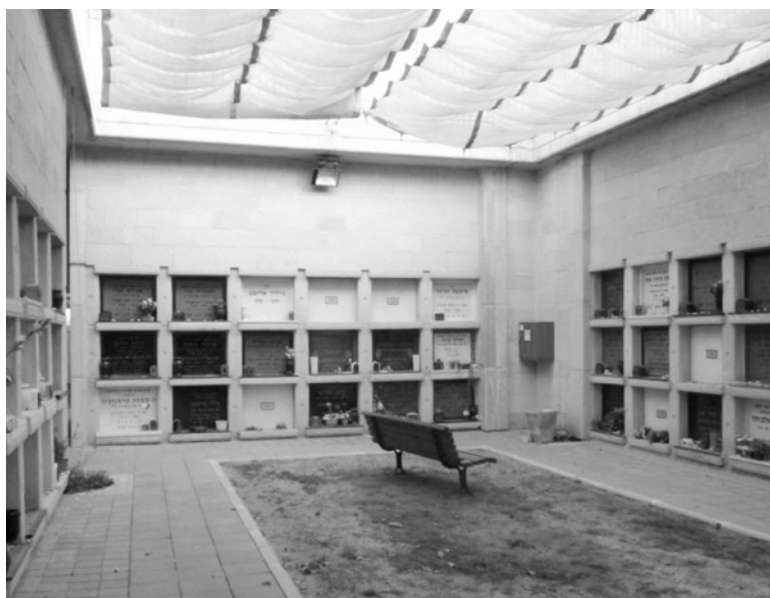
Ryc. 4. Cmentarz zachowujący żydowski obyczaj chowania ciał. Herclijja w Dystrykcie Tel Awiwu, Izrael

Fig. 3. A multitude of gravestones in Jewish cemeteries is the consequence of the prohibition of graves not being liquidated. The most important feature for the graves is to be intact for the survival of the bodies until the Day of Judgment. Therefore it is even forbidden to uproot large trees, growing on the graves: even pulling roots could cause the disintegration of the remains. Almost ruined New Jewish Cemetery in Lodz