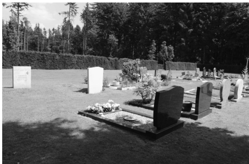
Ryc. 13. W częściach wydzielonych pod pochówki nie sadi się wysokich drzew, nie ma jednak wrażenia przebywania w pustej przestrzeni, gdyż zadrzewione są „parkowe” części cmentarza.

Cmentarz Heidehof w Apeldoorn, Holandia Fig. 12. Separation of the area for burials makes it possible for the remaining space of the cemetery to be used as a park. Heidehof Cemetery in Apeldoorn, Netherlands