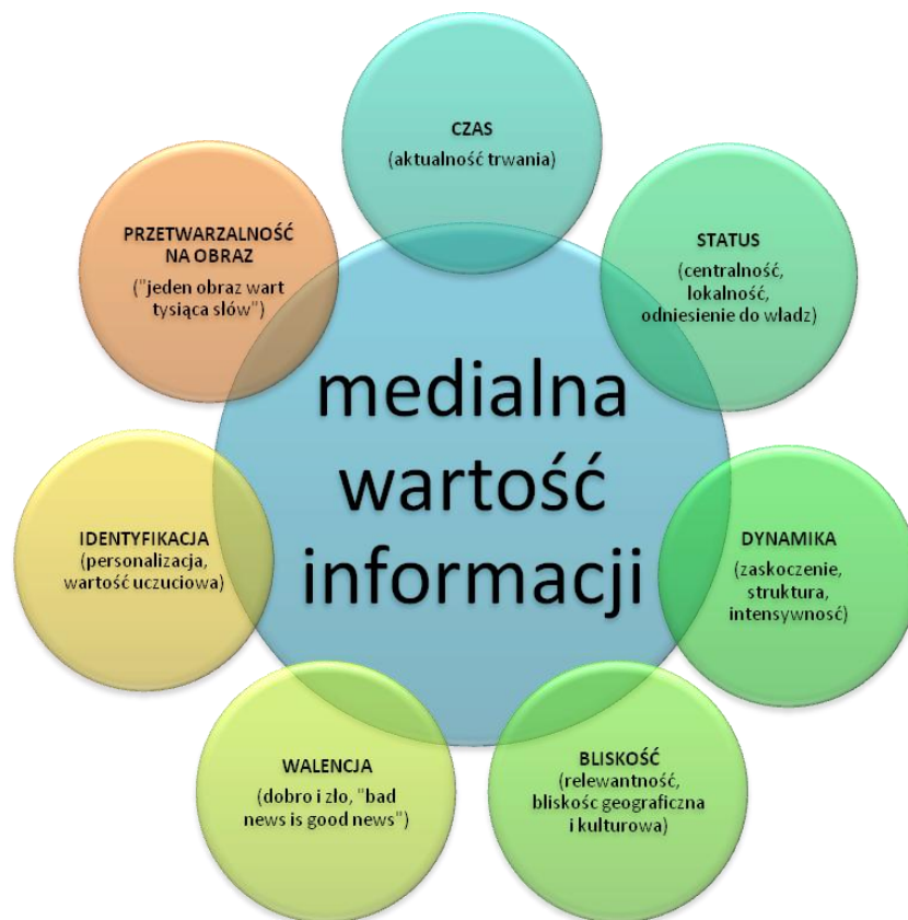
Rys. 3. Czynniki wartościowej medialnie informacji 32

Prawidłowo zinterpretowane dane rozpoznawcze po ostatecznym opracowaniu, stanowią produkt końcowy – w przypadku oficera rozpoznania produkt analityczny, np. prognozę lub raport, a w przypadku oficera prasowego – produkt medialny, np. stanowisko w sprawie lub oświadczenie. Interpretacja danych rozpoznawczych opracowana przez specjalistów, powinna zostać wykorzystana przez dowódcę w ocenie sytuacji, podjęciu decyzji, a ostatecznie uzyskaniu przewagi nad przeciwnikiem lub przewagi informacyjnej i wizerunkowej.