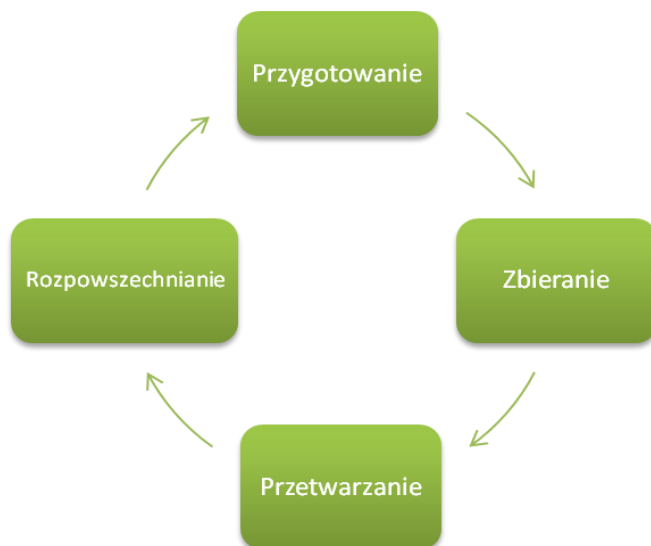
Rys. 2. Klasyczny cykl rozpoznawczy 17

W nowszych opracowaniach pojawiają się bardziej rozbudowane cykle rozpoznawcze, m.in. przedstawiony niżej cykl, obejmujący pięć obszarów działań 18 .