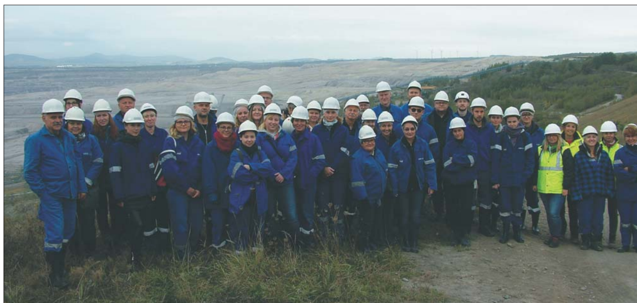
Ryc. 3. Sesja terenowa podczas warsztatów Aspekty administracyjno-prawne i środowiskowo-społeczne odkrywkowej eksploatacji kopalni (Bogatynia, 3–4.10.2018 r.)