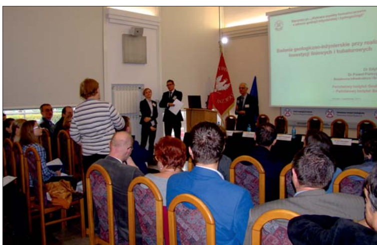
Ryc. 2. Warsztaty pt. Wybrane aspekty formalno-prawne z zakresu geologii inżynierskiej i hydrogeologii (Warszawa, 22.10.2014 r.)

W 2020 r. PIG-PIB rozpoczął kolejny projekt będący kontynuacją zadania Geologia Samorządowa serwis informacyjno – edukacyjny PIG-PIB w zakresie geologii, górnictwa, ochrony środowiska, administracji i przepisów prawa na lata 2020–2024 . Planowane zadania obejmują prowadzenie serwisu internetowego, organizację szkoleń oraz bieżące konsultacje i wsparcie merytoryczne pracowników samorządowej administracji geologicznej. Dzięki kilkuletniej współpracy z jednostkami samorządu terytorialnego, władzami lokalnymi czy urzędami, PIG-PIB ma dobre i wciąż pogłębiające się relacje w środowisku administracji publicznej oraz innych instytucji. Zobowiązuje to instytut do podjęcia działań, które mają na celu dalszy rozwój serwisu i współpracy z jego użytkownikami, m.in. poprzez rozbudowywanie zakładek tematycznych. Aby zapewnić wysoką jakość merytoryczną treści poruszanych na podstronach witryny PIG-PIB rozbudowuje zespół konsultantów współpracujących i tworzących