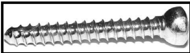
RYS. 1. Śruba zespalająca kość. FIG. 1. The screw joining the bone.

Materiałem badanym była stal austenityczna, co potwierdza przeprowadzona analiza składu chemicznego (RYS. 2).