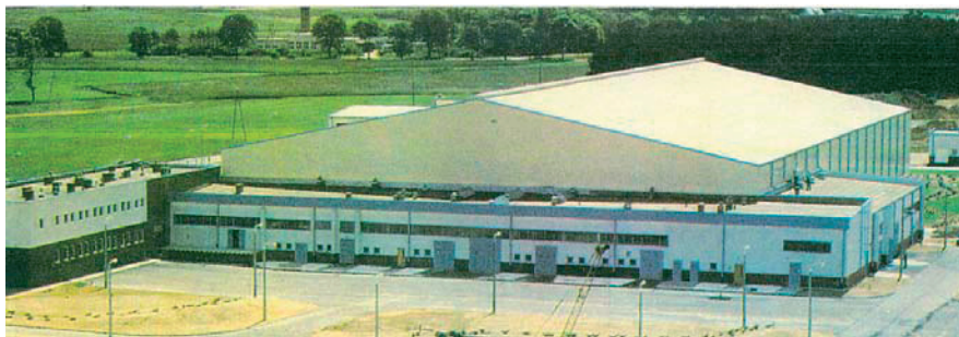
Rys. 1. Chłodnia w konstrukcji stalowej z lekką obudową [3]

Grupę obiektów do przechowywania wymagającą dodatkowego omówienia tworzą przechowalnie i chłodnie komorowe. W nowych chłodniach z normalną i kontrolowaną atmosferą występuje obecnie tylko jeden rodzaj pomieszczenia składowego. Jest to komora. Służy ona do składowania ziemio- plodów luzem i w jednostkach ładunkowych (skrzyniopalety, skrzynki umieszczane na palcie płaskiej). Jest w pełni oddzielona systemem termoizolujących przegród budowlanych od innych pomieszczeń obektu. Ma płaską podłogę. Komora jako najbardziej uniwersalny typ pomieszczenia przechowalniczego pozwala na utrzymywanie odrębnych warunków mikroklimatycznych w każdym z wydzielonych pomieszczeń. Obiekty takie pozwalają na przechowywanie dowolnego rodzaju owoców, warzyw lub ziemniaków w sposób najwłaściwszy dla określonego gatunku czy odmiany. Przechowalnie i chłodnie z komorami i wydzieloną odpowiednio dużą przestrzenią manipulacyjną, zdaniem autorów opracowania, najlepiej odpowiadają wymogom współczesnego przechowalnictwa. Pozwalają one na wielowariantowe wykorzystywanie powierzchni i kubatury obiektu oraz właściwe rozmieszczenie w przestrzeni produkcyjnej ciągów technologicznych i systemów regulujących mikroklimat powierzchni składowych [4].