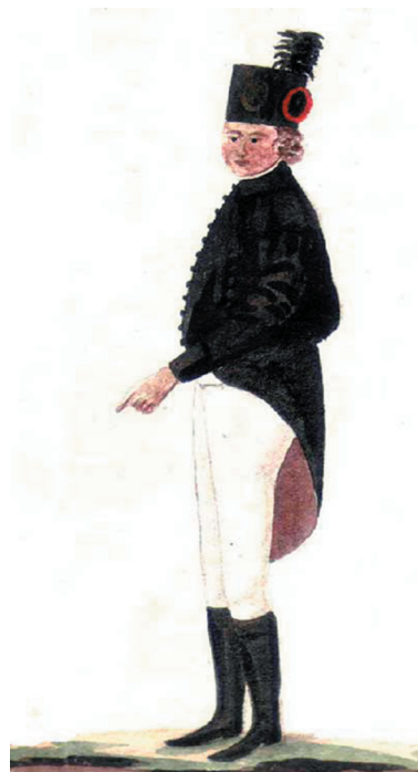
Ryc. 2. Mundur reprezentacyjny cieśli górniczego (Nakaz noszenia i opis mundurów..., 1795)