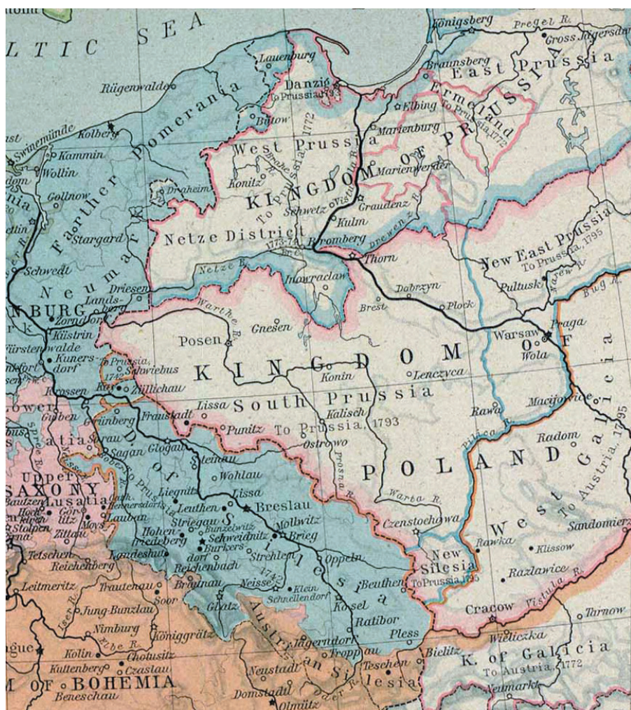
Ryc. 1. Mapa pogranicza Polski i Prus w 1786 roku (Shepherd, 1923)