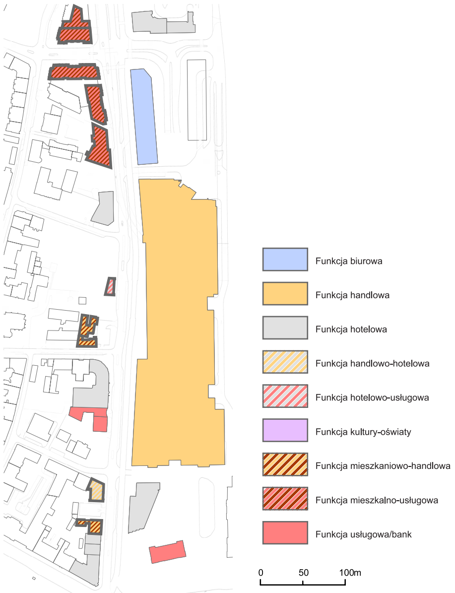
Ryc. 2. Funkcje przestrzeni miejskiej wokół ul. Pawiej w Krakowie