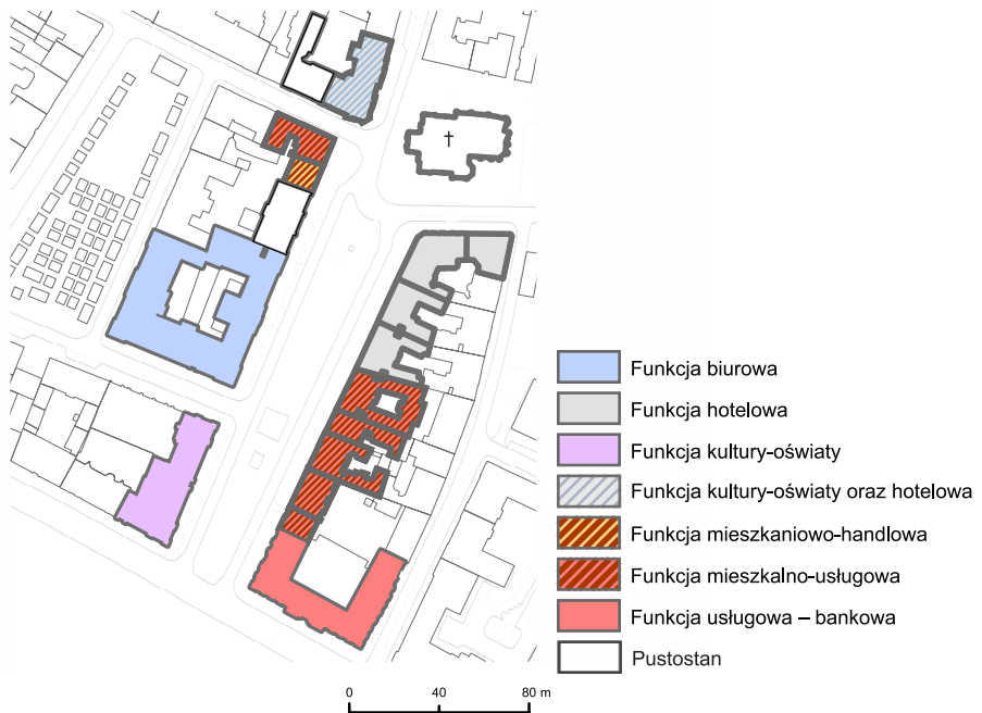
Ryc. 1. Funkcje przestrzeni miejskiej wokół placu Matejki (Kleparz)

w ostatnich latach wyraźnie wzrosła turystyczna funkcja obszaru wokół placu Matejki.