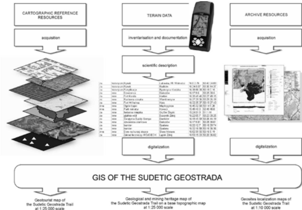
Fig. 2. Sources of GIS data of the Sudetic Geostrada project • Źródła danych GIS wykorzystanych w projekcie Geostrada Sudecka

The essential content of the geological tourist maps is the information on the geological structure. The basis for the development of geological tourism maps of the Sudetes Geostrada (Fig. 3) involves digital, lithostratigraphic, map of the Lower Silesia region, which was developed in the NRI by way of digitizing selected sheet parts of the Polish Geological Map, scale 1 : 200 000 (Grocholski et al. , 1980; Milewicz et al. , 1979; Sawicki, 1980; Wroński, Kościówko, 1982).