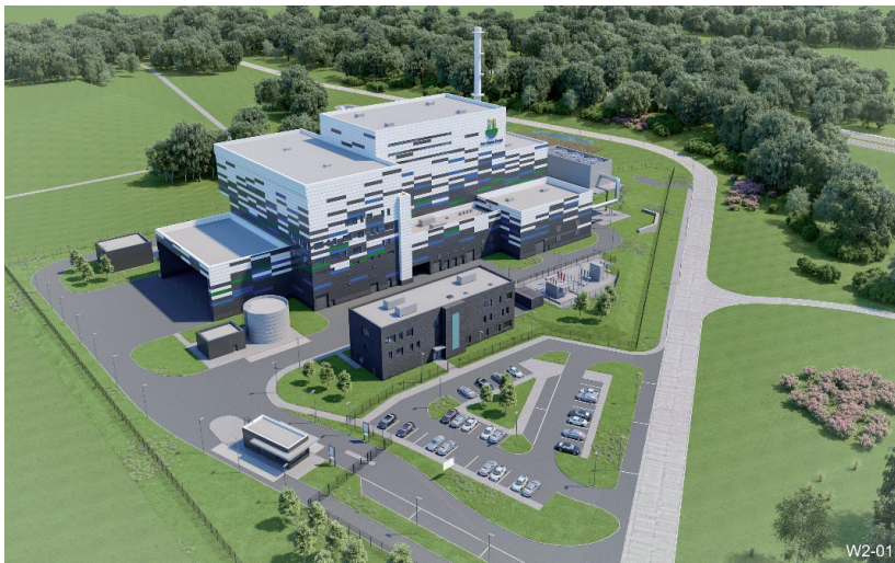
Wizualizacja Zakładu Termicznego Przekształcania Odpadów w Gdańsku

zowanych przez duże miasta, kwoty te zbliżają się do wartości 1000 zł/t, co w porównaniu do średniego kosztu zagospodarowania tych odpadów w spalarniach w Polsce (ok. 250 zł/t) wielokrotnie go przekraczają. Bywa i tak, że w przetargach nie ma żadnych ofert, i to jest sytuacja najbardziej groźna, bo wymusza wiele patologii oraz niebezpiecznych dla ludzi i środowiska skutków. Dla gmin uczestniczących w projekcie, budowa spalarni odpadów komunalnych w Gdańsku, to docelowo wielomilionowe oszczędności każdego roku, a przede wszystkim stabilizacja opłat ponoszonych przez mieszkańców na wiele lat.